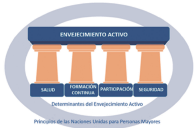
Imagen 2. Pilares del envejecimiento activo. Adaptado de OMS (2002) .

Una forma de concretar que conceptos contiene cada uno de los pilares del envejecimiento activo es acudir al apartado "propuestas políticas fundamentales" del documento "Envejecimiento activo: un marco político" donde encontraremos un desglose más detallado de lo que incluye cada pilar.