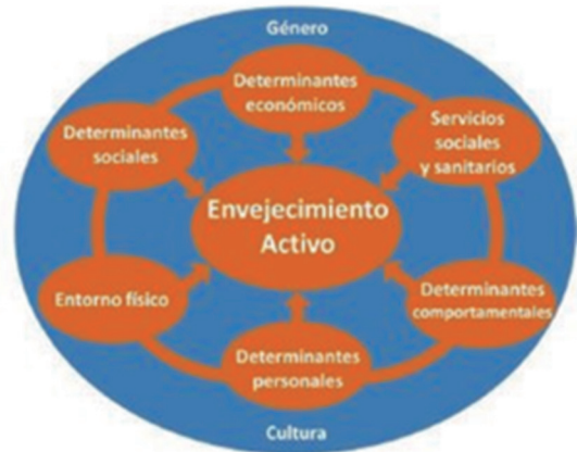
Imagen 1. Determinantes del envejecimiento activo. Adaptado de OMS (2002) .

Una forma de concretar que conceptos contiene cada uno de los pilares del envejecimiento activo es acudir al apartado "propuestas políticas fundamentales" del documento "Envejecimiento activo: un marco político" donde encontraremos un desglose más detallado de lo que incluye cada pilar.