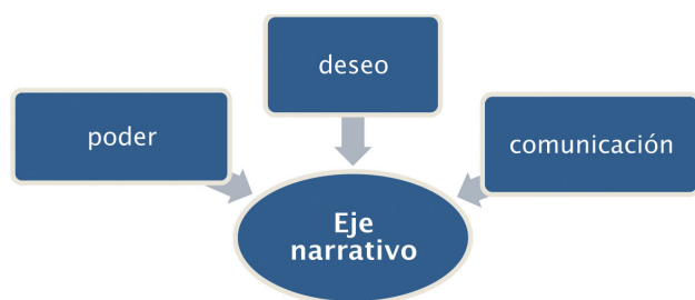
Gráfico 2. Esquema del eje narrativo de Greimas.

Este triple eje –deseo, comunicación y poder– define de forma precisa la relación de nuestro objeto de estudio: el smartphone. Por tanto los tres posibles ejes narrativos se encuentran perfectamente amalgamados en el desarrollo del programa que hemos analizado.