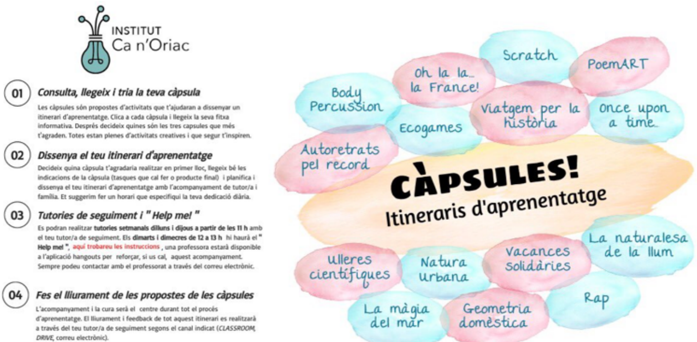
Figura 4. Proyecto “¡Cápsulas! Itinerarios de aprendizaje”. Fuente: Institut Ca n’Oria ( https://agora.xtec.cat/inscanoriac/ ). https://doi.org/10.1007/s11858-017-0842-z