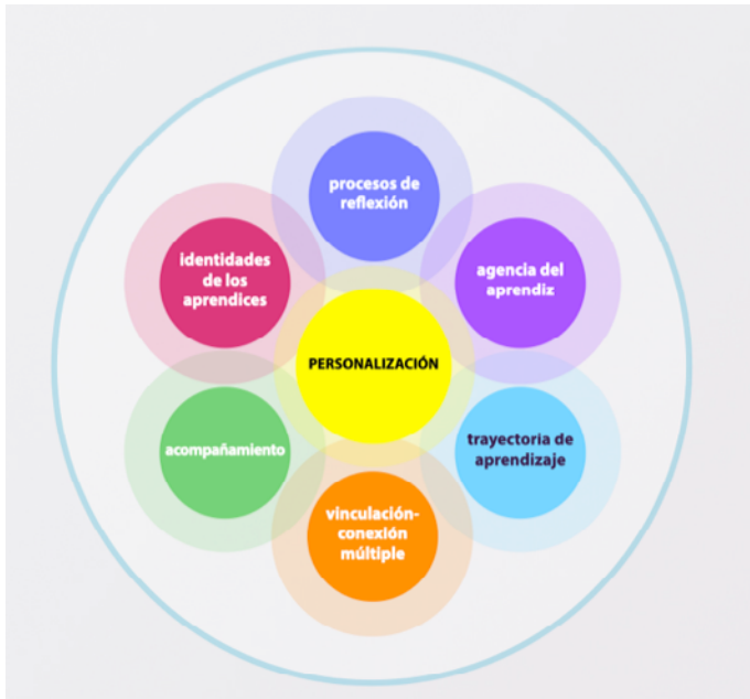
Figura 1. Elementos de la personalización educativa.

En primer lugar, la actuación pedagógica debe partir de las identidades en curso de los y las estudiantes. Ello supone identificar aquellos elementos que son percibidos como relevantes, significativos, por parte de los aprendices, pudiendo ser estos: intereses, conocimientos previos, personas, actividades, instituciones, o artefactos culturales. Supone también atender a la dimensión proyectiva de la identidad en tanto que decisiones y proyectos de vida. En este sentido, entendemos por identidad un proceso constante de (re)significación a partir del impacto y valoración de las personas, actividades, objetos, sitios e instituciones percibidas como significativas por parte del aprendiz en cuestión (Esteban-Guitart, 2016, 2019).