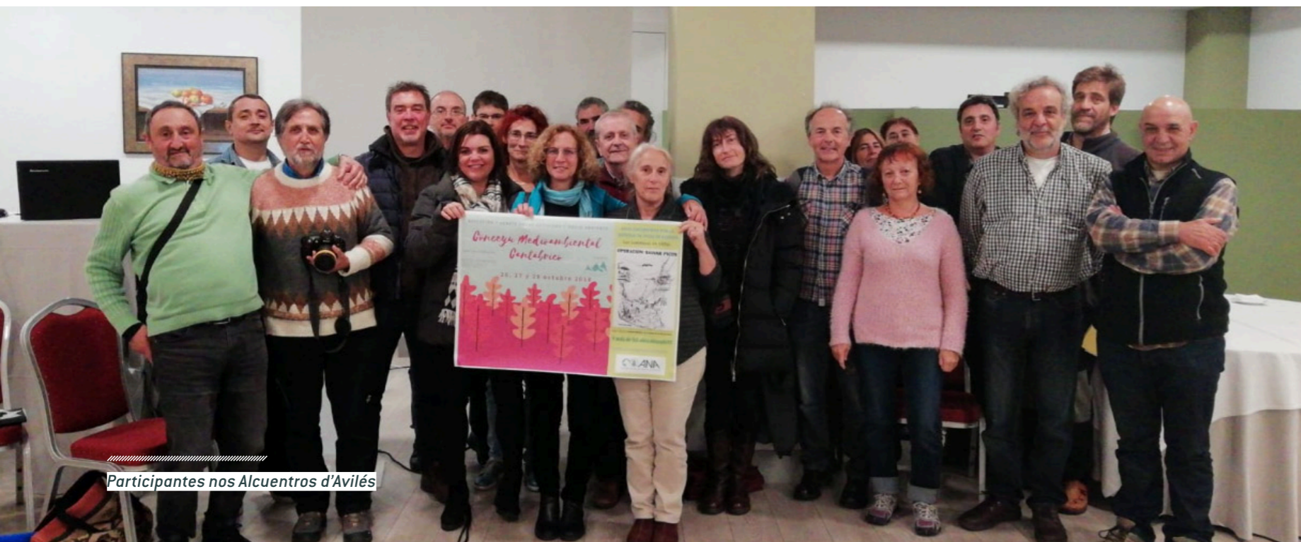
Participantes nos Alcuentros d'Avilés

cinxética siga siendo güei día una actividá que se dexa dentro del PN ye prueba d'ello. Tien de prohibise definitivamente la caza deportiva y escluir la figura de Reserva Rexonal de Caza del espaciu protexíu.