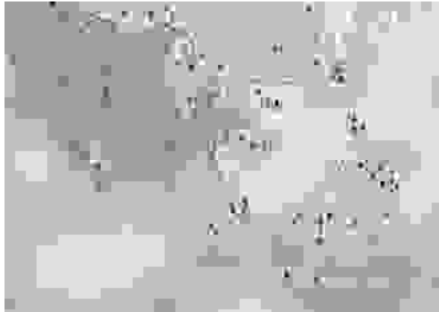
Figura 2. Ubicación geográfica de los 82 pueblos considerados, que aparecen etiquetados con el número de cluster asignado con el procedimiento de Williams y Lambert

las pertenecientes a otros clusters . En el mapa puede observarse cómo los clusters 6, 7, 8 y 9 correspondientes con la presencia de la variable de filiación cognaticia ( clanes ) se sitúan preferentemente en las áreas con lenguajes de tipo malayo-polinésico; mientras que el resto de los clusters aparecen más frecuentemente en la