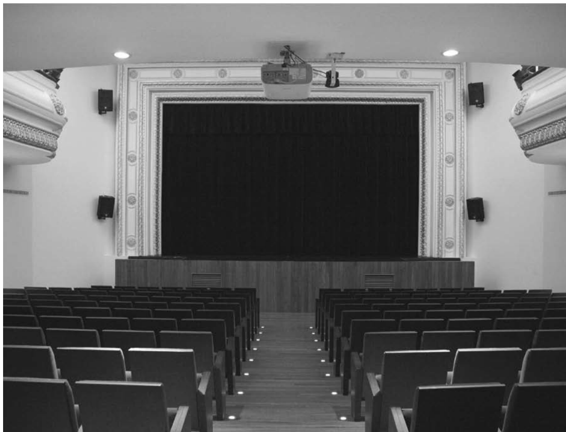
Fig. 3. Patio de butacas, estado anterior y estado reformado.