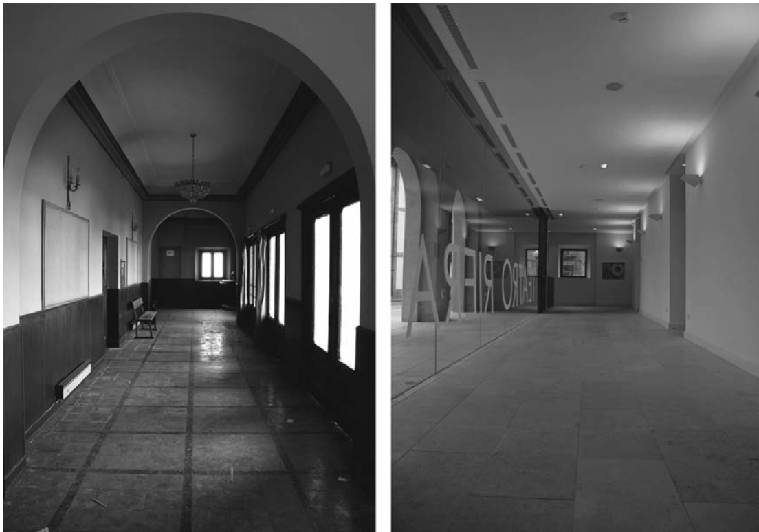
Fig. 2. Vestibulo interior de acceso, estado anterior y estado reformado.

se precisara una intervención que recuperara el edificio para disponer las dotaciones adecuadas para hacerlo funcional en la actualidad.