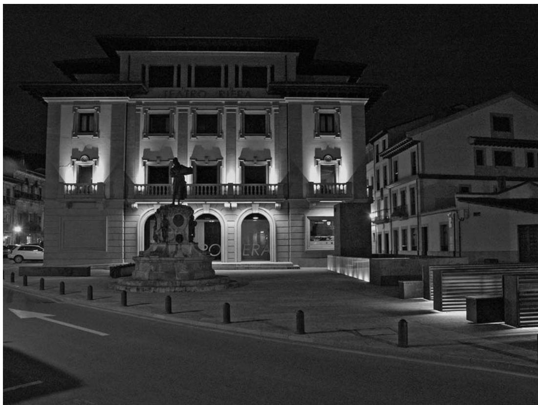
Fig. 1. Espacio urbano y fachada principal. Estado reformado.

El estado de abandono del inmueble y la falta de instalaciones actualizadas provocaron que