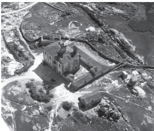
Fot. 1. Dehesa el Tráquilón, Cáceres (1956-57) (ANC1-564-N-2192)