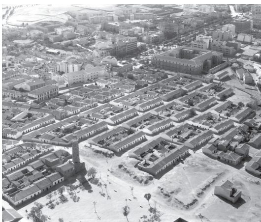
Fot. 5. Zona de Plaza de Italia y Avenida de España, Cáceres (1953-55) (ANC1-564-N-8789)

En la zona de Plaza de Italia y Avenida de España (fotografía nº 5) también se han experimentado grandes cambios que afectan al área fotografiada a mediados de los años cincuenta 22 . La mitad inferior de la fotografía está ocupada por las llamadas “Casas Baratas”, barriada de viviendas sociales unifamiliares cuya construcción fue promovida desde 1912 por la Asociación Cacerense de Socorros Mutuos empleando materiales económicos, con una sola planta y patio, dispuestas en un trazado urbano reticular bien ordenado. En el lado inferior derecho se aprecia el trazado de varias manzanas de solares aún no edificadas y que fueron ocupados desde finales de los años cincuenta con edificios de cuatro plantas. En el borde inferior izquierdo se muestra en la fotografía aérea el recuadro de la plaza Alcalde Antonio Canales, cuya construcción se había iniciado poco antes, y al lado se alza la llamada popularmente Torre de Italia, construcción de 1933 proyectada por el arquitecto municipal Ángel Pérez, denominada en realidad con el nombre de Torre Conmemorativa Monumento al Trabajo, todo ello en una zona muy próxima al centro urbano, pero por su emplazamiento accidentado no fue urbanizada hasta comienzos del siglo XX. Muchas de las sencillas viviendas bajas han sido remodeladas en los últimos años y mejoradas con modernas dotaciones convirtiendo la zona en un singular barrio residencial.