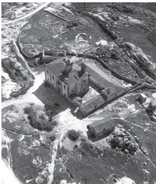
Fot. 4. Área meridional de la ciudad de Cáceres (1953-1955) (ANC1-564-N-8771)