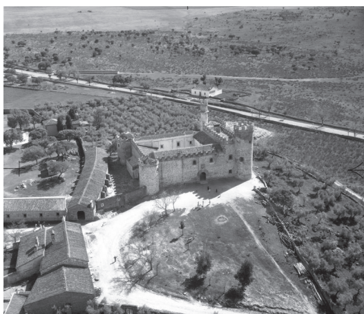
Fot. 3. Castillo de las Arguijuelas de Abajo, Cáceres (1956-57) (ANC1-564-N-2193)

El castillo está en uso activo hasta nuestros días, habiendo mantenido los dueños la dedicación originaria agrícola y residencial. En el Libro de Yervas de 1909 se califica la propiedad como dehesa de puro pasto y montanera, donde además de la casa palacio se relacionan diversidad de instalaciones y dependencias de uso agrícola y ganadero 14 . Recientemente se han añadido actividades de hostelería y celebración de eventos, para lo cual se ha habilitado en el exterior un espacio ajardinado y comedor al aire libre bien arbolado sin que se hayan añadido nuevas instalaciones. En las fotos aéreas de mediados del siglo XX se puede ver que la configuración del castillo no ha cambiado en nada hasta nuestros días, como las construcciones rústicas existentes, todo lo cual se mantiene actualmente, así como la ermita situada al lado, los cercados, arbolados y charcas que también aparecen en algunas fotografías de estos vuelos.