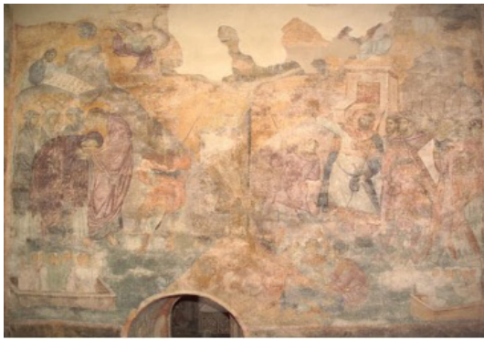
Fig.4. Crucifixión. Tercer cuarto del siglo XIII. Iglesia de la Santa Trinidad. Sopocani, Serbia. [Consultado: 12-03-2025].

se trasladó al propio Imperio bizantino 61 . Para justificar esta visión, el citado investigador se apoya en una serie de imágenes, tales como los frescos de Aquileia o el mosaico de Monreale (XII), en las que se manifiesta cómo María apoya sus manos en una de las Santas Mujeres. Sin embargo, en ninguna de estas composiciones se puede visualizar una representación del desmayo de la Virgen que no apareció en el arte italiano hasta el siglo XIII, mientras que en la imagen bizantina estuvo presente desde el XI. A ello se le suma que fueron maestros bizantinos quienes realizaron esta escena de Sopocani; un aspecto que se hace visible a la hora de presentar el desmayo, mucho más próximo a lo visto en el salterio londinense, ya que María se desploma hacia delante y es sustentada por el discípulo de una forma poco frecuente en el ámbito europeo en el siglo XIII, en donde se prefería a una Virgen completamente desvanecida en el suelo. Por lo tanto, podemos establecer que se trató de un tema propio de Oriente, que surgió en este lugar, y se trasladó, posteriormente, a Occidente.