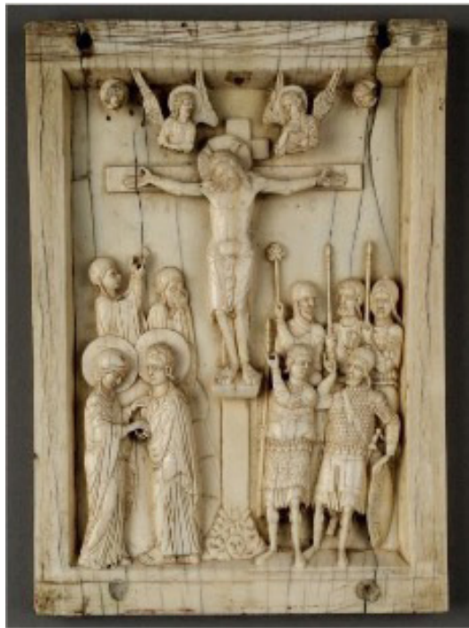
Fig. 1. Altar plegable sobre la Crucifixión de Cristo. Siglo X. Museo Bode, Berlín.