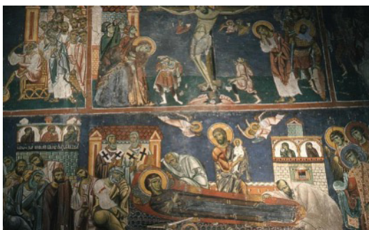
Fig. 3. Crucifixión y Koimesis. Siglo XII. Pared este de la nave del monasterio de Mavriotissa, Kastoria. [Consultado: 03-01-2025].