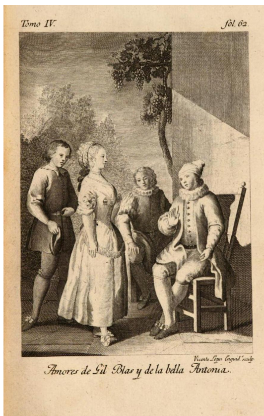
Fig. 2. Amores de Gil Blas y de la bella Antonia , Vicente López de Enguïdanos Perles. Le Sage: Aventuras de Gil Blas de Santillana , t. IV, fol. 62. Calcografía Nacional, Madrid. h.1797.

La exigua bibliografía referente al grabador valenciano Vicente López de Enguïdanos Perles se ha centrado decididamente en su producción artística, dejando a un lado su periplo vital. Del él únicamente se ha señalado su origen, su nacimiento en 1774, además de su ingreso en la Real Academia de San Fernando en Madrid en 1786 y su fallecimiento hacia 1800, ya que ninguna de sus obras está fechada con posterioridad a 1799. Y eso a pesar de haberse silenciado parte de su labor, pues su catálogo se ha configurado a través de su participación en la obra de Cavanilles, Icones et descriptiones plantarum , y Florae Peruviana, et chilensis Prodromus de Hipólito Ruiz y José Pavón, los cuatro libros de arquitectura de Palladio, la Uranografía de José Garriga y la obra de Le Sage, Aventuras de Gil Blas de Santillana , aparte de sus retratos de Quintiliano y de Rodrigo Díaz de Vivar, este último para la serie de los Españoles Ilustres 1 . En las líneas que siguen se dan a conocer más de cuarenta documentos inéditos con los que se ha podido ahondar en el conocimiento de su vida y su entorno familiar, permitiendo así vislumbrar su efímera aunque interesante semblanza.