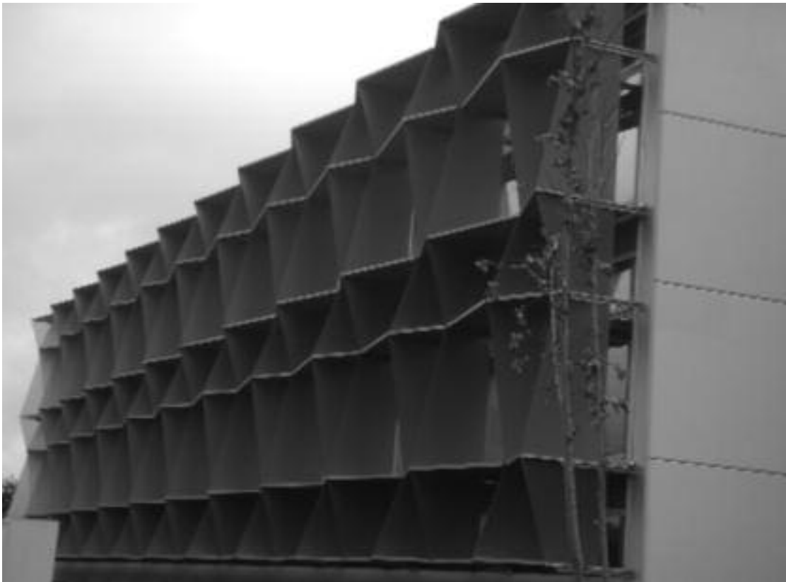
2. Edificio en el parque tecnológico.

barrios, destacan el del Puerto Deportivo (Menendez Moriyón, Nanclares y Ruiz), el PERI del muelle y el PERI de las estaciones.