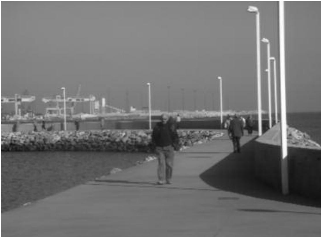
5. Recuperación del litoral en El Arbeyal.

La imagen de la ciudad es más que la cosmética urbana, pero la incluye; En el renovado de cara están las campañas de arreglo de fachadas, la serie de rehabilitaciones o fachadas de nueva construcción del premio Plomada de plata concedido por la asociación de Promotores ASPROCON desde comienzos de los 90. En la actualidad se perfilan El Plan Especial para la reforma de la fachada del Muro de San Lorenzo y Paseo del Muro , y la propuesta de envolver el estadio del Molinón por parte del artista Joaquín Vaquero Turcios, que son intervenciones artísticas basadas en los efectos visuales de superficies.