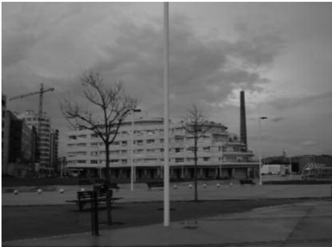
1. Gijón. Nuevas arquitecturas y recuperación de la zona de Poniente.

peraciones de los barrios industriales en los márgenes de la ría del Nervión y un progresivo desarrollo turístico que la fama mundial del arquitecto Ghery y el número de visitantes proporcionaba.