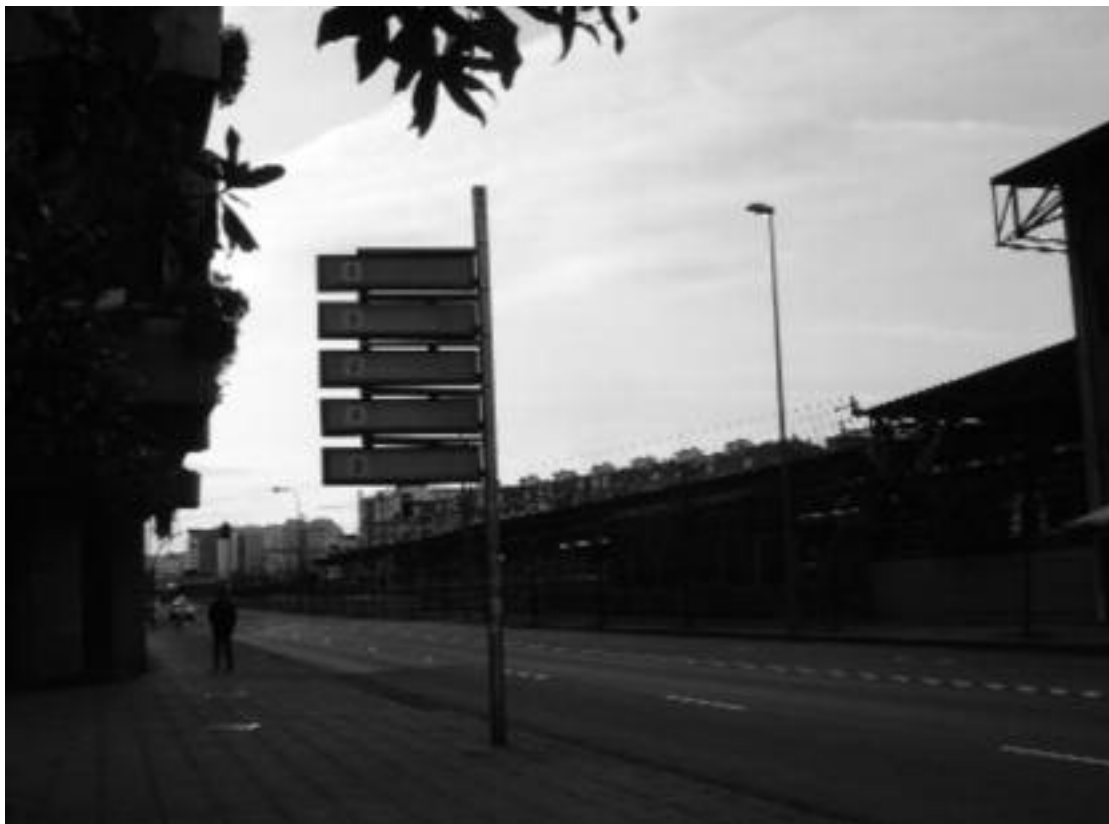
3. Actual situación y división de los barrios occidentales de la ciudad, con la entrada de la autovía Y y el ferrocarril.