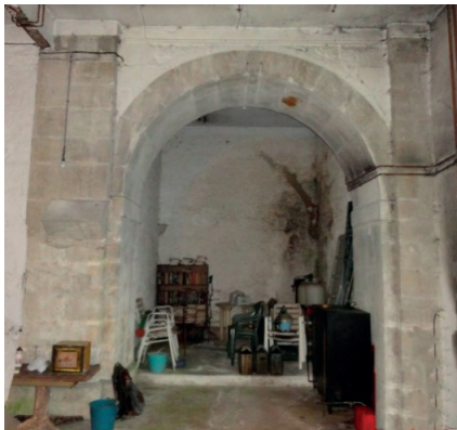
Fig. 5. Interior de la iglesia. Capilla lateral norte. Actualmente está cubierta.