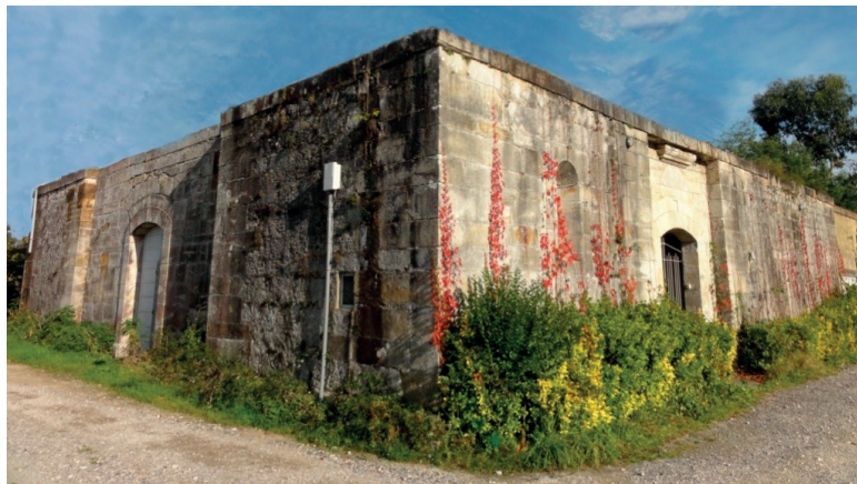
Fig. 6. Restos que se conservan de la iglesia desde el exterior, ángulo SW. Se trata de una recreación digital, pues en la actualidad sobre esta estructura se ha construido una casa, que se ha hecho desaparecer digitalmente para no distraer la atención de lo original del S. XIX.