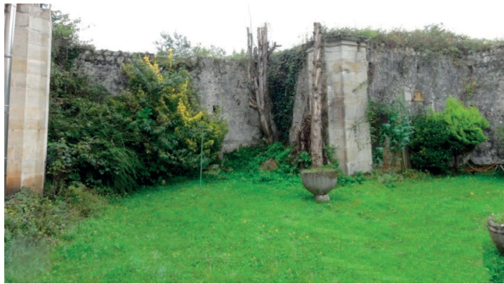
Fig. 4. Restos del interior de lo que iba a ser la iglesia de San Roque del Acebal. Los grandes pilares achaflanados recibirían la cúpula.