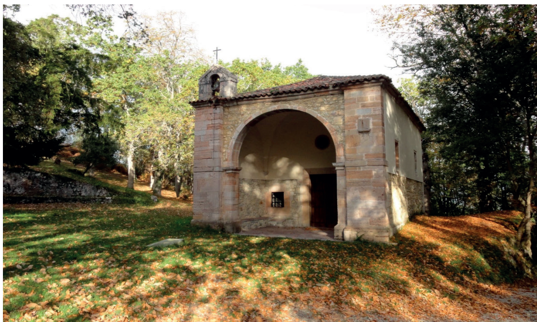
Fig. 1. Capilla del Cristo del Camino, Llanes. Fundada en 1559 y ampliada en 1818 gracias a la aportación económica del deán Díaz Escandón.

pendencia parroquial, lo que justificaría la construcción de un nuevo templo. Algo similar había ocurrido con la parroquia de Barro, desmembrada del convento de San Salvador de Celorio en 1788, dando lugar a la construcción de la nueva iglesia de Nuestra Señora de los Dolores, proyectada por el arquitecto de la Academia Silvestre Pérez 24 . Es interesante señalar como en estos años de la Ilustración, las últimas tendencias arquitectónicas, se introducen en esta zona del oriente asturiano gracias a la promoción privada cuyo capital proviene de América.