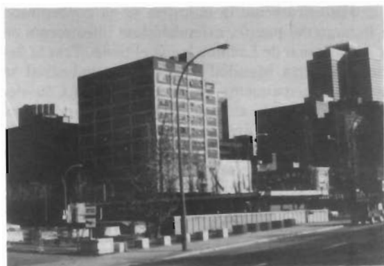
Fig. 3. Industrias textiles en el centro urbano.