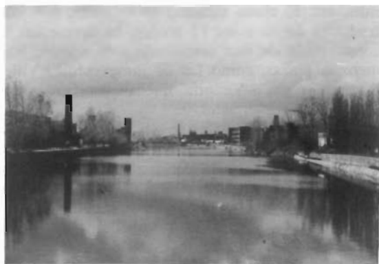
Fig. 4. Industrias en los márgenes del canal de Lachine.

La disminución tanto de empresas como de empleos industriales (no así de la productividad) ha propiciado el nacimiento de diversas políticas en el seno de organismos públicos, orientadas al mantenimiento de los espacios industriales. En este senti-