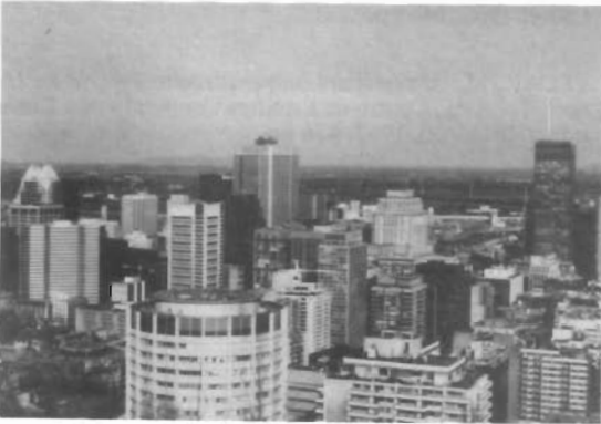
Fig. 2. Montreal desde Mont Royal.

En todo caso, Mont Royal constituye un elemento más del paisaje urbano, soportando un uso esencialmente recreativo. Su proximidad al centro le confiere, además, un mayor atractivo al permitir observar todo el espacio central de la ciudad.