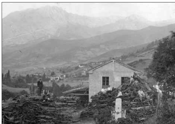
FIG. 3. Instalaciones de La Bienganada, a finales de la década de 1920.

Los distintos géneros corcheros que elaboran los talleres lebaniegos tienen un destino preferente: el norte de España. La producción de tapones, que en 1913 se cifra en 120.000 unidades, va destinada a abastecer las fábricas de cerveza de Santander y al embotellado de sidra y de frascos farmacéuticos, como reza la presentación de La Bienganada ( Memoria , 1905, y ADGB, 1935a) (Fig. 3) 9 . Junto a los tapones, se fabrican también algunos géneros menores. Es el caso de flotadores para pesca, principalmente de red, que se venden en los puertos cercanos.