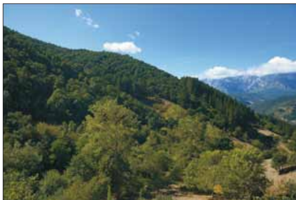
FIG. 2. Alcornocal de Tolibes, en el municipio de Potes, con algunas repoblaciones de pino de Monterrey.

espontáneamente un comercial santanderino (SEAPL, 1841, pp. 11-12). La información sirve para que La Económica haga propuestas en los campos de la silvicultura y la industria.