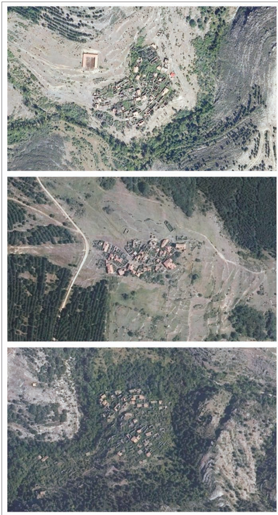
FIG. 12. A la izquierda, imagen aérea (Iberpix 2) de tres pueblos en ruinas de la Tierra de San Pedro: de arriba abajo, Acrijos, Buimanco y Vea (cero habitantes, todos). A la derecha, imagen aérea (Iberpix 2) de tres pueblos en ruinas de la Tierra de Yanguas: de arriba abajo, Aldealcardo, Leria y Vellosillo (cero habitantes, todos).