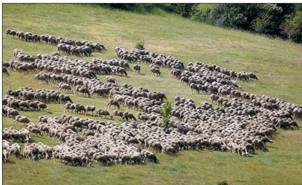
FIG. 7. Pastizales de verano en la Tierra de Yanguas, aún aprovechados por algunos rebaños de ganado lanar.

gistrada su residencia alrededor de 8.124 personas (16,9 habs./km 2 ) distribuidas en las cincuenta poblaciones antes enumeradas (dos villas y 48 aldeas), el 65 % de las cuales contaban con más de cien habitantes. Las villas cabecera de las dos comunidades, Yanguas y San Pedro Manrique, contaban entonces con 566 y 1.107 habitantes, respectivamente. Sin embargo, una parte mayoritaria de la población masculina tenía como ocupación el pastoreo en sus diferentes niveles (mayoral, rabadán, ayudador, sobrado, zagal) y, como se ha dicho, permanecía gran parte del año fuera de la Sierra cuidando los rebaños de ovejas en las dehesas de Andalucía o Extremadura; también un número significativo de varones (conocidos como «cagarraches») se desplazaba en el invierno para trabajar en los molinos de aceite de estas regiones del sur. Y dentro de la población que permanecía en la zona todo el año se encontraban también muchas personas dedicadas a labores relacionadas con la producción de lana fina: esquiladores, empleados de lavaderos de lana y, sobre todo, cardadores («pelaires»). En comparación con esta actividad ganadera, muy bien organizada y de alta rentabilidad, basada en el aprovechamiento de unos pastos de buena calidad disponibles en los meses del verano, cuando escaseaban en otros lugares, la agricultura se limitaba a la producción de lo necesario para un abastecimiento básico de cereales y verduras y la explotación