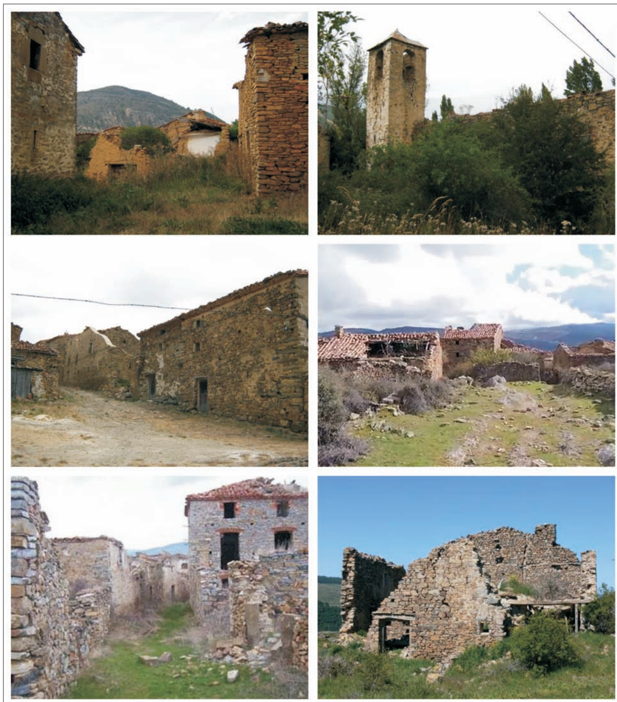
FIG. 13. De izquierda a derecha, y de arriba abajo, vista interior de seis pueblos en ruinas vacíos de las Tierras Altas de Yaguas y de San Pedro Manrique: Vellosillo, Camporredondo, Sarnago, Buimanco, Aldealcardo y Villaseca Bajera.