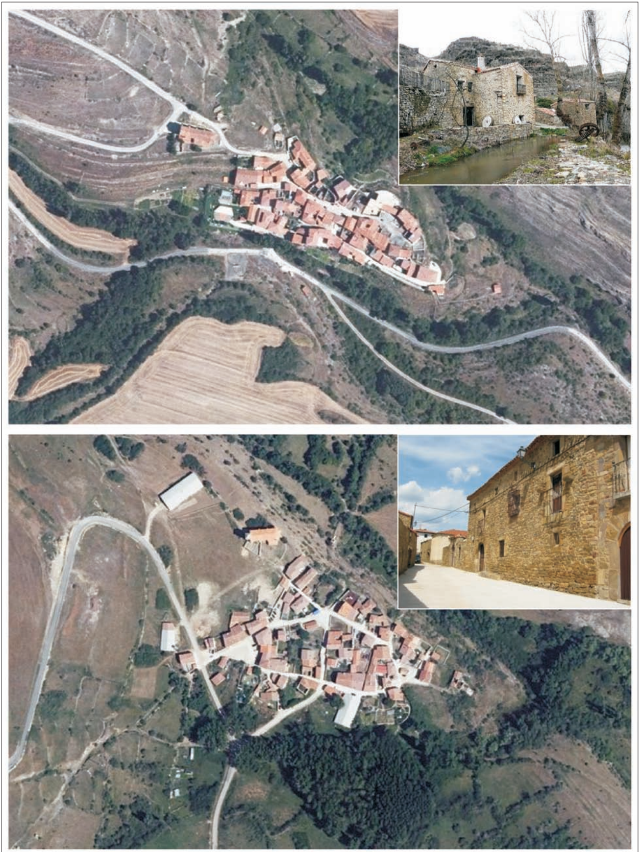
FIG. 10. A la izquierda, imagen aérea (Iberpix 2) y vista interior de dos pueblos desocupados de la Tierra de Yanguas: arriba, Bretún (16 habitantes); abajo, Vizmanos (25 habitantes). A la derecha, imagen aérea (Iberpix 2) y vista interior de dos pueblos desocupados de la Tierra de San Pedro: arriba, Matasejún (14 habitantes); abajo, San Andrés de San Pedro (19 habitantes).