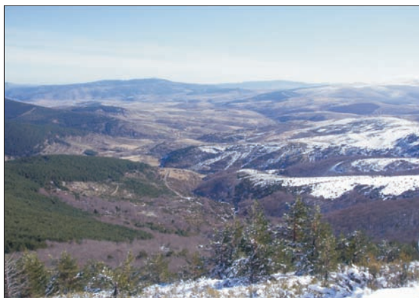
FIG. 1. Panorama de las Tierras Altas de Yanguas y de San Pedro Manrique desde la cumbre de la Avellanosa (1.758 m) en la sierra de Montes Claros. Al fondo, la sierra de La Alcarama (1.719 m).