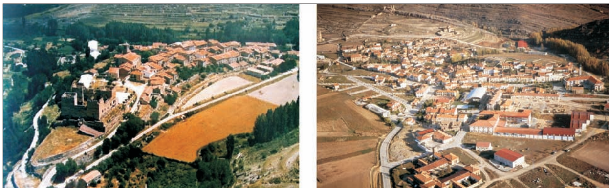
FIG. 6. Vista actual de las antiguas villas de Yanguas (izquierda) y San Pedro Manrique (derecha), cabeceras de las comunidades de villa y tierra históricas del mismo nombre.

En el último tercio del siglo xv, coincidiendo con los reinados de Enrique IV y de los Reyes Católicos, se producen unos cambios fundamentales que afectan decisivamente al gobierno y al funcionamiento socioeconómico de las Tierras Altas. El primero de ellos es la supresión en la práctica de las comunidades de villa y tierra y su entrega a la nobleza como «tierras de señorío», de la que sólo se libra plenamente la muy poderosa comunidad de Soria. El segundo, derivado en gran parte del anterior, es el paso a actividad principal de la ganadería lanar (que se hace trashumante y se integra en un sistema económico de escala nacional e incluso europea) y la incorporación plena de los nuevos señores a la Real Cabaña de la Mesta para aprovechar el privilegio de 1489 por el que la Corona concede a los ganados trashumantes el derecho a «transitar, pacer y beber en todas las tierras, salvo la de labor, viña, huerta, prado de siega y dehesa boyal» (Klein, 1994).