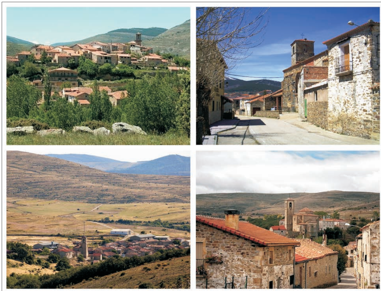
FIG. 9. Dos pueblos habitados: arriba, Santa Cruz de Yaguas (49 habitantes), en la Tierra de Yaguas; abajo, Oncala (51 habitantes), en la Tierra de San Pedro Manrique.

ble, los han conservado en condiciones de habitabilidad o incluso los han reformado y mejorado, al tiempo que la administración provincial los ha asegurado el acceso por carretera y los ayuntamientos a los que pertenecen han dedicado y dedican algunos recursos al cuidado de las calles, al abastecimiento de agua y a otros servicios básicos. Se trata, pues, de entidades despobladas pero no abandonadas, en las que el edificio más importante (la iglesia) permanece casi siempre en pie, conserva su cubierta y su mobiliario y algunos días del año acoge ceremonias religiosas.