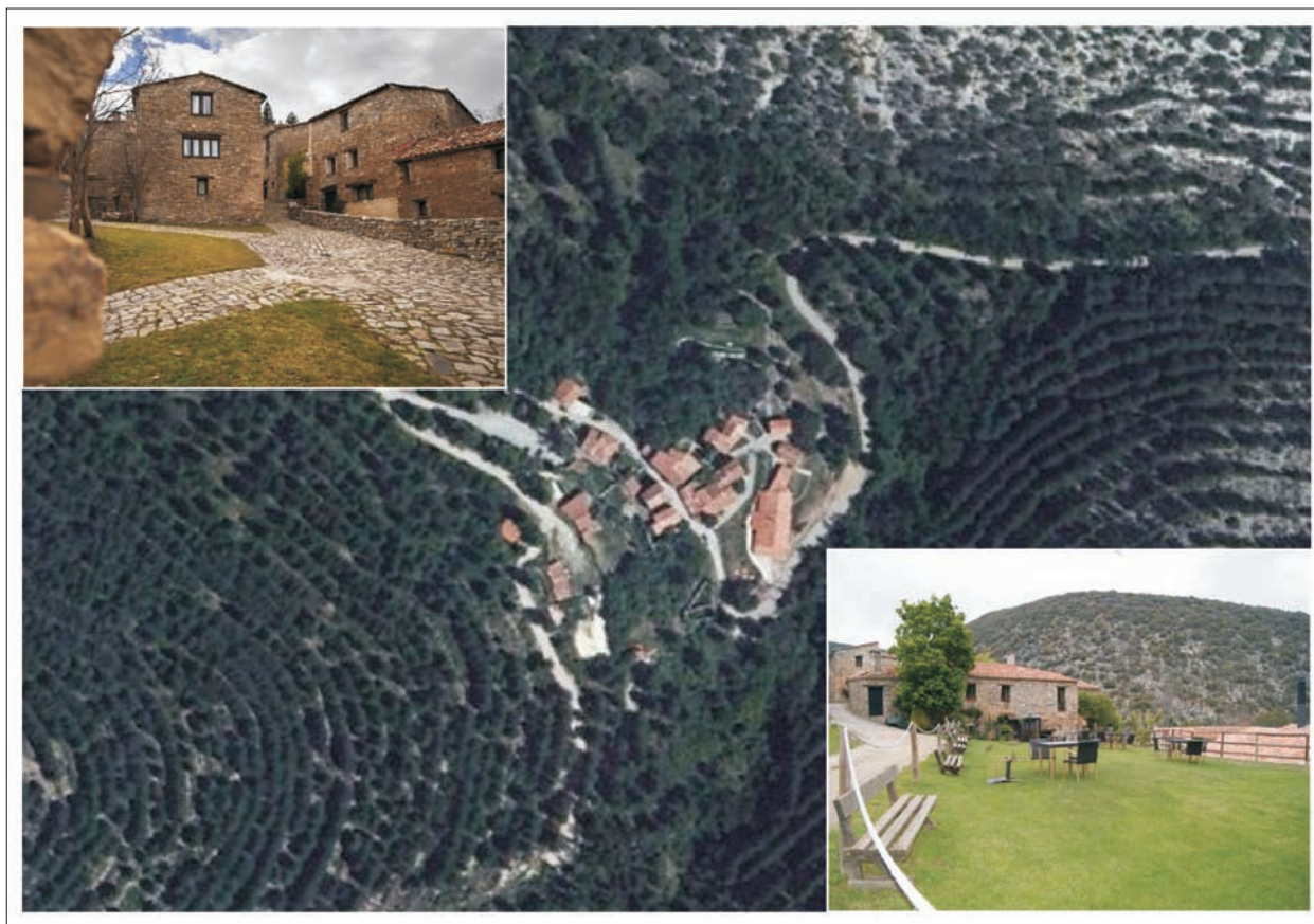
FIG. 14. Imagen aérea (Iberpix 2) y vistas interiores del único pueblo recuperado de las Tierras Altas de Yanguas y de San Pedro Manrique: Valdellavilla (cero habitantes empadronados).

hundimiento de la práctica totalidad de ellos, incluida la iglesia) y permitió que la vegetación invadiese (hasta cegarlas en muchos casos) las antiguas calles y sendas.