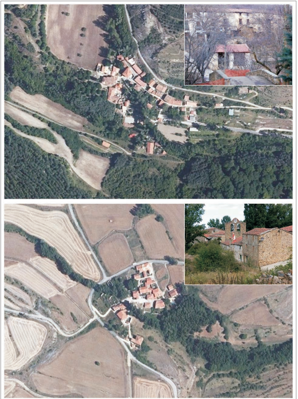
FIG. 11. A la izquierda, imagen aérea (Iberpix 2) y vista interior de dos pueblos abandonados de la Tierra de Yanguas: arriba, Diustes (cinco habitantes); abajo, Santa Cecilia (tres habitantes). A la derecha, imagen aérea (Iberpix 2) y vista interior de dos pueblos abandonados de la Tierra de San Pedro: arriba, Navabellida (cuatro habitantes); abajo, Taniñe (dos habitantes).