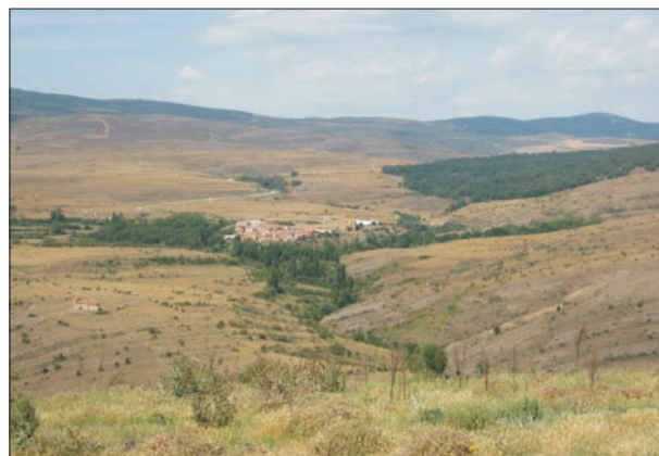
FIG. 2. Cabecera del valle del río Cidacos desde la sierra de Alba (1.560 m).

Encuadrado en la rama septentrional de la cordillera ibérica, entre los elevados macizos del Urbión-Cebollera, al noroeste, y del Moncayo, al sureste, y repartido entre las cuencas hidrográficas del Duero y el Ebro, este ámbito en su conjunto fue conocido tradicionalmente como «la Sierra» y, según sus sectores, como «la sierra de Alba», «la sierra de Montesclaros», «la sierra de Cameros Viejo» o «la sierra de La Alcarama». Más recientemente (por su evidente altitud y su básica correspondencia con el área histórica de las tierras vinculadas durante el Antiguo Régimen a varias villas —San Pedro Manrique, Yanguas, Magaña y Ágreda— y a varios sexmos de la jurisdicción de la propia ciudad de Soria) ha sido denominado «Tierras Altas» (Muñoz Jiménez, 2008).