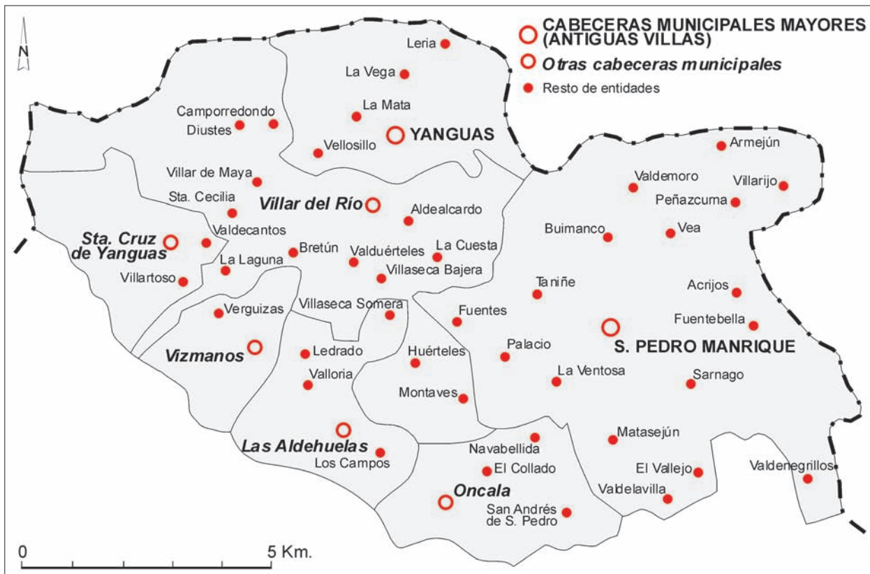
Fig. 4. Organización municipal y localización de los asentamientos en las Tierras Altas de Yaguas y de San Pedro Manrique.

ces la disminución de ésta ha tenido un ritmo mucho más acusado que el registrado en el resto de Soria, de modo que desde el año 2000 no llega a 3 hab./km 2 (la tercera parte de la ya exigua media provincial).