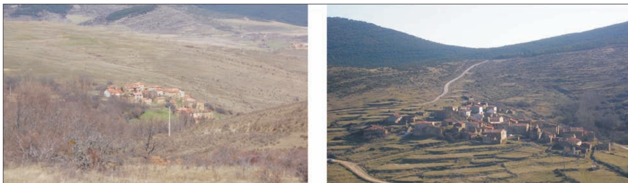
FIG. 5. Asentamientos deshabitados: a la izquierda, Verguizas (dos habitantes), en la Tierra de Yanguas; a la derecha, Sarnago (un habitante), en la Tierra de San Pedro.

según la fecha de la emigración de sus vecinos y de su grado de abandono por parte de éstos y de sus descendientes, son numerosos y constituyen un elemento básico de su paisaje (Córdoba Largo, 1983; Sanz Sánchez, 2001; Goig Soler, 2002).