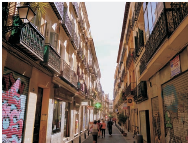
FIG. 5. La rehabilitación convierte el área deteriorada en beau quartier .

Recuperar esos espacios es un objetivo reiterado en todas las escalas de ordenación y proyectos concretos, desde el Plan de Calidad del Paisaje, donde se priorizaba su uso público (2009c, p. 13) hasta el Diagnóstico del Plan