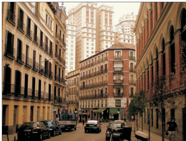
FIG. 3. Traseras del Edificio España, en el barrio de Amapiel (2012).

de Montera (Aduana, Jardines, Caballero de Gracia), que en parte formaban un enclave incongruente con su medio, como la Costanilla de los Ángeles o Caños del Peral cerca del Teatro Real.