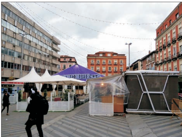
FIG. 6. Plaza Luna, la sobreexplotación del espacio público.

27). En el caso de Gran Vía la idea de la simplificación, utilizada por Fernández, Ramírez y Morán (2010, p. 40), es cierta, pero el dispositivo comercial tampoco carece de variedad. Los negocios de corte clásico regentados por asiáticos forman grupo aparte, están muy repartidos en forma aleatoria y tienden a la diversificación, desde los mayoristas a las peluquerías y alimentación (carnicería, frutería, pescadería por separado), reutilizando a menudo locales antiguos, incluso de las mismas tiendas de ultramarinos. Es un ejemplo característico de sucesión empresarial, que coloca a esa comunidad en cabeza de la pequeña distribución alimentaria, frente a los no muy numerosos supermercados de las cadenas Día y más recientemente Carrefour Express.