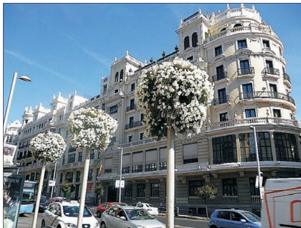
FIG. 4. Los nuevos usos m s cualificados tienden a colonizar el primer tramo de la Gran V a, no sin cierta dificultad de salida, hasta el momento, en el caso de las oficinas.

resultado de la  ltima inspecci n visual sobre el terreno a comienzos de 2015 cifran en algo m s de una veintena las intervenciones de mayor entidad que, sumadas al simple tratamiento de fachadas, s lo permiten hablar de un moderado deterioro exterior en algunas edificaciones del tramo final. Ahora bien, el proceso de reocupaci n de la avenida parece un tanto ralentizado por la crisis, los precios disuasorios u otros factores, de manera que se ofrecen m s de veinte bajos y locales en planta, y est n disponibles para el alquiler, a la fecha de redactar este texto, dos edificios casi completos transformados hace relativamente poco tiempo (n meros 1, Grassy, y 4, antiguo Banco Urquijo).