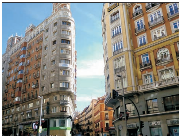
FIG. 2. Salto de escala entre el edificio Los Sótanos (1949) y el tejido histórico de la calle Isabel la Católica.

La diferencia de altura respecto al caserío contiguo tampoco significa que la Gran Vía sea propiamente una lámina, pues en sus orillas hay un salpicado de elementos coetáneos, particularmente de la posguerra, debidos en ocasiones a los bombardeos. Su línea quebrada en tres secciones, separadas por los anclajes de Red de San Luis y Callao, condicionó y no poco la relación espacial con el estrato urbano más antiguo. La distribución previa de contenidos favoreció el engarce físico y funcional con el centro tradicional (los radios de la Puerta del Sol) y las vías prestigiosas o más activas (San Bernardo, entorno de Barquillo, horquilla Fuencarral-Hortaleza), en las direcciones donde no hay una discontinuidad topográfica marcada. Al revés, las partes impermeables, menos mejoradas por la reforma liberal, con mayor pendiente o deprimidas, no permitieron resolver tan satisfactoriamente la soldadura, quedando relegadas a una condición de asentamientos populares, o traseras cuando contenían usos de rechazo, sobremanera por detrás del Madrid-París. La heterogeneidad se acentuó al avanzar la centuria