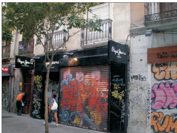
FIG. 7. Resistencias del barrio bohemio al gran capital.

tilo, arte o diseño. Eso ocurre en las calles del Triángulo Ballesta, que suman una cuarentena de locales nuevos, particularmente Corredera Baja de San Pablo y Barco. Al este de Hortaleza, el umbral de Chueca (San Marcos, Libertad, Barbieri) está singularizado por la gastronomía étnica selecta, restauración especializada, bistrós, cafés de tipo antiguo y locales de diseño. Al contacto con la Gran Vía (Infantas y sobre todo Reina) la dotación es más exclusiva (coctelerías, creperías, pintxos vascos), invadiendo el primer tramo del eje principal. En áreas menos caras (barrios de Amaniel, Las Cortes o Santo Domingo) la tematización está presidida por el sector de la restauración étnica popular, e intercalaciones recientes de negocios mejores. Teóricamente los perfiles singularizados denotan mayor madurez que las composiciones mixtas, pero a este respecto estamos ante un espacio de fuertes contrastes y gran diversidad a pequeña escala, como denota el carácter absolutamente heterogéneo de algunas bocacalles al eje mayor (Silva, Jacometrezo, Flor Baja).