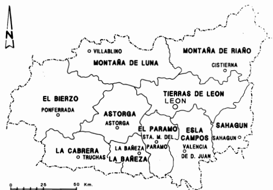
Fig. 3. Comarcas agrarias.

Durante las tres últimas décadas el número de parcelas de la provincia de León ha experimentado una continuo descenso a la luz de los datos del Censo Agrario de 1989, en el cual hay un 67% menos que en año 1962; dicha reducción equivale al 23% de los fundos, si el año de comparación es 1982. Una prueba de ello es que la superficie media por parcela ha pasado de tener 0,48 Ha, según el Censo de 1962, a 1,38 Ha., según el de 1989 (la media de Castilla y León es de 2,02 Ha.). No obstante, se tra-