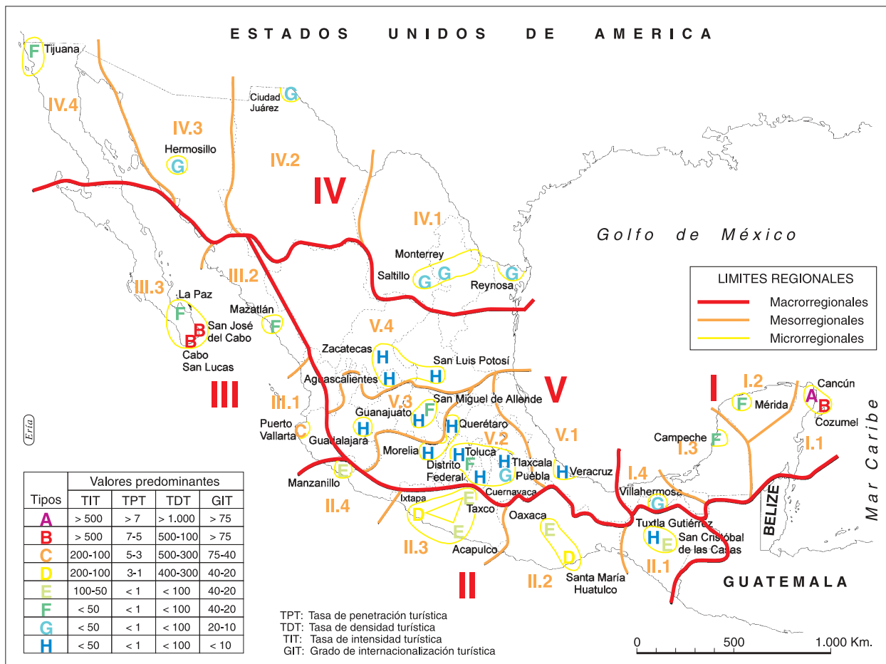
FIG. 2. Tipología de los principales lugares turísticos y regionalización turística de México.

tipos» del país, se clasificaron a través de cuatro indicadores que miden el impacto del turismo en un territorio específico, como se presenta a continuación (SEZER y HARRISON, 1998):