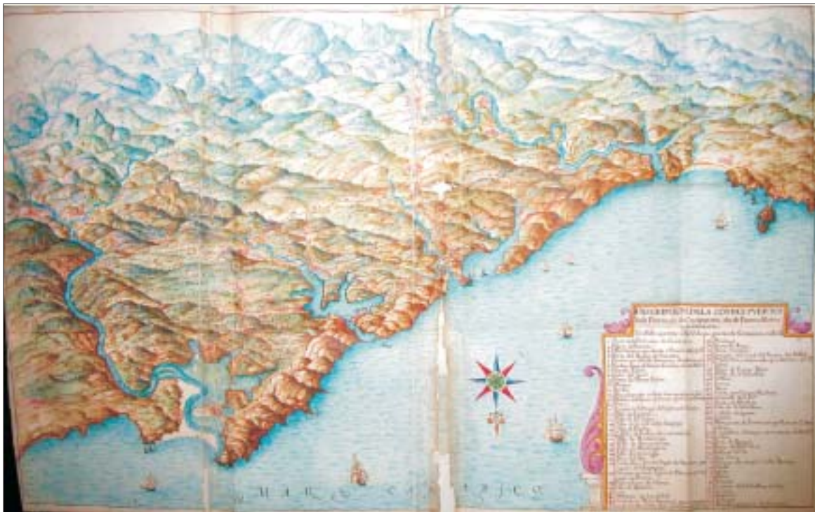
FIG. 2. «Descripción de la costa y puertos de la provincia de Guipúzcoa desde Fuenterabia asta Guetaria», Biblioteca de la Diputación Foral de Vizcaya (Reserva Bascongada VMSS-249).