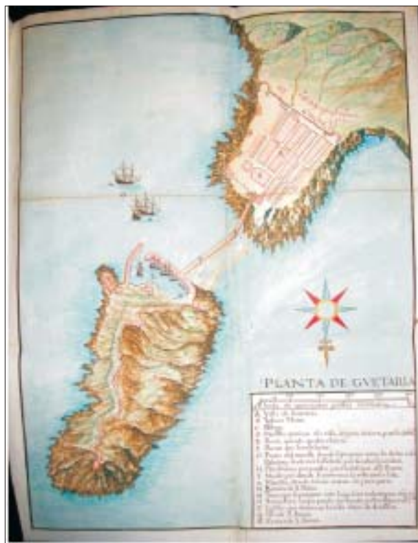
FIG. 7. «Guetaria», en Descripción de España... , Hofbibliothek, Viena.