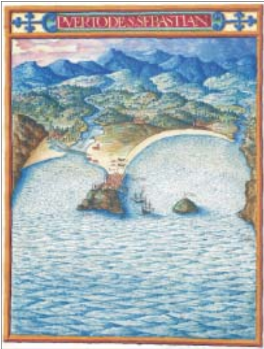
FIG. 5. «Puerto de S. Sebastián», en Descripción de España... , Hofbibliothek, Viena.