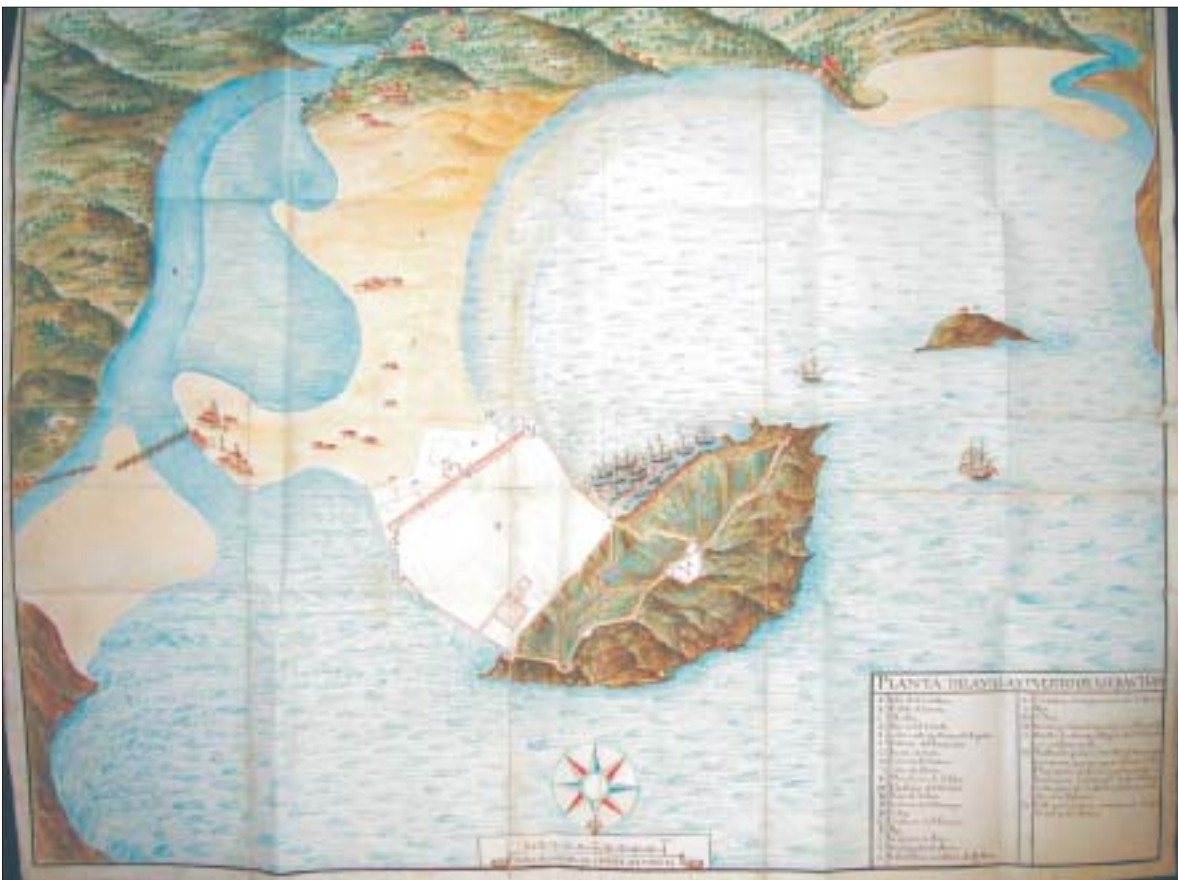
FIG. 6. «Planta de la villa y puerto de S. Sebastián», Biblioteca de la Diputación Foral de Vizcaya...