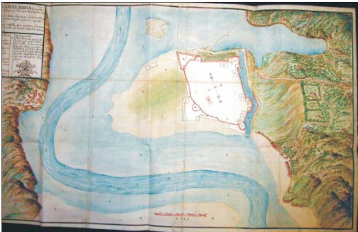
FIG. 4. «Planta de la Plaza de Fuenterrabia», Biblioteca de la Diputación Foral de Vizcaya...