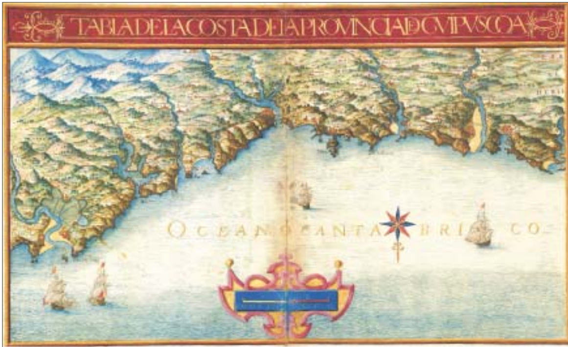
FIG. 1. «Tabla de la costa de la provincia de Guipúzcoa», en Descripción de España y de las costas y puertos de sus reynos , Hofbibliothek, Viena.