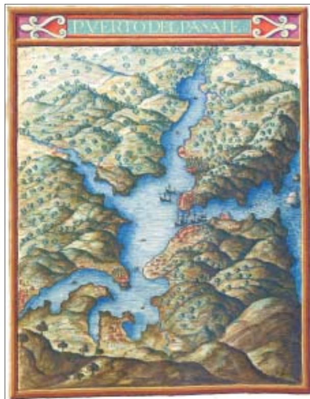
FIG. 9. «Puerto del Pasaje», en Descripción de España... , Hofbibliothek, Viena.