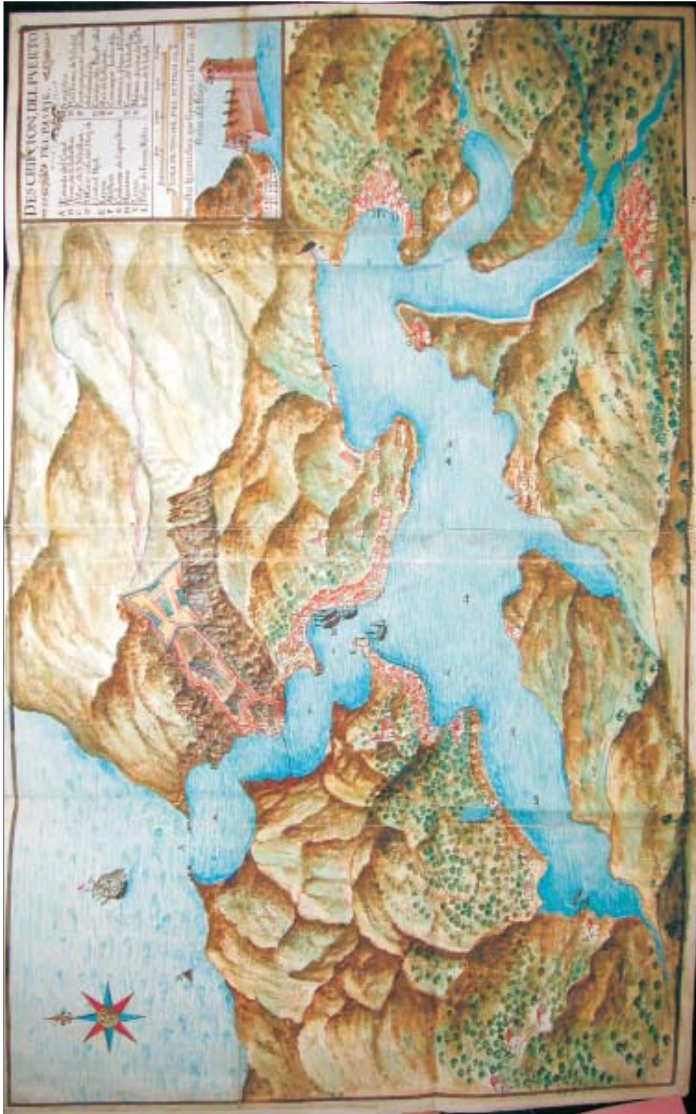
FIG. 10. «Descripción del Puerto del Pasaje», Biblioteca de la Diputación Foral de Vizcaya...