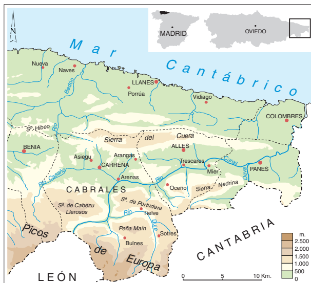
FIG. 1. Mapa de localización del concejo de Cabrales.

Cordillera Cantábrica. Otras cimas significativas son el Pico Urriellu, más conocido por los montañeros como el Naranjo de Bulnes (2.519 m), el Neverón de Urriellu (2.559 m), el Albo (2.436 m), Horcados Rojos (2.562 m), o el Tesorero (2.570 m), que hace de límite entre Asturias, Cantabria y León (Fig. 1).