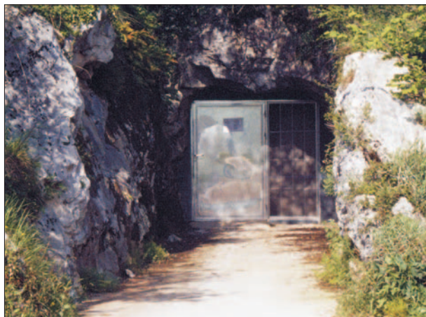
FIG. 2. Entrada de la antigua mina de La Boriza (Poo) utilizada hoy para la maduración del Cabrales. Actualmente permanecen en activo para esta finalidad catorce cuevas, tres antiguas minas, tres bodegas y dos cámaras artificiales. Destacan la ya citada mina de la Boriza y las cuevas de La Vieya, El Molín y El Cares. La primera de ellas es utilizada por ocho elaboradores; el Molín y La Vieya son usadas respectivamente por uno y seis queseros; y la cueva El Cares, que sin duda es la mayor y mejor dotada de las cuevas de maduración, es empleada por un número variable de productores.

pero, como ha quedado patente, también destacan las cavidades endokársticas, algunas de las cuales han sido utilizadas para la fermentación de uno de los quesos azules más conocidos: el queso de Cabrales. Estas cuevas naturales se caracterizan por mantener una temperatura constante a lo largo del año (12 °C aproximadamente), una humedad muy alta (90-95%) y una serie de conductos naturales que permiten la circulación del aire. Pues bien, estas características existentes en las cuevas cabraliegas (similares a las que se dan en las grutas de la montaña de Combalou, en Roquefort-sur-Soulzon, cuna del queso homónimo) las convierten en lugares idóneos para la fermentación del Cabrales. Esto es así porque, por un lado, las condiciones ambientales favorecen la proliferación de hongos del género Penicillium , que es el encargado de llevar a cabo el proceso de maduración del queso; y por otro, los conductos de ventilación, denominados «soplaos» en Cabrales y fleurines en Francia, cumplen una función de suma importancia, ya que las corrientes de aire que en ellos se generan dispersan las esporas del Penicillium por toda la cueva, introduciéndolas en el interior de los quesos 1 .