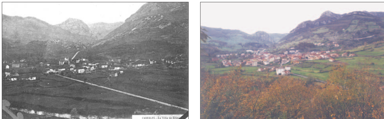
FIG. 7. Fotografías oblicuas de Arenas de Cabrales tomadas desde la pradería de Pandu hacia 1925 (izquierda) y en 2003 (derecha). Dado su favorable emplazamiento en una amplia vega formada por varios niveles de terrazas fluviales, claramente visibles en la figura, y su privilegiada situación de puerta de entrada a los Picos de Europa, esta villa constituye el principal núcleo de población del Concejo a pesar de que no ostenta la capitalidad. Tal y como se puede apreciar, durante el siglo pasado dicha localidad experimentó un gran crecimiento espacial y una importante densificación del caserío; esta evolución positiva se debe a que en Arenas se han ido concentrando la mayor parte de las actividades comerciales y de servicios vinculados al turismo, mientras que Carreña, la capital, ha quedado relegada a la función administrativa. Asimismo cabe mencionar la importancia que ha tenido también la segunda residencia en el crecimiento de Arenas, especialmente en la última década. Esta expansión se ha llevado a cabo en torno a tres ejes viarios que confluyen en la villa cabraliega: la carretera Arenas-Niserias (AS-345), la que parte hacia Poncebos (AS-264) y la que une Cangas de Onís y Panes (AS-114), visible en la figura.

nadería que, hasta mediados de la última década del siglo pasado, fue la ocupación principal (Cuadro III). Los factores que explican este importante retroceso del primario son múltiples: la mecanización de las explotaciones agrícolas, así como la reducción en número de las mismas, el éxodo rural y, sobre todo, el abandono de esta actividad debido a la jubilación de los titulares de la explotación (téngase en cuenta que el grado de envejecimiento de la población de Cabrales es elevado, situándose el índice de vejez en el año 2002 en 2,38). Pero el impacto que ha tenido esa nueva vocación turística sobre la economía cabraliega no se ha limitado a los servicios, sino que también afectó de manera muy notable al sector de la construcción (que en el cuadro anterior incluimos dentro del secundario) debido, tanto a la edificación de alojamientos turísticos, como a la construcción de viviendas de segunda residencia. Así, pese a la merma demográfica sufrida por Cabrales a lo largo del siglo XX, el parque inmobiliario del Concejo no ha dejado de aumentar, sobre todo en las últimas décadas, como consecuencia del retorno estacional de los muchos cabraliegos que tienen fijada su residencia en el centro de Asturias 13 (Fig. 7).