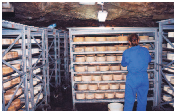
FIG. 3. Interior de las instalaciones de la cueva El Cares (Arenas). En la fotografía se observa cómo se organiza internamente la principal cavidad de maduración del Cabrales: estanterías metálicas móviles que son alquiladas a los productores. Se puede apreciar también la distinta tonalidad del queso en función de su grado de maduración.

Las cuevas utilizadas para la fermentación del queso de Cabrales son de dimensiones variables, aunque en todos los casos resultan modestas en comparación con las existentes en el país gallo, aprovechándose desde pequeños abrigos rocosos de apenas unos metros a cavidades hectométricas de una sola planta, salvo en el caso de la cueva El Cares, que está distribuida en dos niveles. Antaño las cavidades eran utilizadas de forma individual, mientras que hoy en día la maduración del queso de Cabrales tiende a concentrarse en grandes cuevas comunitarias acondicionadas (luz, agua corriente y buenos accesos) y que reúnen las debidas condiciones higiénico-sanitarias (Figs. 2 y 3).