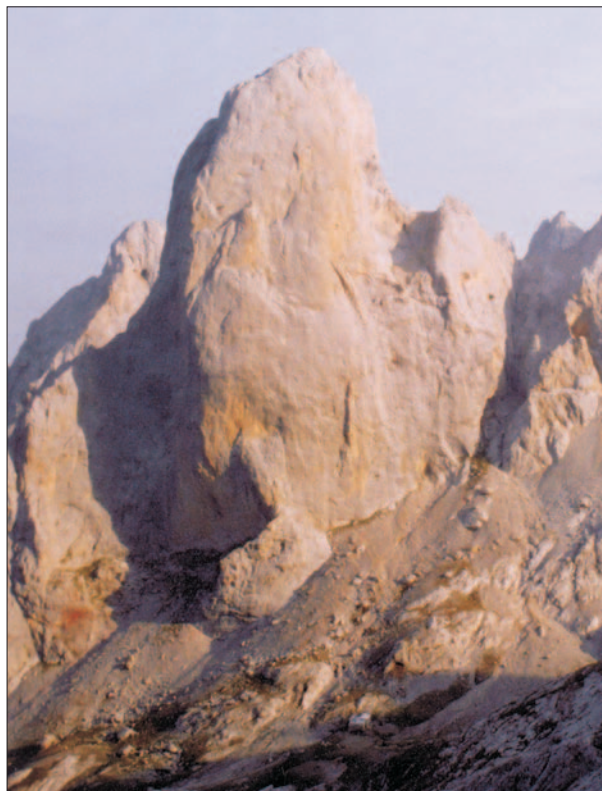
FIG. 6. Mítica cara Oeste del Picu Urriellu, cima que se ha convertido en el icono más destacado de los Picos de Europa. A sus pies se halla el refugio Julián Delgado Úbeda, construido en 1954 y posteriormente ampliado y acondicionado en varias ocasiones.

1904 Pedro Pidal y Gregorio Pérez Demaría, «el Cainejo», escalaron el Urriellu con la única ayuda de una tosca cuerda, hazaña que sería ampliamente difundida por Pidal a través de los medios de comunicación, que siempre dieron amplia difusión a su azarosa vida. Esta subida y la que poco después protagonizó el geólogo alemán Gustav Schulze, en la que utilizó clavijas por primera vez en España (BARDÓN; 2004, pág. 47), señalan el principio de una larga historia de ascensiones y apertura de nuevas vías en el Picu, pero que, sin embargo, van perdiendo interés mediático progresivamente hasta la década de los sesenta. En 1962 Alberto Rabadá y Ernesto Navarro coronan la cima por la cara más vertical de la montaña, la Oeste, centrando en el Naranjo el interés general y convirtiéndolo, definitivamente, en uno de los iconos más reconocidos del alpinismo español.