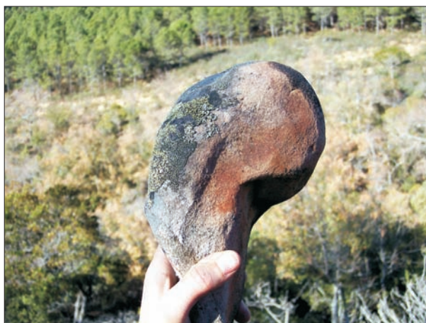
FIG. 14. Clasto de pedriza con una gran redondez. Sierra de Navalmanzano.