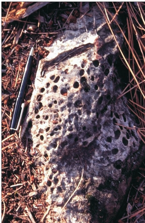
FIG. 12. «Nidos de abeja» en un bloque suelto de ladera en la Umbría de Dormideros.

dad o es muy reciente, pues en caso contrario estos arenales habrían desaparecido. Además en su ámbito son muchos los cantos o bloques que se desagregan al tacto y las superficies rocosas (dorsos de estratos generalmente) donde se observan finas películas de arena o granos de arena sueltos procedente de las propias rocas.