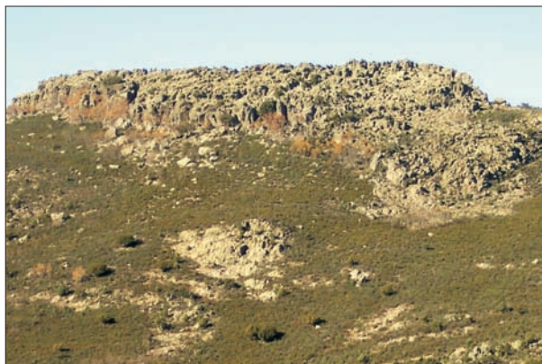
FIG. 2. Mesa-Cuesta culminante en la solana de la Sierra de Dormideros, densamente «rasgada» por los procesos erosivos.

precipitaciones son irregulares en el tiempo y variables en el espacio y se ven muy influidas por la localización concreta y el relieve, de manera que dentro del área se registran ámbitos secos, con una precipitación media anual de unos 400 mm, y ámbitos subhúmedos, con totales anuales de unos 700 mm o más (GARCÍA RAYEGO, 1995).