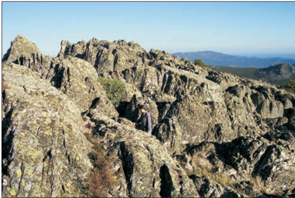
FIG. 3. Panorama de conjunto de la cuesta culminante de la Sierras de Dormideros. Es un dorso de cresta con «callejones».