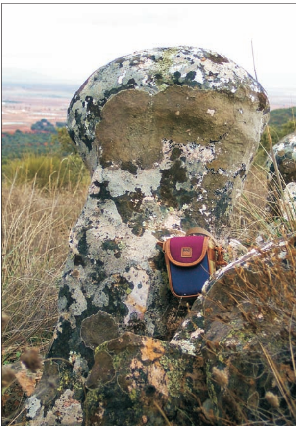
Fig. 9. Columnas redondeadas en «la Atalaya» (Ciudad Real).