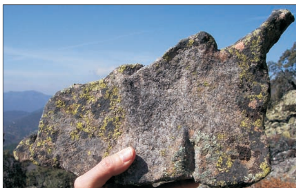
FIG. 16. Bloque de pedriza con un apéndice en forma de tubo. Sierra Madrona.

esporádica. Aunque hay algunos valles fluviales con ciertas analogías en las formas con los cañones, como el curso alto del río Tablillas en la sierra de la Umbría de Alcudia, parece que dichas analogías se deben a causas estructurales (configuración local del plegamiento de las propias cuarcitas armóricas).