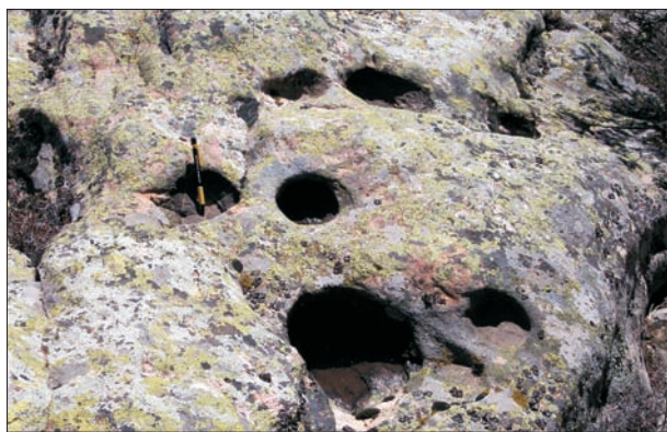
Fig. 10. (arriba) Acanaladuras o pseudolapiaces en la Sierra de Navalmanzano.