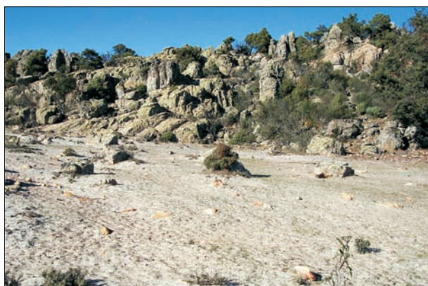
FIG. 15. Arenal de la cumbre de la Sierra de Navalmanzano.