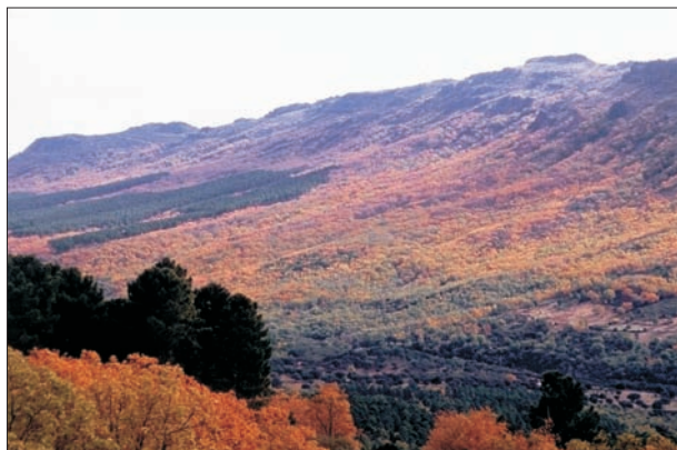
FIG. 1. Paisaje general de la umbría de la Sierra de Dormideros. Fisonomía del relieve apalachense.