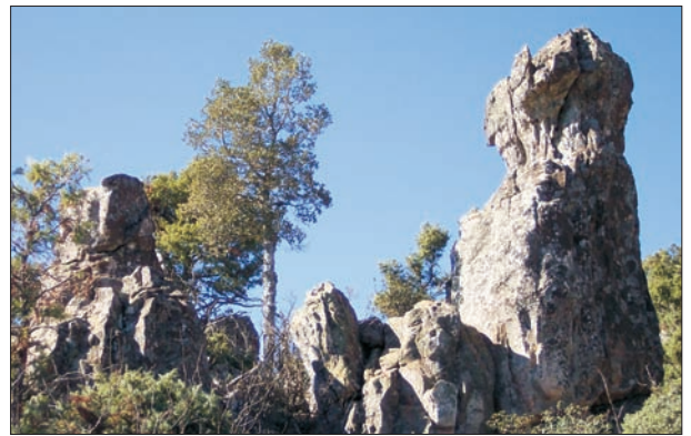
FIG. 6. Formaciones turrículadas (Detalle) en Sierra de Navalmanzano.