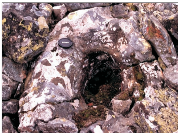
FIG. 13. Bloque de pedriza en la Sierra de las Majadas (Piedrabuena). La cavidad se asemeja a las marmitas de gigante de los lechos fluviales.