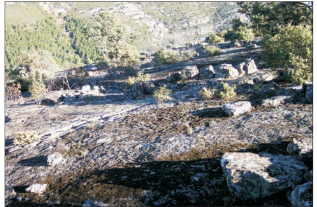
FIG. 4. Dorso o Pavimento empedrado en la Sierra de Navalmanzano, con una cubierta de clastos de escasa densidad.