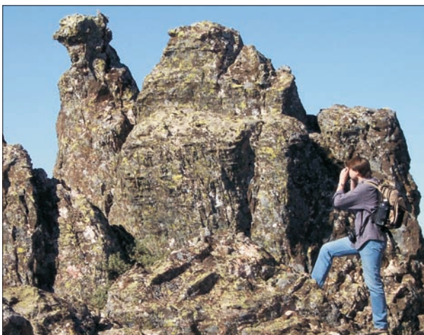
FIG. 7. Columnas en forma de torre con formas de animales en la Sierra de Dormideros.