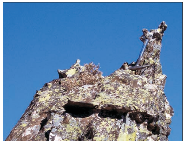
FIG. 8. Columnas con formas de animales y niveles de endurecimiento o concreciones. Sierra de Dormideros.