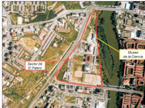
FIG. 3. Primera fase de las obras de construcción del Museo de la Ciencia.

La regeneración urbana se promueve habitualmente a partir de espacios concebidos para el consumo de tiempo libre, ocio, entretenimiento y cultura, pero no de