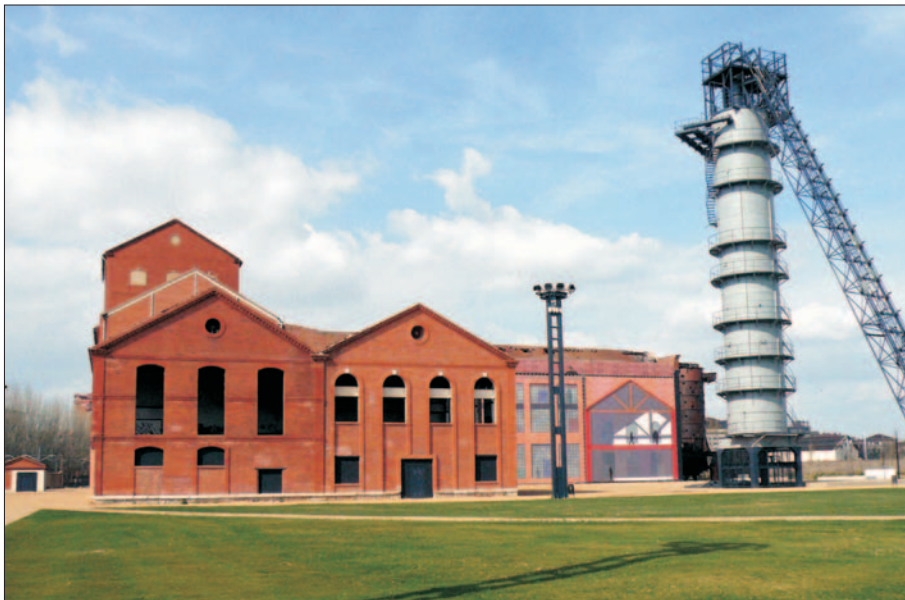
FIG. 9. Viejos edificios de la Azucarera Santa Victoria en el nuevo parque de las Norias. Año 2007.

detrás de estas viviendas, por el interés de los elementos decorativos de sus cornisas y frontones.