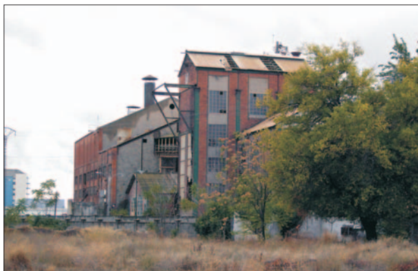
FIG. 8. Azucarera de Santa Victoria en 2005, una década después del final de su actividad.

Es el otro solar (66.810 m 2 ), entre el Camino de la Esperanza y el Camino de la Azucarera, sobre el que está situado el complejo fabril de la antigua Fábrica de Santa Victoria.