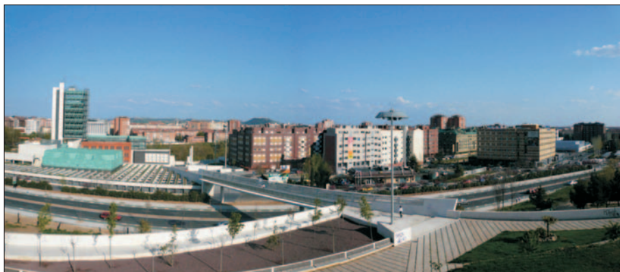
FIG. 4. Museo de la Ciencia de Valladolid y plan parcial Sector 29 El Palero en 2007.

dos en ladrillo, el conjunto de silos, los almacenes, el edificio de turbinas y transmisiones, un pequeño recinto que albergó el transformador y el edificio que sirvió de vivienda. Estos inmuebles habían sido incluidos en el Plan Parcial El Palero y sus sucesivas modificaciones (aprobado definitivamente en septiembre de 1992) dentro del Catálogo de Bienes Protegidos con la categoría de protección estructural (P3) aunque con posterioridad, en el Documento de Revisión del PGOU de Valladolid, se confirma únicamente la catalogación del cuerpo principal de la fábrica y la sala de turbinas y transmisiones 14 .