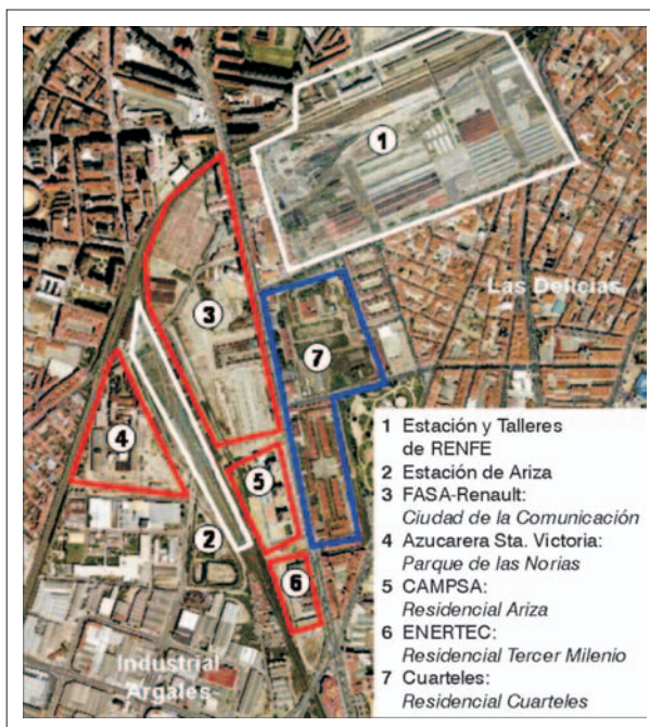
FIG. 5. Reconversión para uso residencial de las principales áreas de industrialización tradicional en Valladolid: talleres del Ferrocarril (1) y azucarera de Santa Victoria (4).

La operación arquitectónica y urbanística del Museo de la Ciencia de Valladolid se completa con la presentación en octubre de 1998 de la tercera fase del Proyecto de Ejecución (aprobado en sesión de Pleno de 8 de abril de 1999) que contiene el programa de necesidades referido al edificio de la torre, vestíbulo, planetario y sala de exposiciones temporales y posteriormente con la cuarta y quinta fases del proyecto de urbanización de puente y pasarela, auditorio y aparcamiento que cierran la intervención en el año 2004. Las características de estos elementos responden al sentido y el significado que sus autores quieren otorgarles en el conjunto de la obra: la