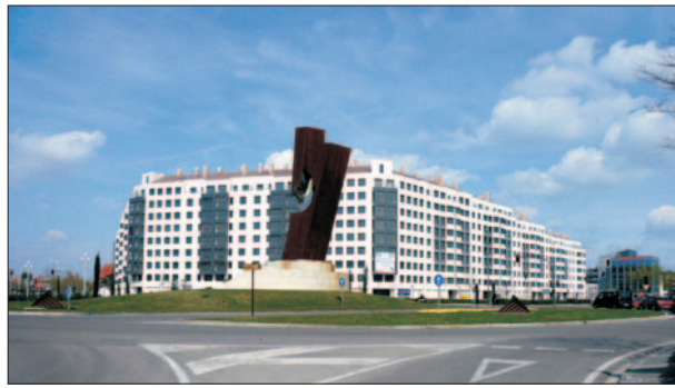
FIG. 7. Operación inmobiliaria (Metrovacesa, Parquesol Inmobiliaria y Edificasa 2000) sobre el solar de la fábrica de piensos C.I.A. Año 2007.

del régimen urbanístico de la Fábrica de Piensos C.I.A., reconociendo un aprovechamiento residencial equivalente tanto a la transformación del uso industrial existente sobre la propia parcela como al aprovechamiento transferido desde las parcelas de Azucarera Santa Victoria y depuradora aneja que también se transforman. Asimismo, se establece la reclasificación de los lotes de la azucarera y la depuradora, una vez transferidos sus aprovechamientos a Fábrica de Piensos C.I.A., con el fin de ceder al Ayuntamiento la parcela de la azucarera para dotaciones y espacios libres. Dicha cesión llevaba aparejada también una inversión en rehabilitación y urbanización de toda el área, que asumiría la entidad mercantil que suscribía el Convenio y que, como contrapartida, conservaría la titularidad de la parcela de la depuradora a la que se dotaría de un aprovechamiento residencial, del cual correspondería el 10% al Ayuntamiento.