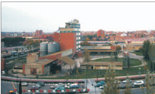
FIG. 6. Fábrica de piensos C.I.A. antes de su demolición en 2004. Una pieza esencial en el proceso de renovación de los enclaves industriales del sur de Valladolid.

todas las fábricas azucareras de la época, entre los que sobresale por encima de cualquier otro criterio la proximidad al ferrocarril, en este caso, la confluencia de las líneas ferroviarias de Valladolid - Ariza y del Norte (Madrid/Irún) que aseguraban el abastecimiento a la fábrica de las materias primas y los insumos necesarios (remolacha, caliza y carbón) y permitían la salida y la distribución del producto terminado hacia los mercados de venta.