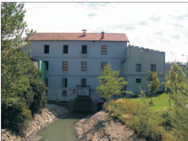
FIG. 2. Fábrica de harinas La Perla (1841). Reconversión de una vieja permanencia de la primera industrialización de Valladolid.