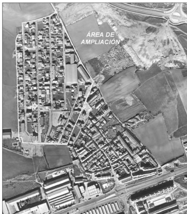
FIG. 2. Núcleo urbano de La Flecha y área de ampliación del casco urbano. El sector de ampliación del casco urbano de La Flecha pasó a conocerse en Arroyo de la Encomienda como «Barrio de San Lorenzo». Fotografía aérea, 1995.

La Flecha», donde se señalaba que la superficie ocupada era exactamente de 19,2 Has. y que las parcelas ofertadas tenían una media de unos 300 m 2 , insistiendo en la necesidad de impedir la subdivisión de parcelas por parte de los nuevos propietarios, con el fin de evitar una densificación exagerada de la zona. Sin embargo, la C.P.U. de Valladolid procedió a denegar la aprobación de este Plan Parcial, por razones muy similares a las reseñadas para la iniciativa del Plan Parcial Arroyo de la Encomienda 1 .