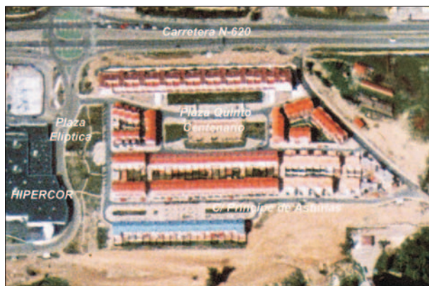
FIG. 4. Urbanización Monasterio del Prado en Arroyo de la Encienda. El Plan Parcial Monasterio del Prado fue aprobado definitivamente a finales de 1988 con una extensión total de 13,6 Has. Fotografía aérea, 1999.

responder a la creciente demanda de este tipo de alojamiento por parte de población de la ciudad con un nivel adquisitivo medio-alto, ya no como viviendas secundarias para el período estival o períodos vacacionales, sino como principales.