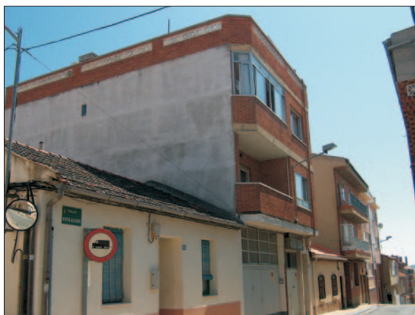
FIG. 3. El contraste entre edificios de diferentes alturas es algo característico en buena parte de las calles del núcleo de La Flecha. 2005.

Además del crecimiento por colmatación-sustitución que durante esta primera etapa caracterizó al núcleo histórico de Arroyo y, sobre todo, a La Flecha, las Normas Subsidiarias de 1987 incluían también el establecimiento de un área clasificada como Suelo Apto para Urbanizar situada al sur del propio núcleo de La Flecha, en el espacio comprendido entre la antigua Carretera N-620 (actual A-62) y el río Pisuerga, y que limitaría, a su vez, con el término municipal de Valladolid por el este y con las instalaciones de Cartonera Española (hoy Smurfit Ibersac, S.A.) por el oeste.