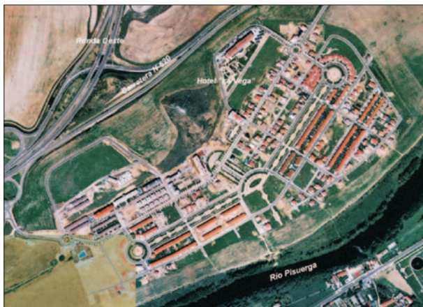
FIG. 5. Urbanización La Vega en Arroyo de la Encomienda. La baja densidad edificatoria y la proximidad a un espacio de gran atractivo ambiental, como es la ribera del Pisuerga, convirtieron a la urbanización La Vega durante los años noventa en el estandarte de la calidad residencial de que se presume hoy en día en Arroyo de la Encomienda. Fotografía aérea, 1999.

En consecuencia, a principios de 1990, la Comisión Provincial de Urbanismo denegó la aprobación definitiva de dicha modificación, argumentando que, lógicamente, el planteamiento adoptado por la corporación local iba mucho más allá de la autorización que le había sido concedida en relación al cumplimiento de la sentencia del Tribunal Supremo y que, en realidad, respondía más bien a una revisión de las vigentes Normas Subsidiarias y no a una modificación puntual de las mismas. Además, la propuesta incluía la reclasificación de un suelo clasificado como no urbanizable de especial protección, lo que expresamente iba en contra de la mencionada autorización.