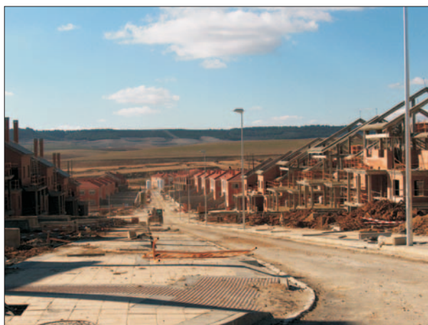
FIG. 7. Vista de la Calle La Malaza en el conjunto residencial Sotoverde. El conjunto residencial Sotoverde se localiza en la ladera meridional del páramo que marca el inicio de los Montes de Torozos en Arroyo, circunstancia que además obliga a una disposición escalonada de las edificaciones para salvar el desnivel existente. 2005.

La única excepción sería el caso del Sector nº 7, que es el que corresponde al conjunto residencial «Sotoverde Casas & Golf» y que, promovido por Fadesa, iniciaba su desarrollo ya en el año 2002, de forma que en la actualidad se halla en una fase muy avanzada. Una actuación que, desarrollada a través de Plan Parcial, no ha estado exenta de cierta polémica, pues se ubica en un área de notable valor paisajístico.