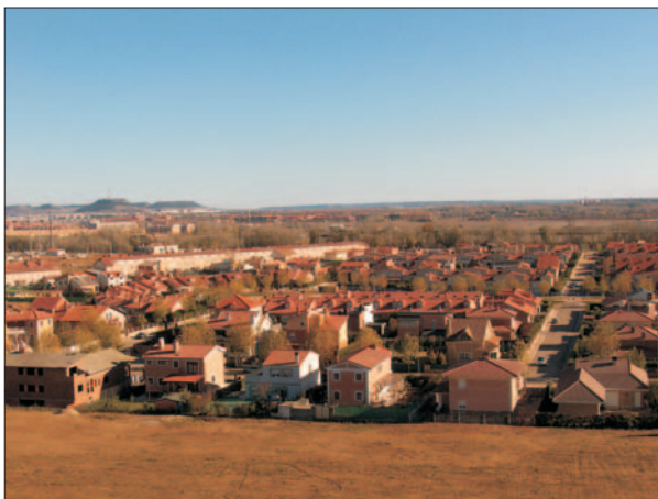
FIG. 6. Vista panorámica de la urbanización La Vega desde el Cerro de la Horca. Uno de los aspectos más llamativos de La Vega es la gran variedad de tipologías que caracteriza a los chalés exentos, que rompen con la homogeneidad que caracteriza a las parcelas de adosados. Panorámica de la urbanización desde el Cerro de La Horca, 2005.

En este sentido, la práctica totalidad de las promociones de adosados en La Vega se habían concluido, o bien se encontraban próximas a su finalización, en 1998. Éste fue el caso, por ejemplo, de las 171 viviendas de este tipo construidas por Proyectos y Construcciones BMAG, S.L. o de las 42 acometidas por Hegumar La Vega S.A. Sin embargo, no ocurrió lo mismo en cuanto a los inmuebles destinados a vivienda colectiva, ya que una parte de los mismos, sobre todo los del tramo central de la Avenida de José Luis Lasa, se realiza-