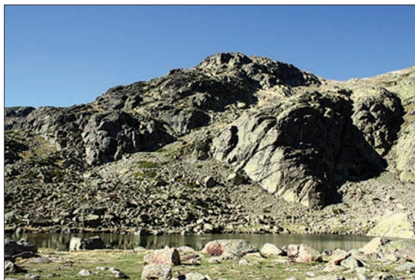
FIG. 4. Laguna de Peñalara.

madrileños ricos, oponiéndose, en consecuencia, a la expropiación. El Sol respondió pocos días después con un editorial en el que se negaba que la Sierra fuese a pasar a los madrileños (ricos o pobres), ya que era propiedad de los pueblos y, muy al contrario, la declaración de parque nacional traería consigo el rescate de la Sierra; la repoblación de los calveros ayudaría a regularizar el clima madrileño y se multiplicarían los transportes para que todos los vecinos de Madrid tuvieran las mismas posibilidades de acceso al Guadarrama. Esto, que parecía el comienzo de un debate ideológico más profundo, quedó (al menos en la prensa) como una simple escaramuza.