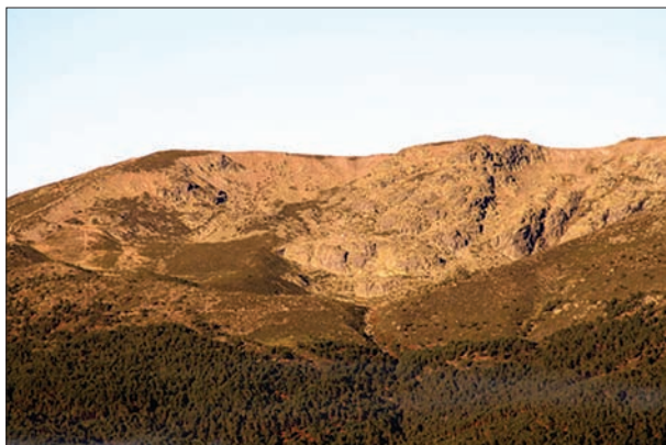
FIG. 6. Vista de Peñalara.