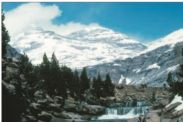
FIG. 2. Vista del Parque Nacional de Ordesa.

nexo de unión entre el presente y la historia como forma de conseguir esos objetivos.