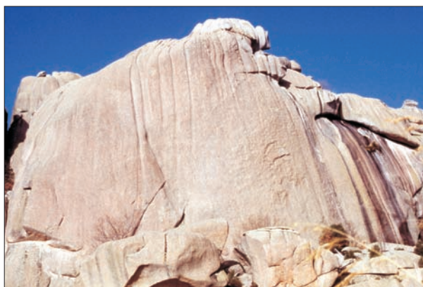
FIG. 5. La Pedriza de Manzanares.

El Sitio está dotado de gran belleza natural y ocupa posición dominante, desde la que se distingue el extenso panorama de las