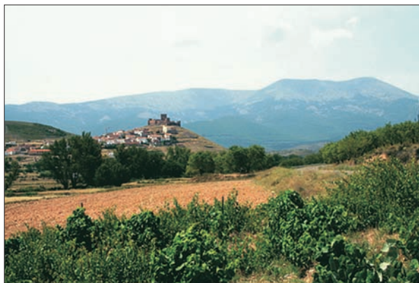
FIG. 3. Vista del Moncayo.

«La rica complejidad de nuestro suelo nos ha dado, junto a desventajas notorias, que para la agricultura y las comunicaciones hacen aquí más dura que en muchos otros países de igual zona la lucha con la naturaleza y más explicable los atrasos, una variedad admirable de cuadros naturales, que desde el oasis africano, de ejemplar muy característico en la levantina Elche, y el panorama severo y majestuoso de las llanuras castellanas, hasta los circos