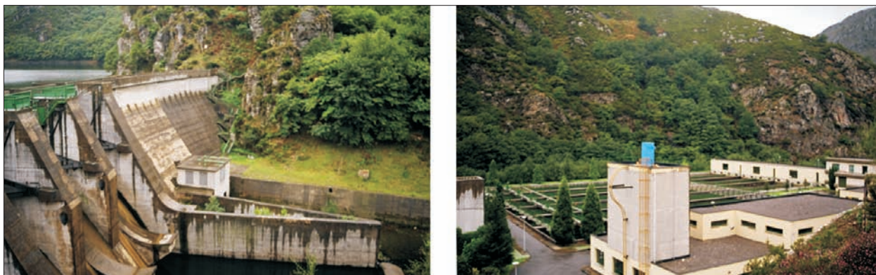
FIG. 2. Presa y potabilizadora de Rioseco (Sobrescobio). Fotografías: Antonio Ramón Felgueroso Durán.