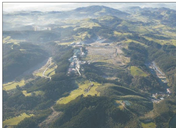
FIG. 7. Vertedero de Serín.

Quemadona) reunía las mejores condiciones físicas y de centricidad, dentro del área metropolitana de Asturias. Las obras de acondicionamiento comenzaron en agosto de 1984 y concluyeron en octubre de 1985. Al año siguiente, todas las basuras de los ayuntamientos que en 1982 habían decidido consorciarse (Consortio para la Gestión de los Residuos Sólidos de Asturias [Cogersa]), un total de ocho más el Principado, se depositaban en el vertedero.