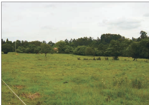
FIG. 8. Vega de Vilorteo, área donde se prevé instalar la incineradora.

de la colaboración ciudadana desde la recogida selectiva, que creció de manera considerable en 2006.