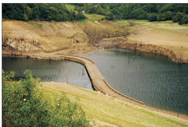
FIG. 3. El puente viejo de Tanes, visible por estiaje.