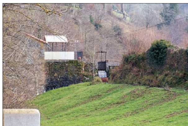
FIG 4. La antigua central hidroeléctrica de Bezares (Caso).

por la noche, en horas valle, se bombea el agua desde el embalse de Rioseco al de Tanes.