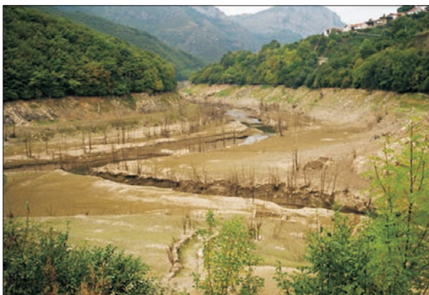
FIG. 6. La cola del embalse de Tanes, sin agua por el estiaje.