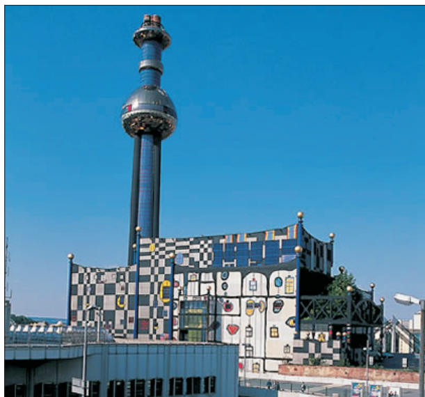
FIG. 9. Incineradora de Spittelau (Viena).

8,9 euros, frente a los 35 euros como mínimo que costaría incinerada, a pesar de que el calor se aplicaría en una central termoelectrica que tendría capacidad para cubrir las necesidades de una población como la de Avilés (80.000 habitantes); además, el problema no queda por entero resuelto si se tiene en cuenta que de cada cien metros cúbicos de basura que se quemen resultarían diez metros cúbicos de escorias que sería necesario depositar en el vertedero. Es imprescindible, pues, reservar hueco en el vertedero actual, hipotecado si no se construye pronto el horno o planta incineradora, que llegaría de todas formas con retraso, incluso bajo el punto de vista tecnológico.