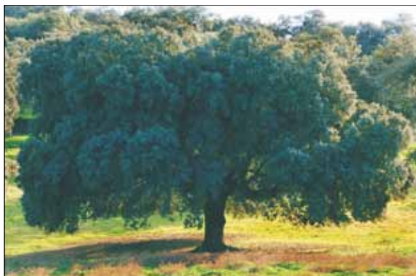
FIG. 4. Fisonomía de la encina en la dehesa.

del mismo, aunque no siempre se deje ver a causa de la movilidad inherente a su condición de sistema ganadero extensivo. Está integrada por diversas especies (porcinos, vacunos, ovinos, equinos, toros de lidia, animales introducidos para las monterías...) cuyo predominio y combinación dependen del tipo de dehesa y de las circunstancias de su explotación histórica.