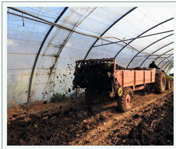
FIG. 1. Labores de preparación de los invernaderos de la finca El Borrón, en Villardeveyo (Llanera), para la plantación de tomates (25 de febrero de 2020).

Por su consideración prioritaria del capital humano para crecer, la empresa se apoya en un equipo multidisciplinar con experiencia en diferentes ámbitos laborales que pretende repercutir positivamente en el desarrollo agrícola, estimular la innovación tecnológica relacionada, crear empleo y formar pro-