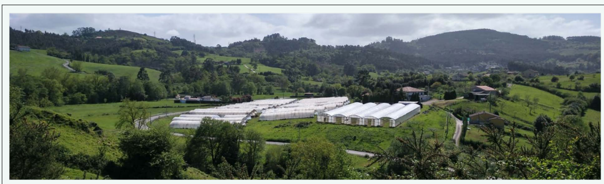
FIG. 2. Vista parcial de la finca El Borrón en su emplazamiento de Llanera, próximo a Villabona y a la espalda de algunos cordales prelitorales, entre los que destaca el pico Santufirme (al fondo, a la derecha, en segundo plano).

El grupo que impulsa el proyecto se basa en la idea de que la sociedad otorga una importancia creciente a la calidad de los procedimientos agrarios y de sus productos; para lo cual es necesaria la competitividad en las etapas iniciales de la cadena de producción y la creación de un tejido empresarial en esta actividad. Como se dice en Rural Ecolab, «más empresas produciendo harán crecer el sector para