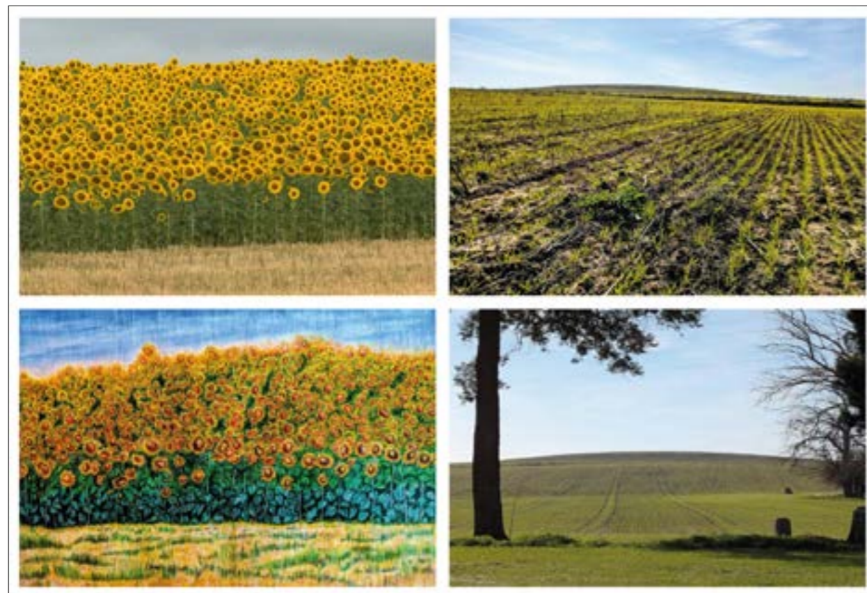
FIG. 4. Vista de campos de girasoles desde una loma de Valencina, en primavera e invierno. Fotos del autor e imagen elaborada también por el autor a partir de una foto cedida por Alonso Pedrote.

El factor formal que determina su equilibrio visual guarda relación con la posición erguida de las plantas en el espacio, dado su marcado sentido vertical. Además, la línea base de la plantación de girasoles, con su densidad e individualidad, produce un efecto de profundidad junto con las cabezas de los girasoles, que se separan unas de otras con variados espacios intersticiales, ganando así notoriedad y contraste. Además, a medida que los ejemplares van subiendo la colina, pierden nitidez, hasta quedar difuminados en una atmósfera brumosa, tal como establecen las leyes de la física y las convenciones perceptivas actuales, de contenido estético, respecto a los objetos lejanos.