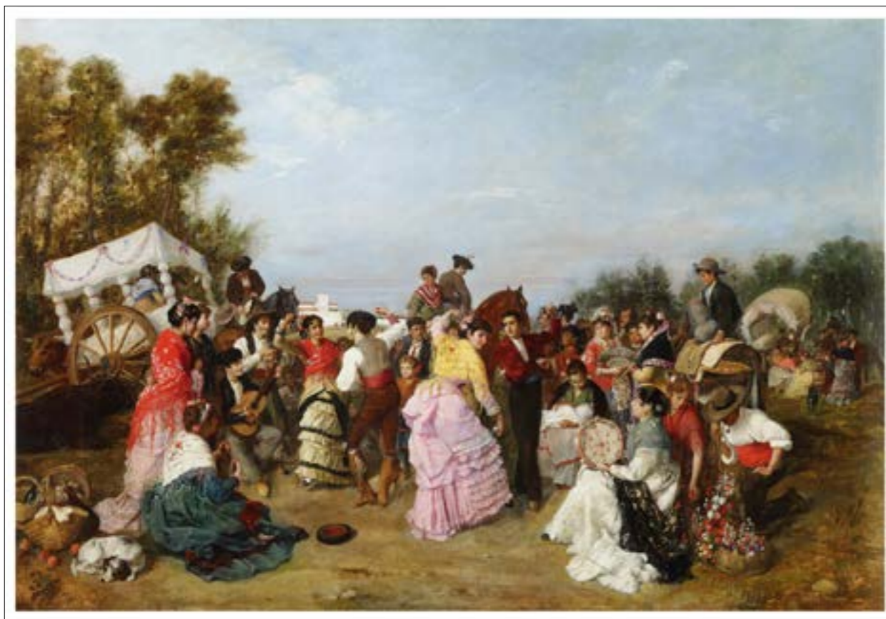
FIG. 7. Romería de Torrijos. Fuente: Manuel Cabral y Aguado Bejarano (1883). En la romería de Torrijos, Sevilla . Colección Carmen Thyssen Bornemisza, https://coleccioncarmen Thyssen.es/work/en-la-romeria-de-torrijos-1883/

fortaleza militar, que tiene la consideración de bien de interés cultural y zona arqueológica (IAPH. Cód. 01410960034). Este monumento mozárabe conserva paños de muralla enclada con sus almenas y torre principal. La ermita funciona en la actualidad como lugar de culto religioso y romería anual de Torrijos, considerada entre las principales a nivel provincial (fiesta de interés turístico de Andalucía, 1998). Este significado espiritual se extiende a todo el término municipal de Valencina, debido a ser un importante centro arqueológico peninsular de especial protección perteneciente a la cultura megalítica y de culto a los muertos del periodo Calcolítico (García Sanjuán et al., 2024).