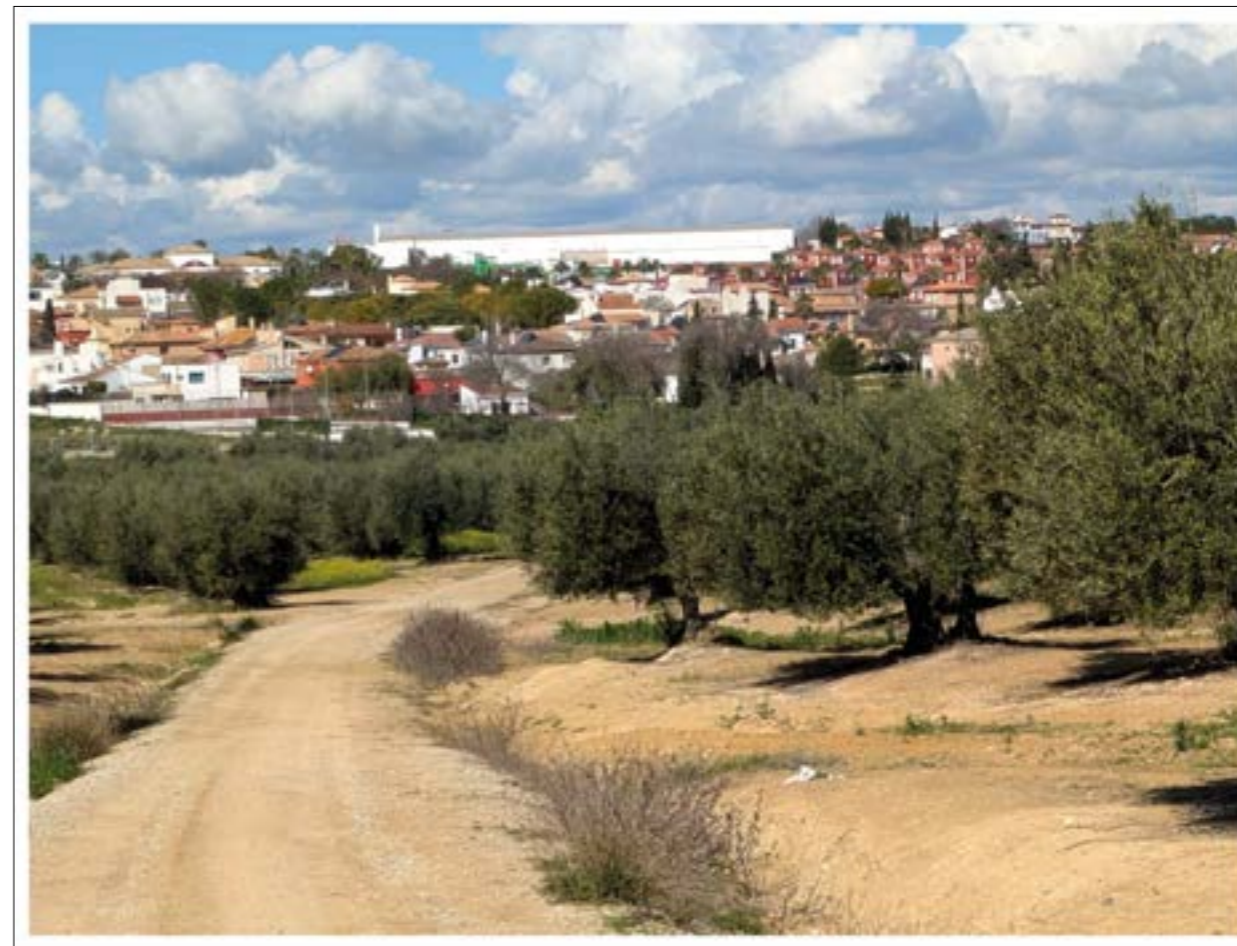
FIG. 6. Vista del núcleo urbano de Salteras por el Cordel de los Carboneros.

En definitiva, este itinerario representa para algunos senderistas que lo recorren una percepción