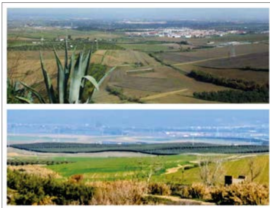
FIG. 3. Vistas desde el Mirador de La Gallega (Valencina) y del Campo de Gerena desde el escarpe próximo a la estación de ferrocarril de Salteras.

vo en regadío, rompiendo en muchos casos su vertería y homogeneizándose formalmente debido a la desaparición de la dinámica que le prestaban sus rotaciones periódicas. De manera que el olivar comienza a percibirse como un paisaje monótono que ha perdido belleza, color y el dinamismo que le proporcionaba una fauna diversa que lo tenía como hábitat natural, como sucede en el área que se extiende al bajar por la corriente del arroyo Pie de Palo. En definitiva, el olivar que se está imponiendo en la actualidad es de una sola variedad, naciendo de un saco plastificado y en un lugar ajeno o invernadero como plantío de una estaca embarrada con arcilla roja y luego trasplantada a su lugar de producción, con el objetivo final de convertirlo, en pocos años, en árboles de alta rentabilidad. Este paisaje se puede apreciar, especialmente, en la bajada del escarpe nororiental hacia el Campo de Gerena (Fig. 3).