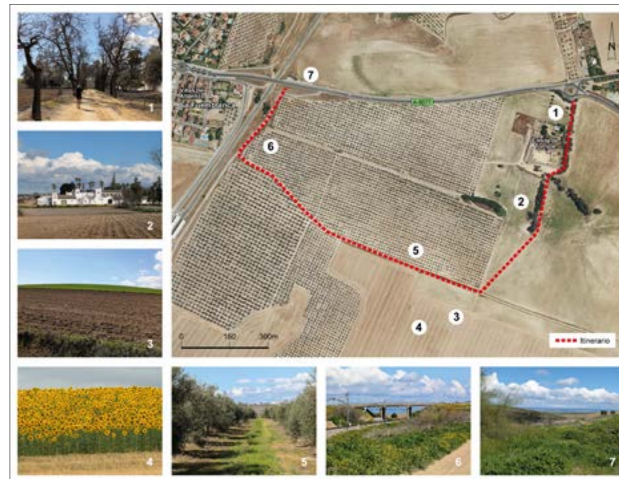
FIG. 5. Itinerario objeto de estudio y localización de las imágenes tomadas durante su recorrido. Elaboración propia a partir de fotos del autor y ortofoto del IGN.

El reconocimiento actual del valor de las vías pecuarias se culmina en España con la Ley 3/1995, de 23 de marzo, de Vías Pecuarias, en la que queda recogida, por primera vez en un documento público de esta naturaleza, el uso y las funciones que esta red de caminos cumple en la actualidad. Esta ley añade a su uso tradicional otros compatibles y complementarios, como es la práctica del senderismo, la cabalgada y otras formas de desplazamiento deportivo sobre vehículos no motorizados. La citada ley tiene su desarrollo en Andalucía mediante el Decre-