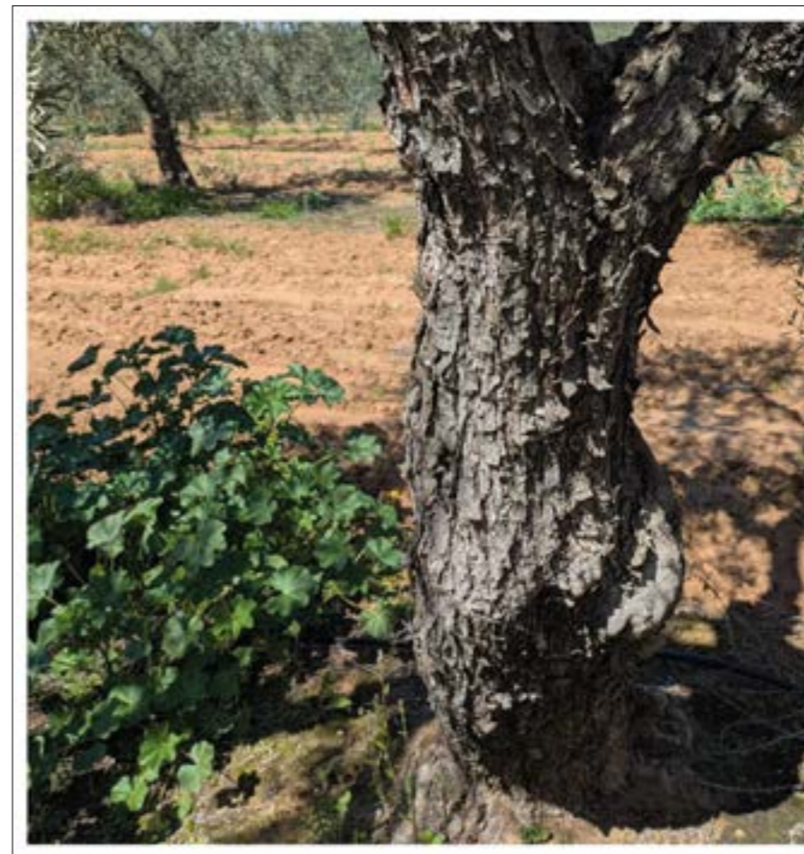
FIG. 8. Detalle de un olivar.

El año está siendo de jaramagos... como si un pintor con brocha anchísima se hubiera entretenido en ir pintando de amarillo las camadas de los olivos, punteando de amarillo zanjas y lindes, cercados y senderos, dejando en claro los redondeles de los olivos (p. 47).