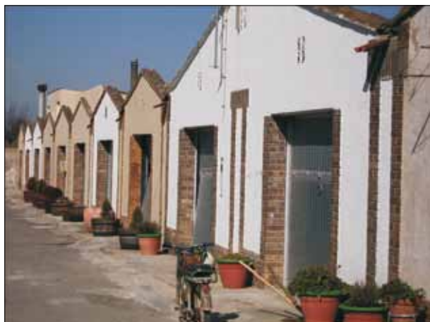
FIG. 3. Casas de la calle del Formigó. Primeras casas para trabajadores construidas en Raïmat en la década de 1920. El nombre de la calle ( hormigón en castellano) hace alusión al nuevo material empleado en su construcción.

industrial Agustí Rosal, presentaba, desde el punto de vista tecnológico, una serie de aspectos muy innovadores (Noguera, 1988, p. 28). Cuando la visitó Manuel Raventós tenía una superficie de 400 ha, de las que una mitad estaba ocupada por bosques y la otra por cultivos de regadío. La mayor parte de la gente residía en un pequeño núcleo, en el que estaba ubicada la mansión residencial de la familia Rosal, los edificios de carácter productivo de la colonia (granjas, establos, etc.), tres calles separadas con edificios de pisos donde vivían los trabajadores, la casa del cura y la escuela. Fuera de este núcleo residencial había algunas masías dispersas por la finca.