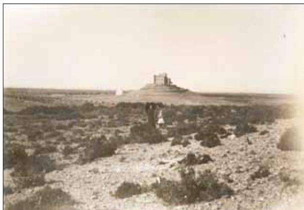
FIG. 1. Vista del castillo de Raïmat en 1914.

En este artículo se abordará el tema de la creación de la colonia de Raïmat llevada a cabo por Manuel Raventós entre 1914 y 1930. La formación de este asentamiento humano constituye un capítulo específico en la historia de la repoblación moderna y contemporánea del área del canal de Aragón y Cataluña. Además, dado que el diseño de esta colonia fue encargado al arquitecto modernista Joan Rubió i Bellver, su construcción constituye un ejemplo excepcional en Cataluña de colonia agraria basada en el modelo inglés de las colonias jardín. Por último, la singularidad artística de algunos de los edificios que construyó Rubió i Bellver, como la iglesia o las bodegas, confiere a este poblado un notable interés paisajístico.