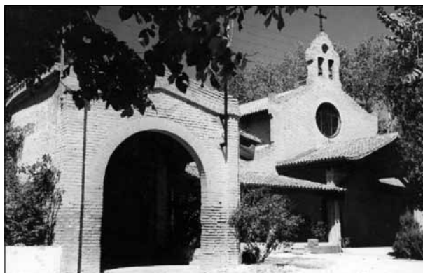
FIG. 4. Iglesia de Raïmat construida por el arquitecto Joan Rubió i Bellver entre 1918 y 1921.

Tanto el uno como el otro eran hombres de profundas convicciones católicas. Convicciones que, en el caso de Rubió i Bellver, pueden observarse en su trabajo arquitectónico (Fig. 4). El ideario estético del obispo Torras i Bages, con el que mantenía una estrecha relación, fue