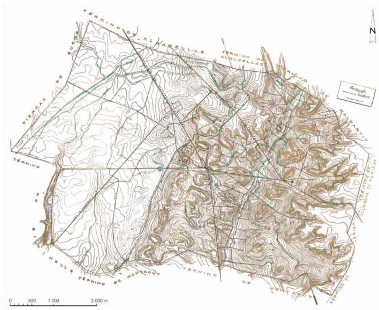
FIG. 5. Mapa topográfico de la finca de Raïmat a escala 1:30 000, levantado hacia 1920 por el ingeniero F. Kubesch (Archivo Codorniu). En el centro del mismo puede apreciarse la forma hexagonal del proyecto de poblado diseñado por el arquitecto Joan Rubió i Bellver.

cial de relaciones productivas lo más conservador posible (Terrades, 1994, pp. 42-65).