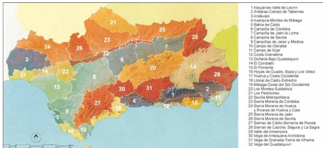
FIG. 1. Definición de demarcaciones paisajísticas en Andalucía. Fuente: Fernández Cacho y otros (2010, p. 14).

y otros, 2012). No obstante, aún se trata de un campo de trabajo poco desarrollado; especialmente en lo relacionado con los paisajes de interés cultural. No resulta fácil señalar cuáles son los valores patrimoniales del paisaje desde el punto de vista cultural, campo cuyas metodologías de análisis son extraordinariamente complejas, pero sí al menos puede convenirse en que tales valores se convierten en identitarios para las poblaciones que los habitan y que son susceptibles de obtener reconocimientos oficiales para su protección y mejor gestión. Para ello se propone establecer dos escalas de referencia: