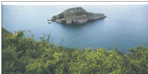
FIG. 5. Isla de la Deva (Castrillón).

Tal y como se ha descrito en la primera parte de este artículo, su objetivo era identificar los paisajes de interés cultural de Asturias (PICAS, véase Fig. 4). Los PICAS han sido seleccionados en razón de los criterios señalados en los epígrafes del punto 3, tanto en lo que responde a la selección de su dominante patrimonial, como en lo que respecta a otros aspectos; entre ellos por su carácter excepcional y único (véase Fig. 5), o bien porque son ejemplos destacados de un tipo de paisaje cultural más extenso en la región (por ejemplo, algunas brañas u otros paisajes agrarios, véase Fig. 6). Hay que recordar que el objetivo básico en la identificación de PICAS que se ofrece en este trabajo es una primera propuesta que no debe ser