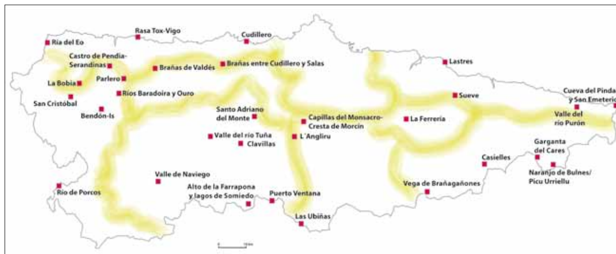
FIG. 8. Los lugares de excepcional valor paisajístico (LEVPAS) en Asturias.

PICA en el área central de la región, interrumpiendo su definición entre las proximidades de Pola de Siero y el río Nalón. No es que no se reconozca el Camino como bien cultural, entre otros concejos, a su paso por el de Castrillón o el de Oviedo, sino que se considera que su potencialidad para proyectarse en un paisaje de interés cultural ha sido alterada en estos tramos.