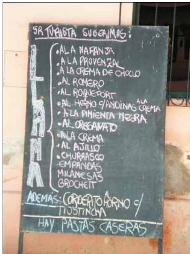
FIG. 3. Menú exhibido a la entrada de un restaurante en Tilcara.

Otros cambios en la presentación de la Quebrada patrimonial fueron introducidos por los sectores vinculados a la comercialización de objetos artesanales y los prestadores de servicios turísticos. La presencia del turismo ha favorecido la proliferación de ciertos productos fabricados masivamente en Bolivia u otras áreas del país, objetados por algunos sectores de la población de la Quebrada y por ciertos prestadores en tanto se afirma que no constituyen artesanías propias del lugar. Para ellos, estos productos elaborados en otros lugares fuera de la Quebrada comparten la condición de «inauténticos» con los comercializados por los artesanos foráneos residentes en la Quebrada 10 .