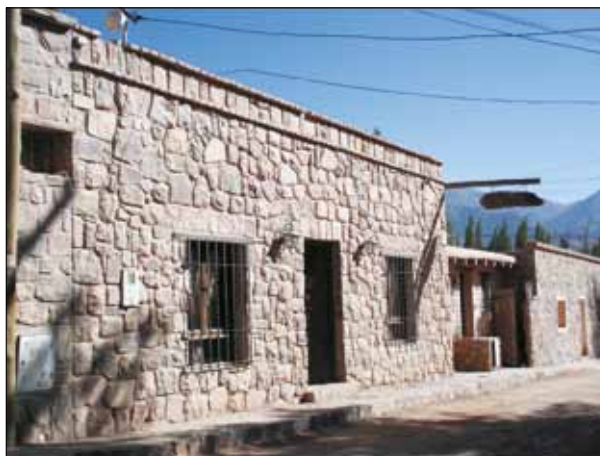
FIG. 2. Hostería en Tilcara.

Inspirado en la montaña que lo rodea, El Refugio de Coquena fue adaptado a su entorno, obteniendo cromáticamente la suavidad y el confort. Se encuentra de frente al río Purmamarca y rodeado por imponentes montañas multicolores. Reformulando la estética regional, se pueden apreciar espacios amplios, placenteros y