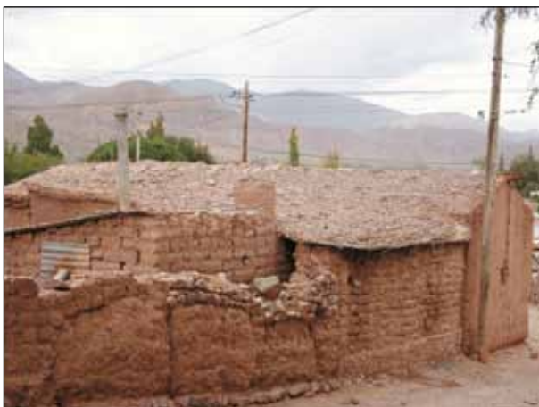
FIG. 1. Casa de adobe en Tilcara con techo de torta.

El adobe, que tradicionalmente se utilizaba en la zona para la confección de las paredes de las edificaciones, comenzó a ser abandonado en el siglo XX por otros materiales y técnicas de construcción asumidas como más modernas. De esta manera, en la Quebrada los materiales y las edificaciones en sí comienzan a ser similares a los existentes en las ciudades. El adobe es eliminado por obsoleto y las viviendas se construyen con hormigón, ladrillos y techos de chapa. Éstos también fueron los materiales que se emplearon en las obras de los planes de vivienda creados desde el Estado que se llevaron adelante en la Quebrada.