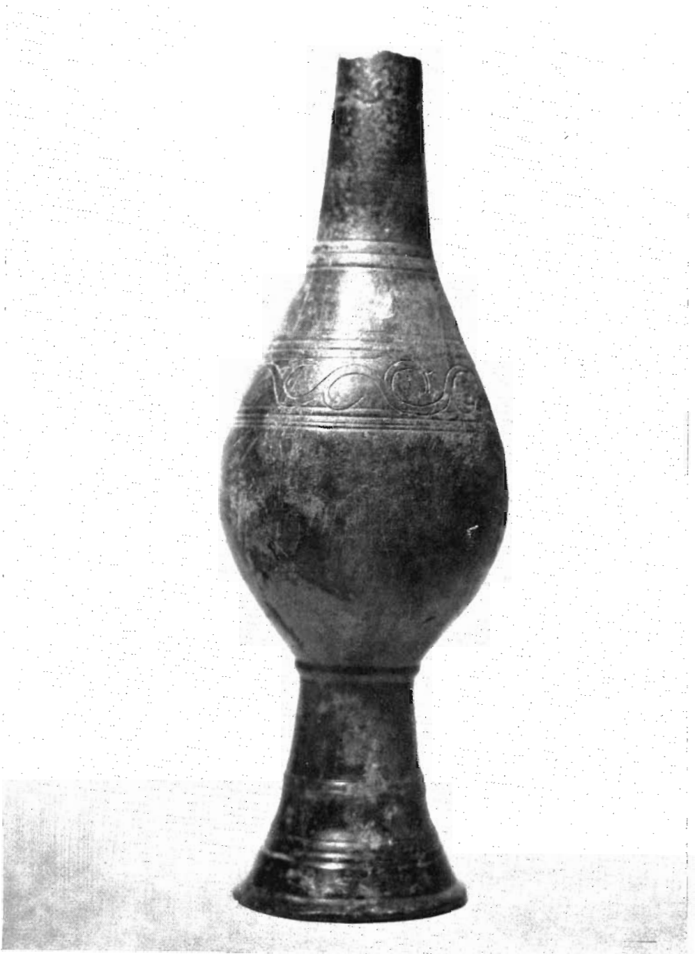
Estado actual del Jarrito de Pandavenes