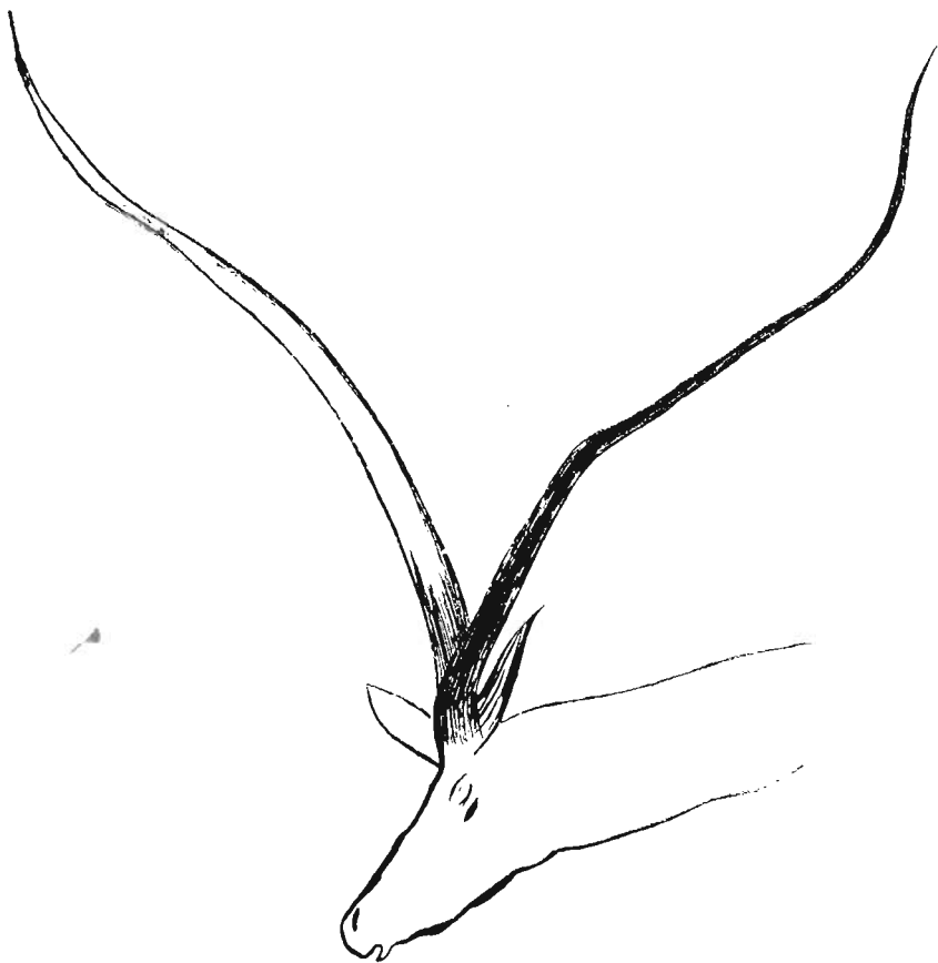
Fig. 41.—CABEZA DE CABRA MONTÉS GRABADA EN EL MURO DE LA CAVERNA DE LA PEÑA DE CANDAMO.

que aunque trazada con soltura y seguridad, esta figura: «no acusa con la exactitud de otras, los caracteres típicos de la especie, pues el anillado y rugosidad tan característico de los cuernos de las cabras monteses no se ha señalado» en ella; y termina diciendo: «sin