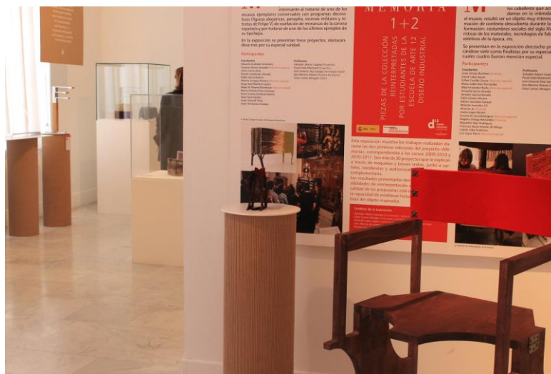
Figs. 13 y 14. Exposición de proyectos “Memoria 1+ 2”, celebrada en el Museo Nacional de Artes Decorativas (16 de diciembre 2011 – 21 de enero de 2012)

Quizá el ejemplo más claro de la trascendencia adquirida por alguno de estos objetos resultantes, fue la de la lámpara “Corazón” de Alberto Gorgojo, inspirada en la papelera de Felipe V (Nº Inv. 2631), que fue mostrada en la feria Casa Pasarela 2012 9 .