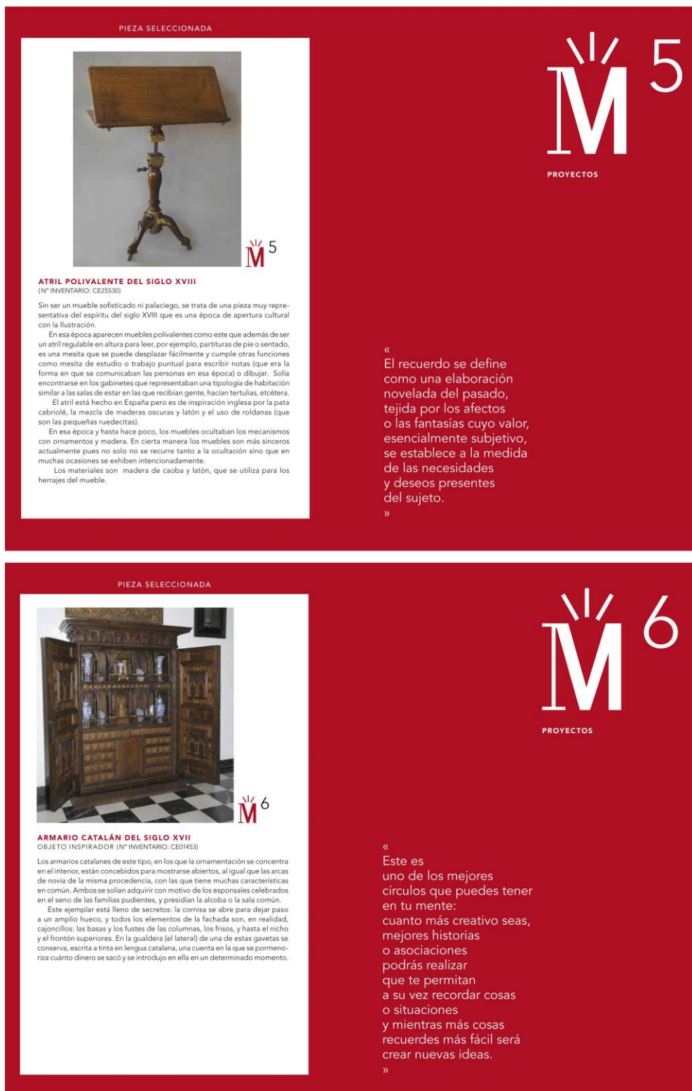
Fig. 9. Piezas inspiradoras de las ediciones 5 y 6 del proyecto Memoria: atril polivalente, s. XVII (Nº Inv.25530) y armario catalán, s. XVII (Nº Inv. 01453)