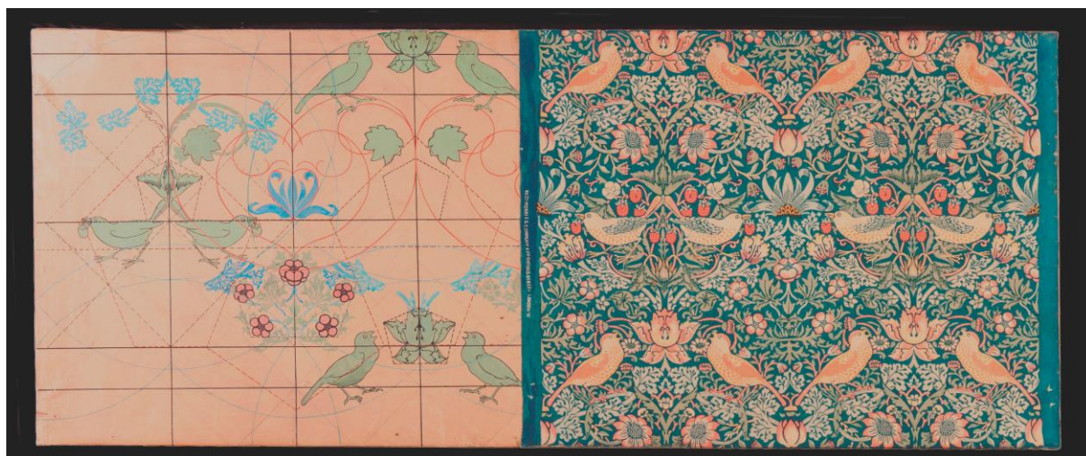
Fig. 2. Strawberry Thief de Morris & Co. Tejido de algodón estampado y dibujo analítico de la composición del tejido realizado en el Museo Nacional de Artes Industriales. Hacia 1915.

Mucho ha llovido desde entonces, pero el espíritu de aquellos años impregna la planificación estratégica del museo aún hoy. En este sentido, ya desde nuestro Plan Museológico (2003), pero más explícitamente en nuestro Plan Director (2011-2015), el diseño es parte fundamental de nuestro ideario. Así, el Museo ha ido estableciendo en los últimos años una serie de alianzas con diferentes agentes externos (escuelas de diseño, institutos, profesionales especializados en diversos campos como moda, artesanía o diseño gráfico) con los que colabora a través de programas como el mencionado “Diseño y Pedagogía” o a través de proyectos y campañas de sensibilización para diseñadores y empresarios del sector.