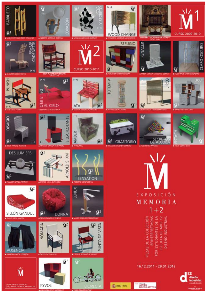
Fig. 4. Propuestas de reinterpretación de dos piezas de la colección de mobiliario del Museo que integraron la exposición “Memoria 1+2” (2011).

pasado recuperar aspectos perdidos, tipologías, formas, estilos,...?