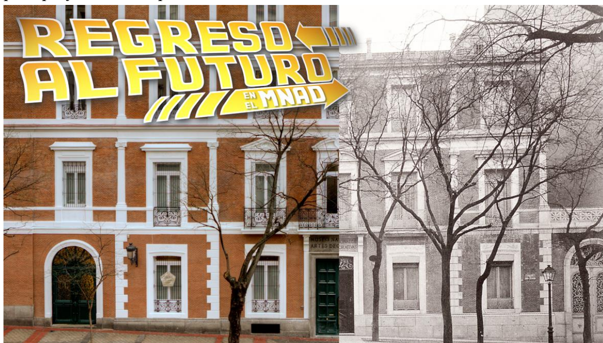
Fig. 1. Fachada del Museo Nacional de Artes Decorativas en su sede en la C/ Montalbán en la actualidad y antes de su ampliación en los años 40.

Esta diálogo entre Doc M. Brown y Marty McFly extraído de la película “Regreso al futuro” de Robert Zemeckis ( Back to the future , 1985) podría resumir el principal objetivo de uno de los proyectos pedagógicos vinculado a las colecciones de mobiliario del Museo: “Memoria”, proyecto que permite a diferentes estudiantes de diseño de la Comunidad de Madrid viajar al pasado para proyectar estas piezas hacia el futuro.