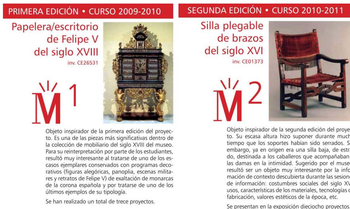
Fig. 7. Piezas inspiradoras de las ediciones 1 y 2 del proyecto Memoria: Papelera de la época de Felipe V, siglo XVIII (Nº Inv. 26531) y silla plegable de brazos, siglo XVI (Nº Inv. 1373)