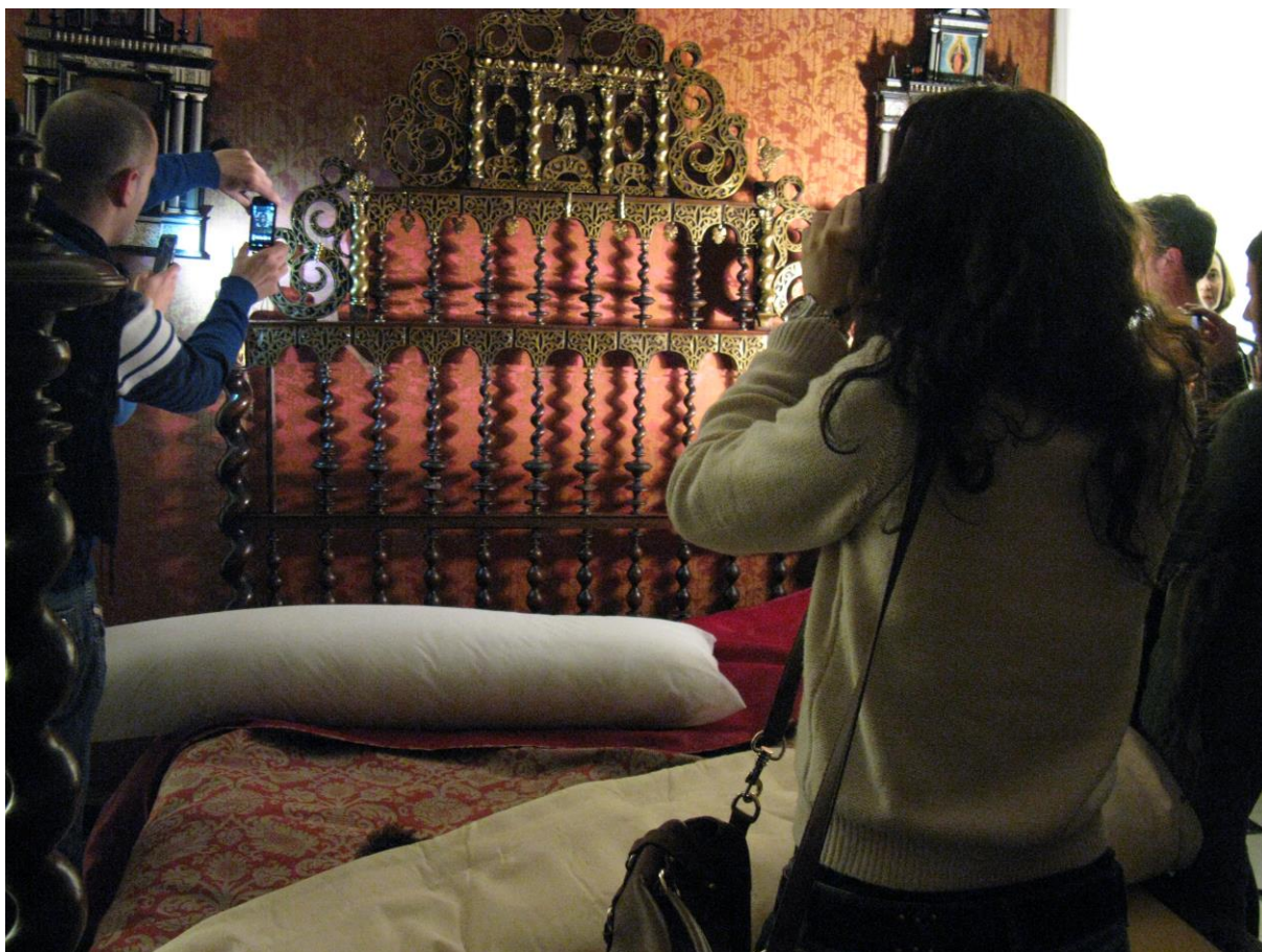
Fig. 6. Alumnos de la tercera edición del proyecto Memoria analizan la pieza seleccionada como objeto inspirador (cama portuguesa, s. XVII - Nº. Inv. 02059)