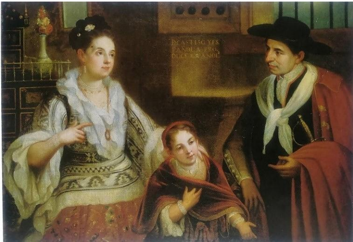
Fig. 10. Atribuido a Juan Rodríguez Juárez, De castizo y española, produce española (c.1715), óleo sobre lienzo, 103,5 x 145,5 cm. Colección particular. Fuente: (Katzew 2004: 73).

En el ejemplo de bargueño encontrado en De castizo y española, produce española (Fig. 10), aunque este no aparezca representado en su totalidad, se puede observar que se compone de dos cuerpos barrocos diferentes. El primero, de carácter más voluminoso, con diferentes cajones decorados y rematado por una balaustrada dorada. El segundo, de dimensiones más reducidas, también aparece decorado como el primero, añadiendo en lugar de balaustres, un remate piramidal y un pequeño pináculo sobre una bola en su extremo inferior, que posiblemente se repita al otro lado ya que son muebles bastante simétricos en su composición.