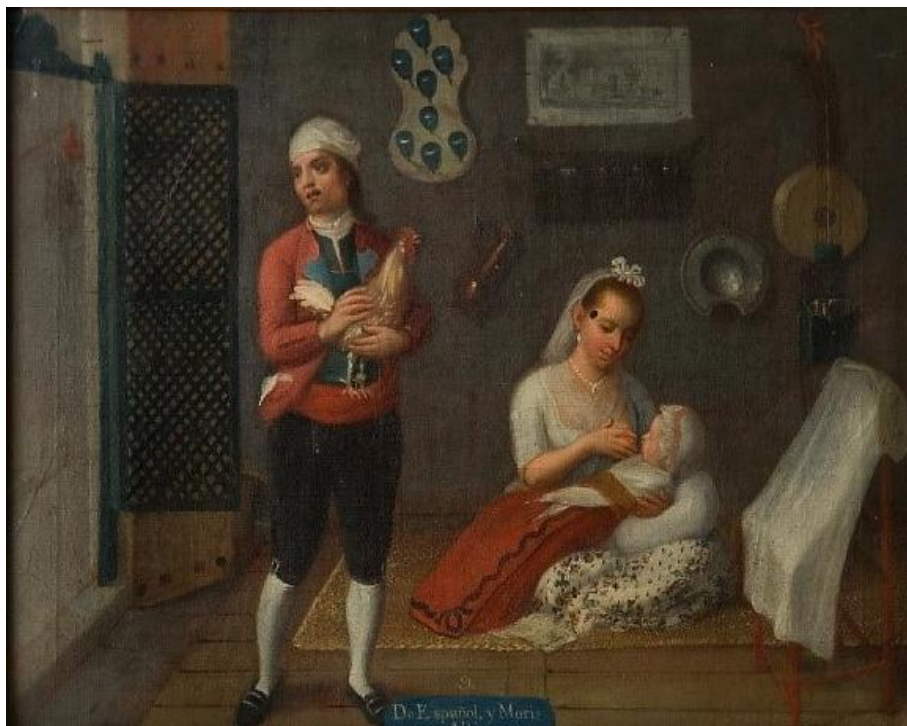
Fig. 5. Anónimo, De español y morisca, albino (c.1780), óleo sobre lienzo, 58 x 72 cm. Museo de América, Madrid.