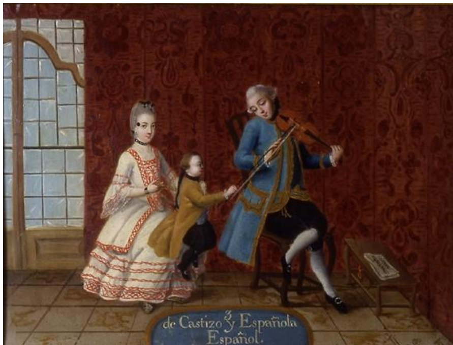
Fig. 11. Anónimo, De castizo y española, español (1775-1800). Óleo sobre cobre. 36 x 49 cm. Museo de América, Madrid.

Los biombos estaban compuestos por diversos materiales como puede ser la tela o la piel y posteriormente policromados. En ocasiones, se utilizaba la técnica del enconchado para decorarlos. 52 Algunos de los ejemplares están lacados. Esta técnica, como sucedía con el taraceado, también se puede aplicar a otros tipos de muebles, como los bargueños. 53 En la pintura De castizo y española, español (Fig. 11) se muestra un interior dominado por el color rojizo y los motivos ornamentales que aparecen en el biombo de cama. Este se caracteriza por tener “pocas hojas y muy altas” 54 y consigue dar a la estancia un aire de elegancia y refinamiento. 55