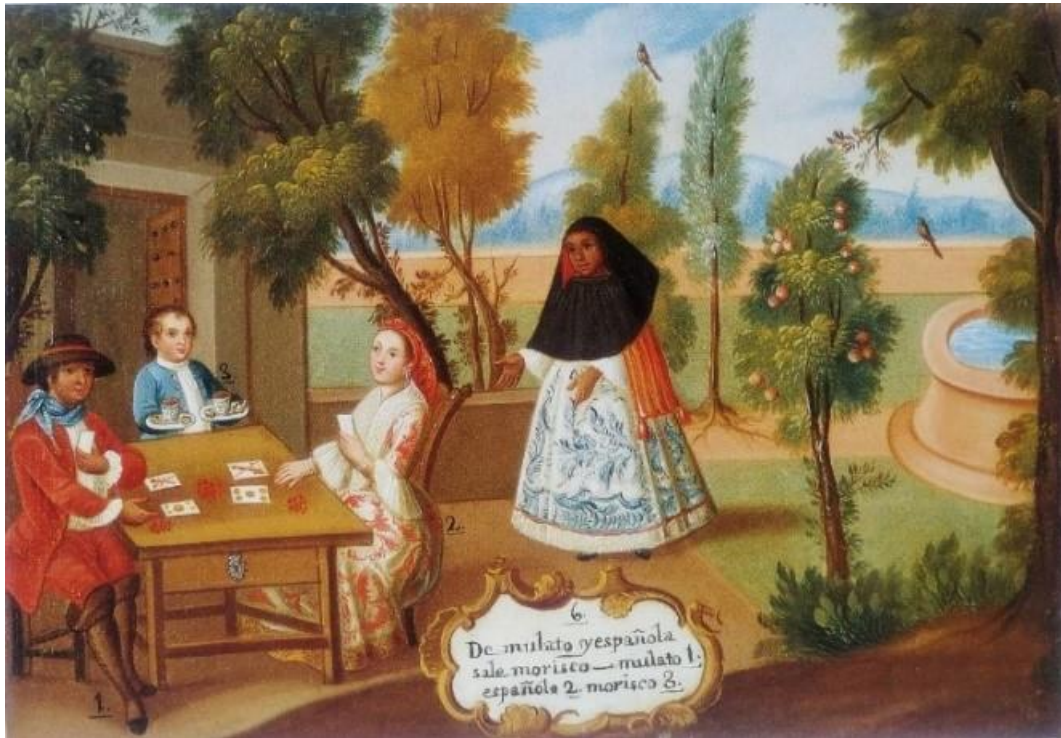
Fig. 9. Anónimo, De mulato y española, sale morisco. Mulato 1. Española 2. Morisco 3. , (c. 1780), óleo sobre lienzo, 38 x 52 cm. Fuente: (Katzew 2004: 130).

compone de un tablero liso y rectangular, “bajo el tablero ligeramente volado se aloja un cajón” 41 con una bocallave metálica con forma de corazón. Estos muebles también pueden estar taraceados “tanto en el tablero como en el frente del cajón” 42 , aunque este no es el caso. 43 Las patas son cuadrangulares sin ninguna ornamentación y la chambrana es de tipo corrido y lisa. “Los bufetes son muebles esenciales de apoyo [...] sirven para escribir, para comer y para otros muchos y diversos usos”. 44