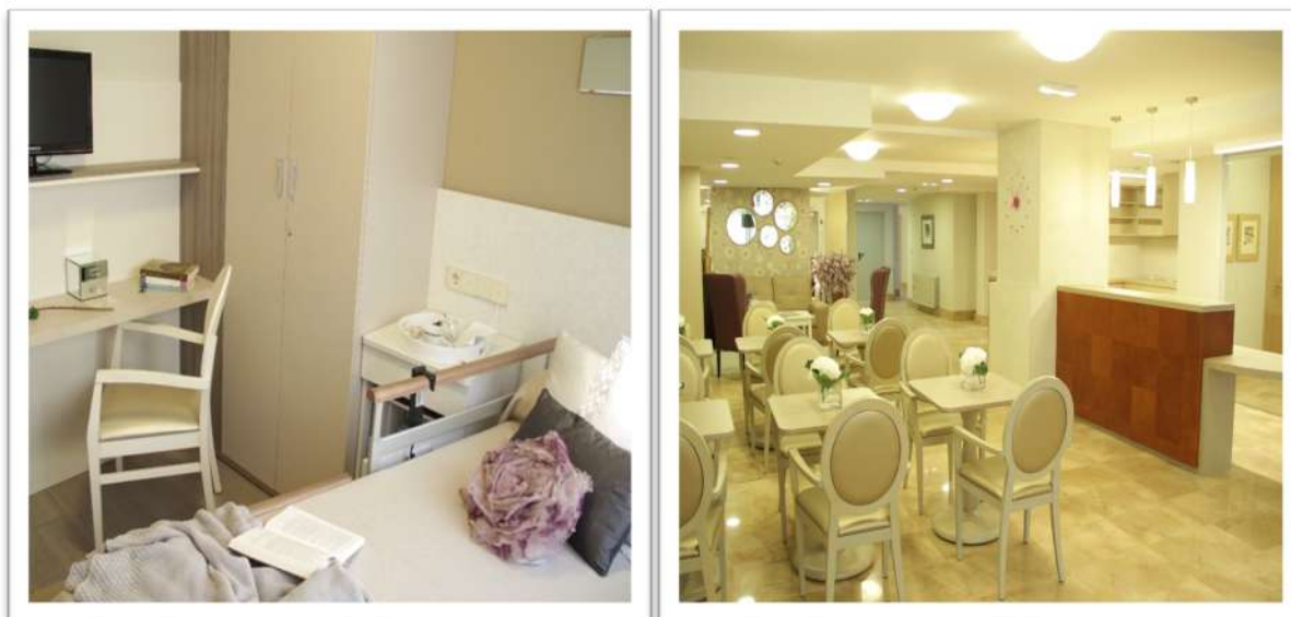
Fig. 6 (pág. 217). Proyecto de apartamento para el Centro Intergeneracional Ovida. Archivo Mamen de la Concha; y Fig. 7 (arriba). Dormitorios y comedor de Residencia El Elíseo en Gijón. Archivo Mamen de la Concha.