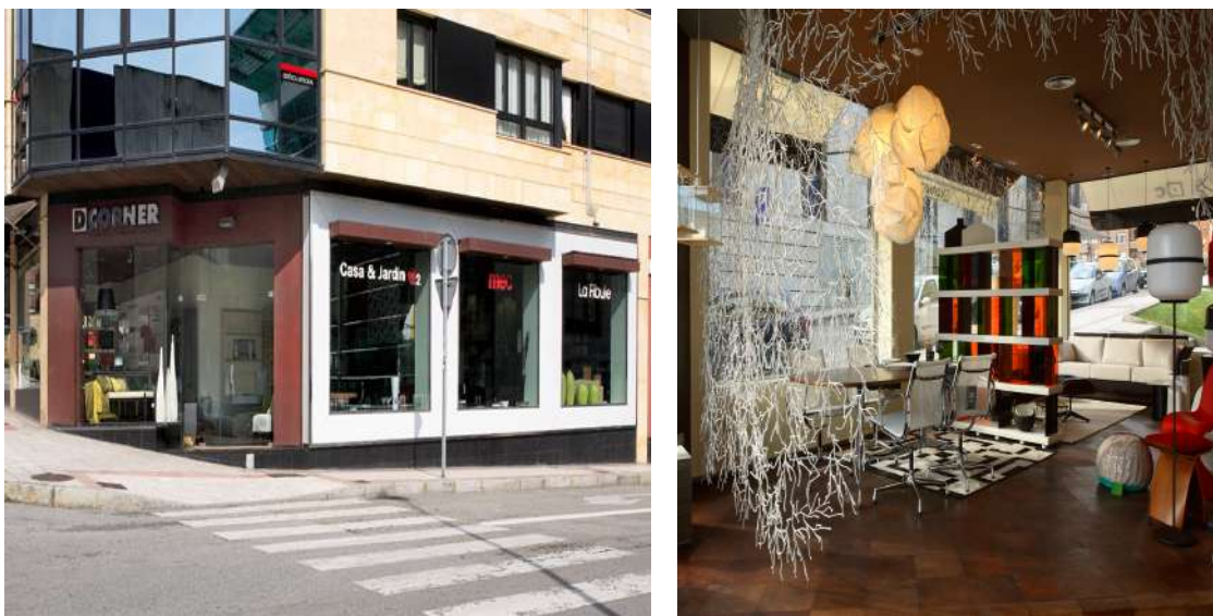
Fig. 4. Fachada en interior del comercio DCorner en Gijón.