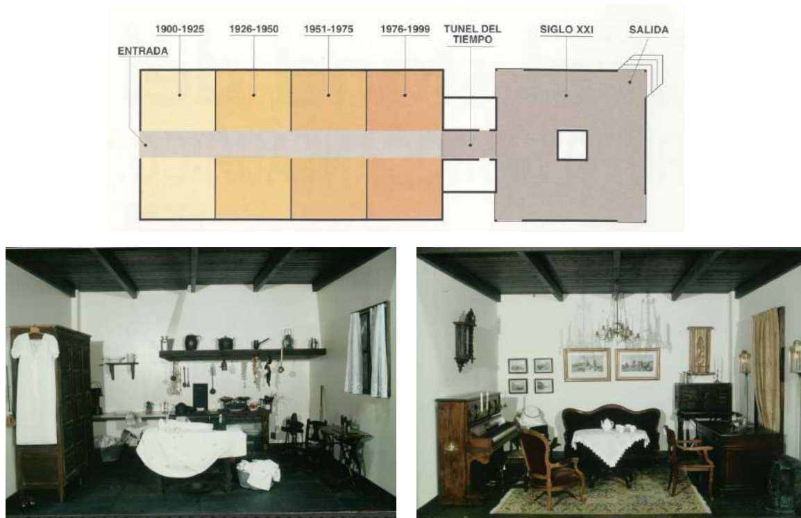
Fig. 3. Organización del stand y algunos ambientes de El túnel del Tiempo en la Feria de Muestras de Asturias en 1999. Detalle de las instalaciones de 1900-25.