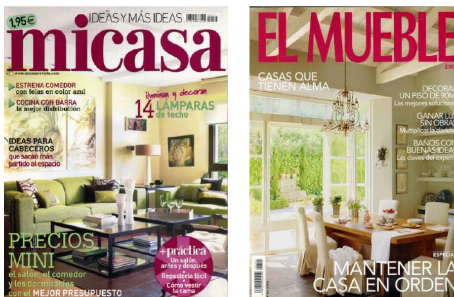
Fig. 5. Portadas de revistas de decoración donde se recogen dos proyectos de interiorismo de vivienda particular. Archivo Mamen de la Concha.

Un buen ejemplo de la actividad decoradora de estos años en vivienda particular es la vivienda Portavilla de 2013, un piso totalmente renovado donde se logró un equilibrio entre los muebles existentes y valorados por los propietarios, que fueron actualizados con otros acabados y tapicerías modernas como polipiel, incorporando elementos de diseño procedentes de DCorner y una nueva redistribución del espacio interior para hacerlo más espacioso. Se lograba así un interior funcional que, con la fusión de estilos, se convertía en un “ambiente elegante, único y muy personal” 41 . Como en otros proyectos suyos, diseñó ciertas piezas de mobiliario, como el mueble de la televisión u otro de madera de cebrano en el comedor, sin tiradores para pasar desapercibido, que servía para alojar la cristalería. Como ha declarado la diseñadora en alguna ocasión hay que aplicar el psicointeriorismo 42 , como una forma de captar el espíritu del cliente, conociendo su forma de vivir el espacio, las relaciones cotidianas con cada pieza y sus expectativas.