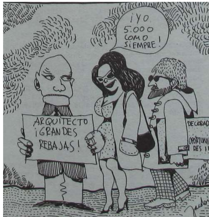
Fig. 1. Ambientes . Revista de interiorismo y decoración del Colegio nacional de decoradores. Año I, nº1 enero-marzo 1981, 49.