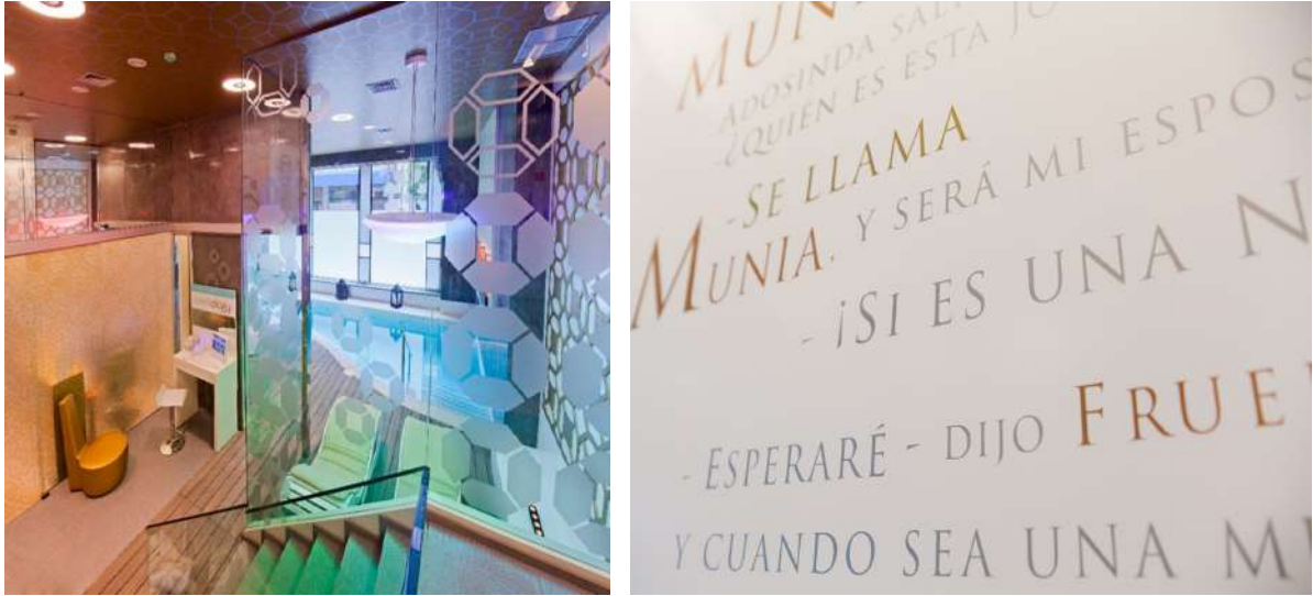
Fig. 8. Interior del Hotel Princesa Munia de Oviedo. Detalles de la decoración mural.

Otras obras de esos años ha sido la sala VIP del tanatorio de Gijón que realizó cuando tenía muy cercano en el tiempo el fallecimiento de un familiar. Eso le hizo reflexionar sobre la experiencia de la muerte y la asepsia de determinados espacios, donde muchas veces se obvia la importancia del momento de duelo y de respeto hacia el difunto. Para ello cerró el patio y lo convirtió en una suerte de capilla ardiente, incorporó una vidriera de Federico Mieres, diseñó una barra para dar servicio a la sala y decoró los muros con frases poéticas y consoladoras. También hizo varios proyectos para la firma Joluvi y su tienda Covadonga Sport en Gijón, el interiorismo de las oficinas de Vaciero en Oviedo, o las oficinas de Limpul y de Nueva Delta.