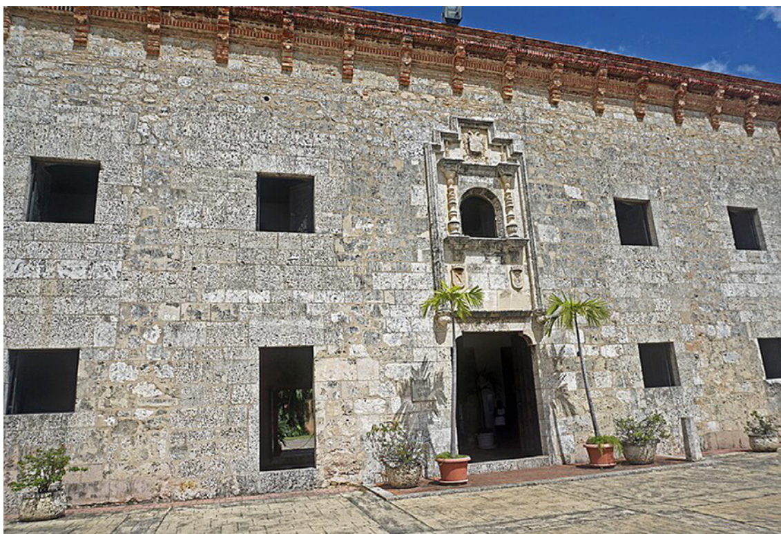
Fig. 2. Antiguo Palacio de la Real Audiencia de Santo Domingo (Museo de las Casas Reales)

que tenía muchos inconvenientes para habitarla, era un buen edificio por lo espacioso y cómodo para la distribución de las distintas salas que necesitaba la Audiencia, Además, el Tribunal Superior solo utilizaba los estrados algunas horas de la mañana por lo que las inclemencias climáticas no serían tantas. Por último, Rivero alegaba que el Palacio de Gobierno había sido sede histórica de los capitanes generales que gobernaron el país en nombre de su majestad hasta el año de 1821. 10