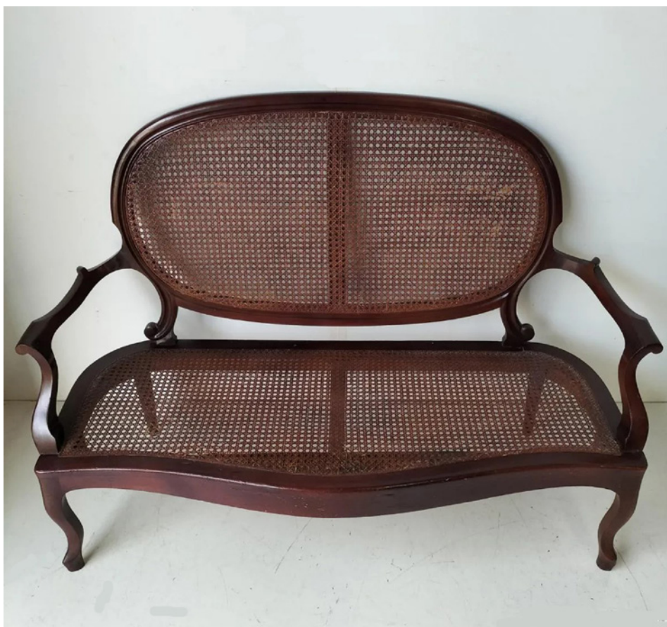
Fig. 7. Sofá. Siglo XIX, Cuba. Caoba y rejilla

Los artesanos locales pronto comenzaron a replicar los estilos ingleses y franceses, pero utilizando técnicas de fabricación y diseño propias, con aportaciones originales que culminarán con el llamado estilo Imperio Cubano, caracterizado por la sencillez, sobriedad y funcionalidad de su diseño. Se identifican por tener las patas sin ornamentación, las delanteras con curvas pronunciadas y las traseras en sable, mientras que los reposabrazos terminan en volutas. Están desprovistos de aplicaciones de bronce y acabados en dorado, manteniendo una apariencia simple y monocromática por la utilización de maderas oscuras. Asimismo, presentan una mayor escala y no poseen los ricos tapizados textiles o de cuero que caracterizan al mueble europeo, sino que se sustituye por la rejilla confeccionada en fibras vegetales lo que favorecía la ventilación y flexibilidad del mueble. La caoba, abundante y resistente a la humedad y las plagas fue la materia prima principal. Este estilo, símbolo de estatus entre la élite criolla, fue el elegido para amueblar el Palacio de Gobierno (fig. 7). 18