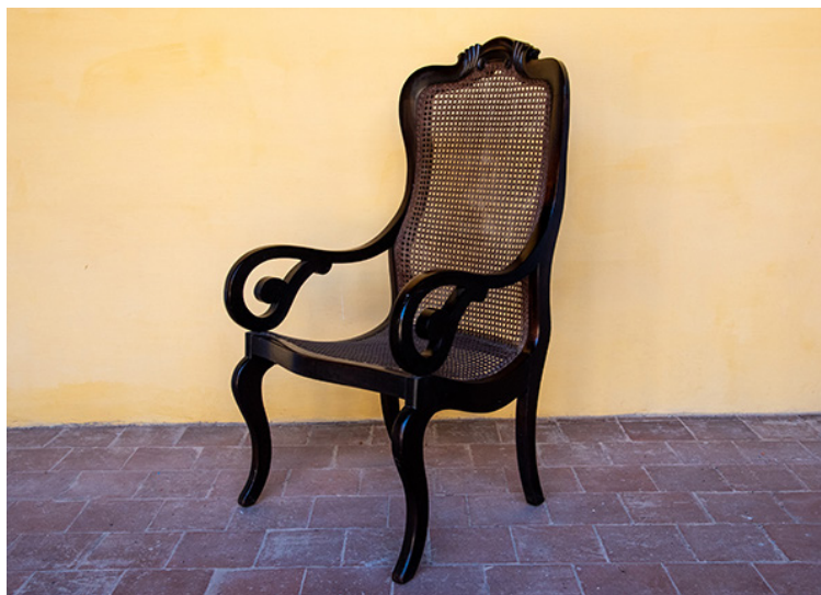
Fig. 6. Butaca. Siglo XIX, Cuba. Caoba y rejilla

El estilo predominante en la poca fue el estilo Imperio europeo, difundido a través de Norteamérica y adaptado a las condiciones climáticas del trópico, comenzando así una gran producción de muebles, principalmente en la Habana, con características bien definidas, tanto en el diseño como en las técnicas de fabricación. Más que un estilo criollo, se trató de una reinterpretación del mueble foráneo. Eran muebles apreciados por su calidad y diseño, y se convirtieron en símbolo de estatus entre las clases privilegiadas de las colonias (fig. 6).