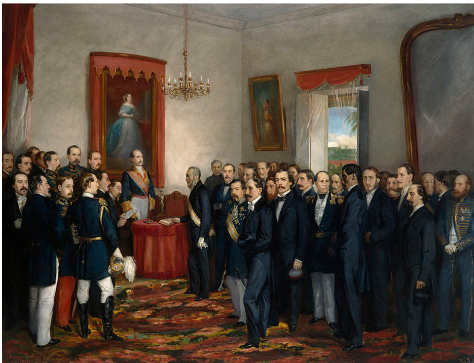
Fig. 4. Jura del Gobernador y Capitán General de Santo Domingo don Pedro Santana . Juan F. Cisneros Guerrero. Museo de la Rioja

Una pintura de Juan F. Cisneros Guerrero, Jura del Gobernador y Capitán General de Santo Domingo don Pedro Santana , fechada en 1862. 17 La escena se desarrolla en una estancia que, aunque rica, no se corresponde con el salón del trono. El suelo está tapizado con una colorida alfombra de motivos florales y donde se aprecia parte del mobiliario compuesto por una mesa forrada con cubierta carmesí, un sillón igualmente tapizado de rojo, una lámpara, un espejo de gran tamaño, algún cuadro y un dosel que cobija el retrato de Isabel II, copia de Madrazo, mobiliario existente antes de la llegada de Rivero (fig. 4).