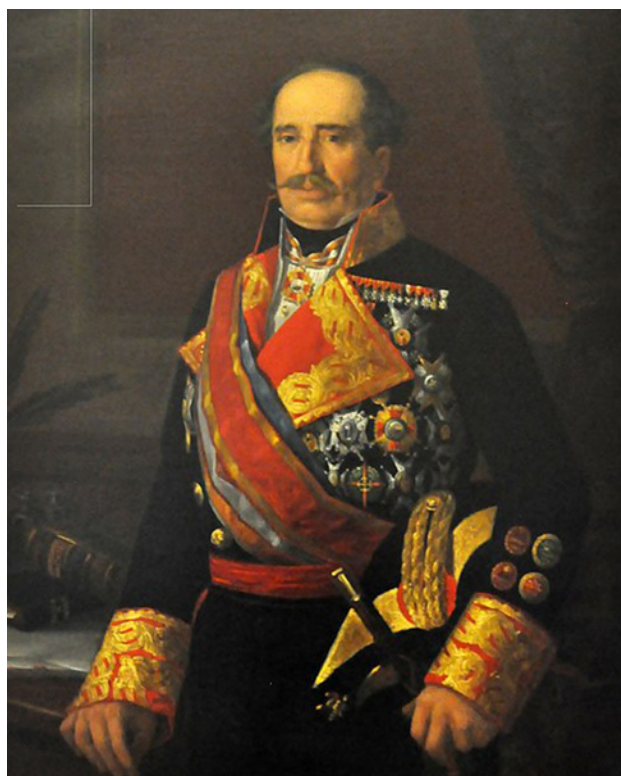
Fig. 1. Felipe Rivero Lemoyne . Anónimo, hacia 1865. Museo del Ejército

La separación definitiva de Haití se produjo en 1844 con la proclamación de la República Dominicana. No obstante, los dominicanos intentaron la adhesión a España en varias ocasiones, pero todas sin éxito. 1 En 1861 el presidente Pedro Santana proclamó solemnemente la reincorporación a la corona española, en busca de una estabilidad en el país, asumiendo provisionalmente el cargo de capitán general. A pesar de que España no tenía mayor interés en la isla, la petición de Santana fue interpretada como el sentir popular de toda la población, hecho que realmente no fue así, por lo que la anexión generó numerosas protestas. Al año siguiente dimitía Santana y fue nombrado capitán general de la isla el español José Felipe Rivero Lemoyne, destacado militar y político, quien ocupó su cargo en un periodo muy breve de tiempo, donde tuvo que afrontar toda una serie de enfrentamientos y una corta y violenta guerra que culminó en 1865, cuando la reina Isabel II derogó el Real Decreto de anexión de 1861. A pesar de ello Rivero Lemoyne intentó por todos los medios mantener el orden y la autoridad, así como implementar reformas administrativas y de infraestructura durante su breve mandato (fig. 1). 2