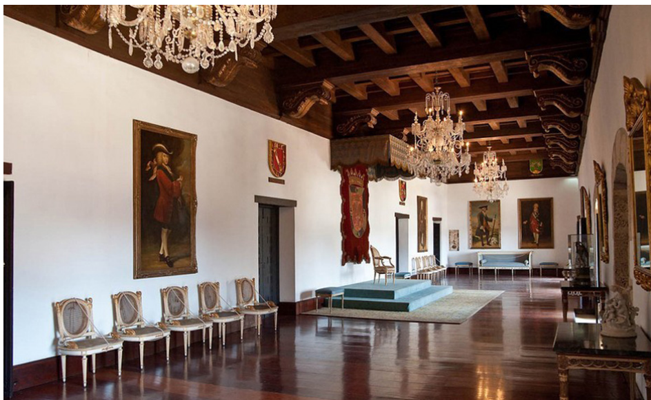
Fig. 5. Museo de las Casas Reales (Antiguo Palacio de la Real Audiencia de Santo Domingo)

medida de las importaciones desde Cuba y la isla de Santo Tomás. La Habana se convirtió en un centro clave de producción de muebles, especialmente de caoba, muy apreciados por su calidad y diseño. Asimismo, la presencia de mobiliario inglés en las colonias españolas de América durante el siglo XIX fue notable, especialmente en contextos urbanos y en áreas donde había un intercambio comercial significativo.