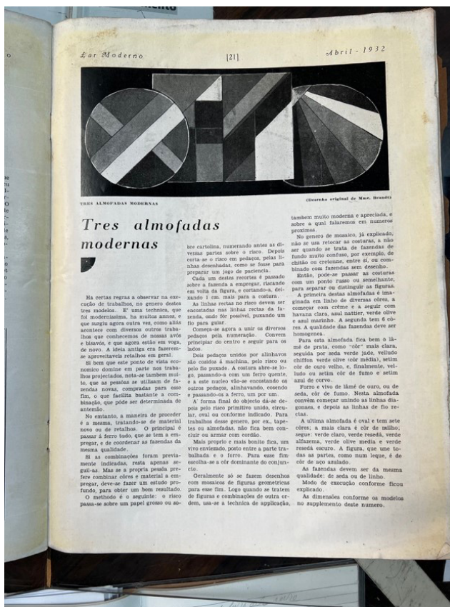
Fig. 6. Revista Lar Moderno , editado por Joana Brandt, edição de abril de 1932, capa e página 21, com “Três almofadas modernas”.