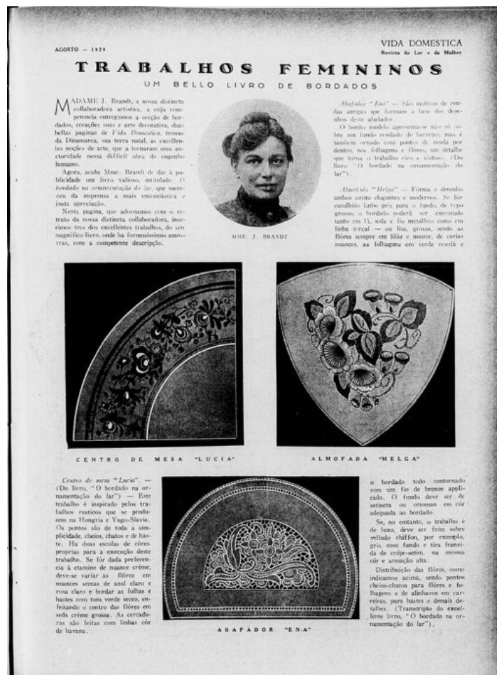
Fig. 5. Imagem da página com a reportagem sobre o livro O Bordado na Ornamentação do Lar, com imagem de três trabalhos que constavam no referido livro e seu retrato. Ao lado, imagem de seu retrato ampliado – revista Vida Doméstica, no. 137, de agosto de 1929.

Na reportagem da revista Vida Doméstica , o livro foi anunciado com o título “Um belo livro de bordados”. Em página inteira expunham-se três fotografias de seus bordados, todos intitulados com nomes de mulheres – centro de mesa Lucia, almofada Helga, abafador Ena – e o seu retrato (fig. 5). A sua imagem, pelo tipo de penteado e vestimenta, deveria ser do início do século XX, quando ainda era jovem. 55