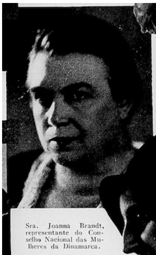
Fig. 7. Imagem de Joanna Brandt na reportagem sobre o II Congresso Internacional Feminista, ocorrido no Rio de Janeiro – O 2º Congresso. Vida Doméstica , Rio de Janeiro, no.161, Ago., 1931, 55.

E para além da sua atuação como artista-decoradora, também aderiu a eventos sobre emancipações femininas, como no Congresso Internacional Feminista, quando representou a Dinamarca. Em reportagem na Vida Doméstica , sobre o II Congresso de 1931, seu rosto é retratado (fig. 7) entre outras delegadas. Da sua imagem veiculada na reportagem do lançamento de seu livro, é notável que os anos se passaram, mas seu olhar não é nada passivo. Tem força de quem sabe o seu papel no mundo.