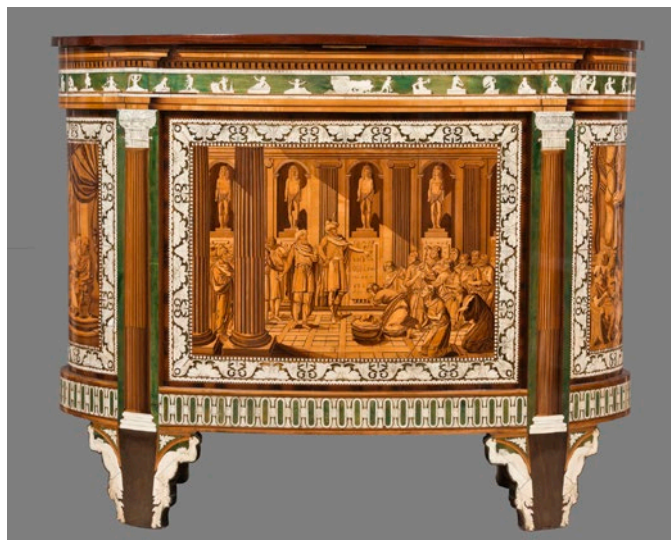
Fig. 2. Cómoda-tocador. Vista de la parte trasera.

El mueble está sostenido por cuatro pies decorado con atlantes realizados en hueso grabado, material empleado junto con madera teñida para el zócalo, los espacios donde se insertan las columnas, las cenefas con motivos florales que perfilan las escenas y el friso superior. Este último se articula en un entablamento con escenas de putti donde se representan las artes y distintos trabajos y bajo una cornisa con gotas realizadas en marquetería. Estos motivos decorativos, tal como apuntó González-Palacios, 27 beben de repertorios como aquel titulado Ornamenti Diversi Inventati Disegnati ed eseguiti Da Giocondo Albertolli , 28 publicado en 1782 por este profesor “ d’Ornati ” de la Real Academia de Bellas Artes de Milán; en este repertorio, Albertolli incluyó los diseños que habían sido realizados en estuco “ nelle grandiose Fabbriche de’ nostri Reali Arciduchi ” por orden de Giuseppe Piermarini, primer arquitecto de S.M. Imperial en la Lombardía y profesor de Arquitectura en la citada Real Academia milanesa. Así, se observa cómo el motivo de hojas de acanto que perfila cada una de las escenas copia el motivo C de la lámina que recoge la “ Dimostrazione in grande de’ profili delle Cornici co’ suoi ornati del Gabinetto famigliare ”. Sin duda fue muy sencillo para Abbiati acceder a este repertorio pues, tal como se indica en la propia publicación, se vendía en Milán por el mismo Albertolli (fig. 3).