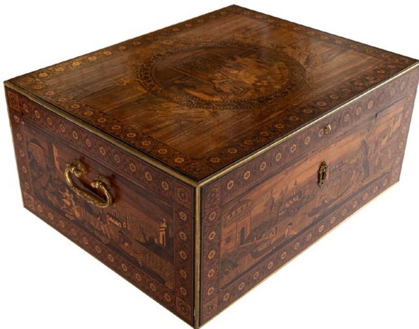
Fig. 8. Arqueta. Vista oblicua.

La pieza, en forma de prisma rectangular, 33 presenta todos sus frentes decorados con distintas escenas de marquetería enmarcadas por cenefas ornadas con flores y realizadas en maderas de caoba, palosanto, ébano y limoncillo. El interior, recubierto de palo rosa, incluye cuatro sencillos compartimentos perfilados con ébano, mientras que en la tapa dos cartelas rectangulares muestran escenas cinegéticas y flanquean un jarrón con flores que conserva parte del colorido original. El bronce dorado aparece de forma tímida, perfilando los cantos de la caja y ganando presencia en la bocallave y, sobre todo, en los asideros (figs. 8 y 9).