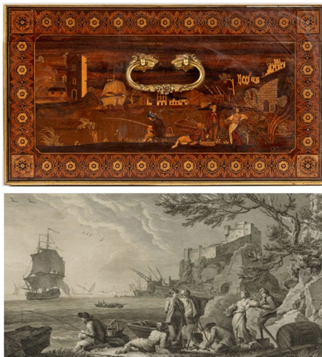
Fig. 10. Arqueta. Comparativa: en la imagen superior, vista del lateral derecho; en la imagen inferior, detalle de la 2. e Vue des Environs de Bayonne por Jean-Jacques Leveau.

des environs de Bayonne , por Jean-Jacques Leveau entre 1750-1785 y hacia 1775 respectivamente. Finalmente, la parte posterior copia la 2. me Vue du Marseille , grabada igualmente por Aliamet hacia 1776. Al igual hizo Mariano Sánchez en sus pinturas, el ebanista autor de esta arqueta tampoco tomó literalmente las escenas completas, sino las figuras principales y algunas arquitecturas, siendo estas las que restan realismo por lo fallido en el empleo de la perspectiva (fig. 10).