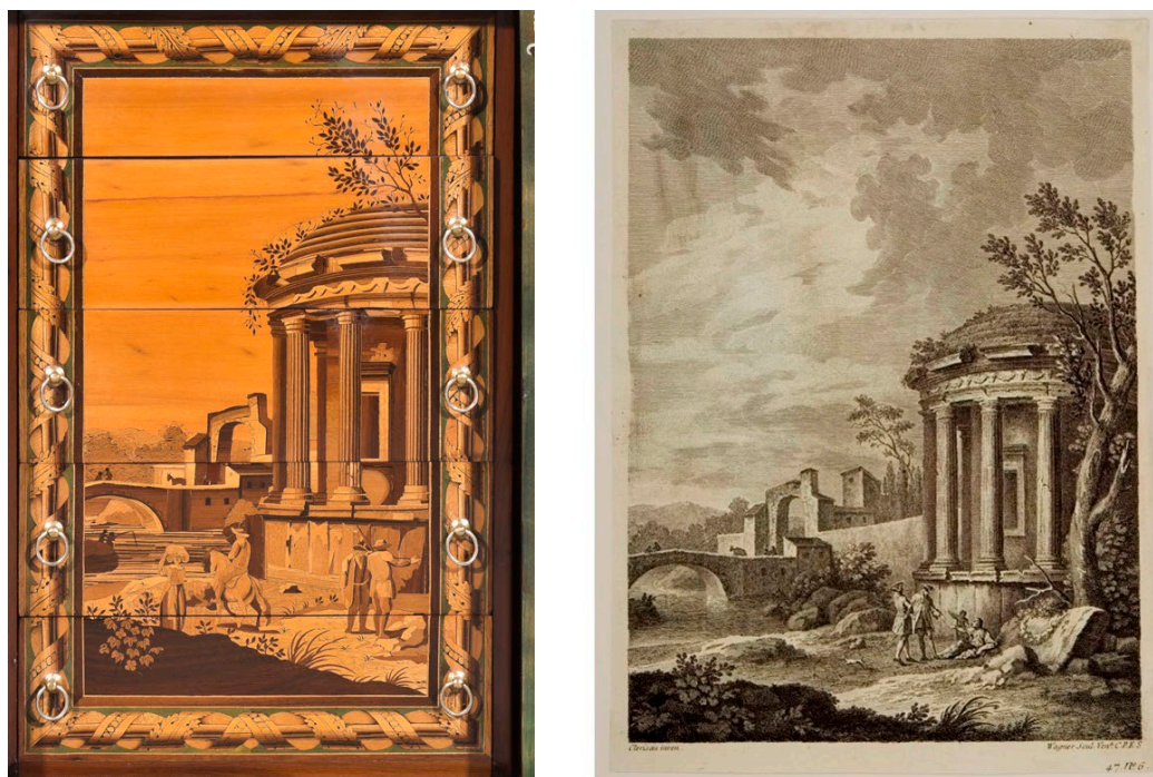
Fig. 6. Cómoda-tocador. Comparativa: en la imagen izquierda, detalle de uno de los módulos laterales; en la imagen derecha, Paisaje con templo, grabado por Wagner según dibujo de Clérisseau.

La decoración de la parte posterior del módulo compañero presenta una escena que copia el grabado de divertido título A chi nol cura amor fa festa un cane E l'uomo insidia a chi gli da del pane , capricho de carácter veneciano ideado por Giuseppe Zais (1709-1784) y grabado, al igual que el anterior, por Wagner. En cuanto a la parte anterior, los cajones muestran otra escena de capricho, mientras que en la persiana se representa una fuente donde un hombre sopla un cuerno recostado en un caballo marino.