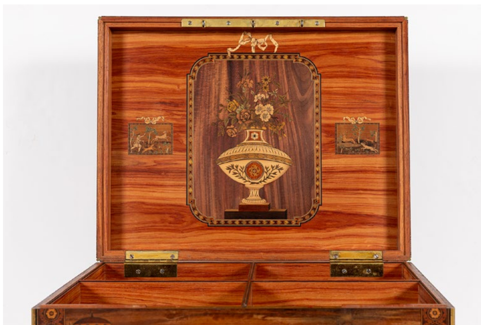
Fig. 9. Arqueta. Vista del interior.