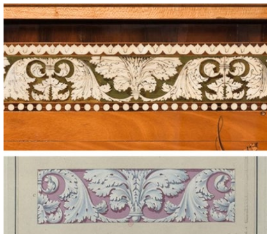
Fig. 3. Cómoda-tocador. Comparativa; en la imagen superior, detalle de una de las molduras de la cómoda-tocador; en la imagen inferior, detalle de uno de los grabados del repertorio de Albertolli.

del Volto eseguito a Stucco in una delle Sale di Compagnia della R. Villa di Monza”.