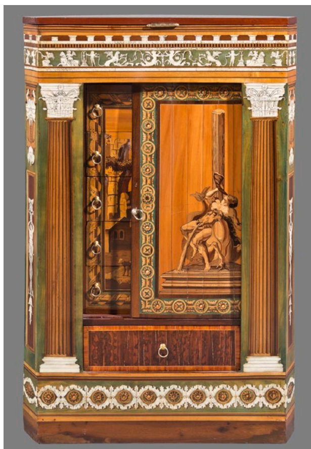
Fig. 5. Cómoda-tocador. Vista frontal de uno de los módulos móviles.

Los dos módulos laterales tienen planta semicircular con ángulos en bisel, y ambos muestran una estructura pareja: tanto la parte posterior como la anterior incluyen un entablamento cuyo friso se ornamenta con grutescos en hueso sobre madera teñida y que está sustentado por sendas columnas de orden corintio apoyadas un zócalo ornado de flores que dan ritmo a la composición. Cada módulo está dotado de un compartimento superior con sencilla tapadera, y de un conjunto de seis cajones en el frontal, cinco de los cuales presentan una cubierta a modo de persiana que se abre hacia el lateral. Tanto la parte posterior, como el grupo de cinco cajones, además de la persiana que los cubre, están decorados con escenas de capricci que reflejan tanto la exquisita técnica del ebanista como el gusto del momento por la antigüedad clásica (fig. 5).