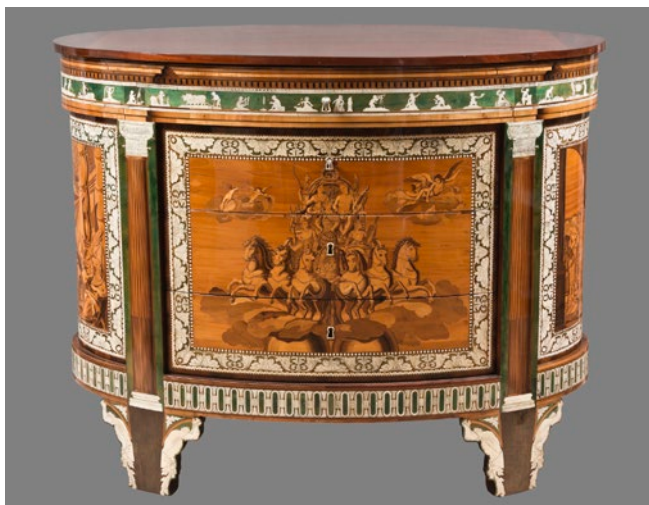
Fig. 1. Cómoda-tocador. Vista de la parte frontal.

que este escritorio haya sido realizado por Abbiati, pues, aunque presenta analogías estilísticas con el mobiliario lombardo, sus características técnicas poco tienen que ver con las del ebanista milanés (fig. 1).