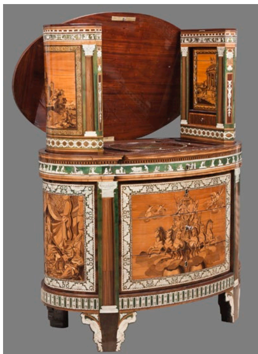
Fig. 4. Cómoda-tocador. Vista lateral.

Son tres los cajones que ocupan la práctica totalidad del mueble. Sin embargo, para los espacios que la planta oval genera en los laterales y la parte posterior se crearon tres módulos independientes ocultos que se deslizaban hacia arriba al accionar un sistema mecánico hoy inexistente, pero del que quedan señales, como los espacios que ocupaban los botones encargados de accionar los engranajes cuyo funcionamiento habría sido, cuanto menos, sorprendente de ver. Tampoco se ha conservado el módulo central, que probablemente estaría dotado de un espejo e igualmente decorado con marquetería (fig. 4).