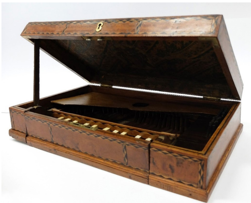
Fig. 4. Frente, 45° à direita do manicórdio com apoio depois do tratamento.