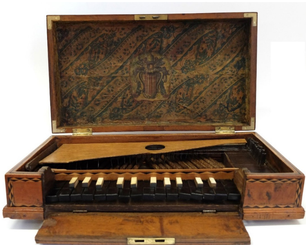
Fig. 3. Frente do manicórdio depois do tratamento.