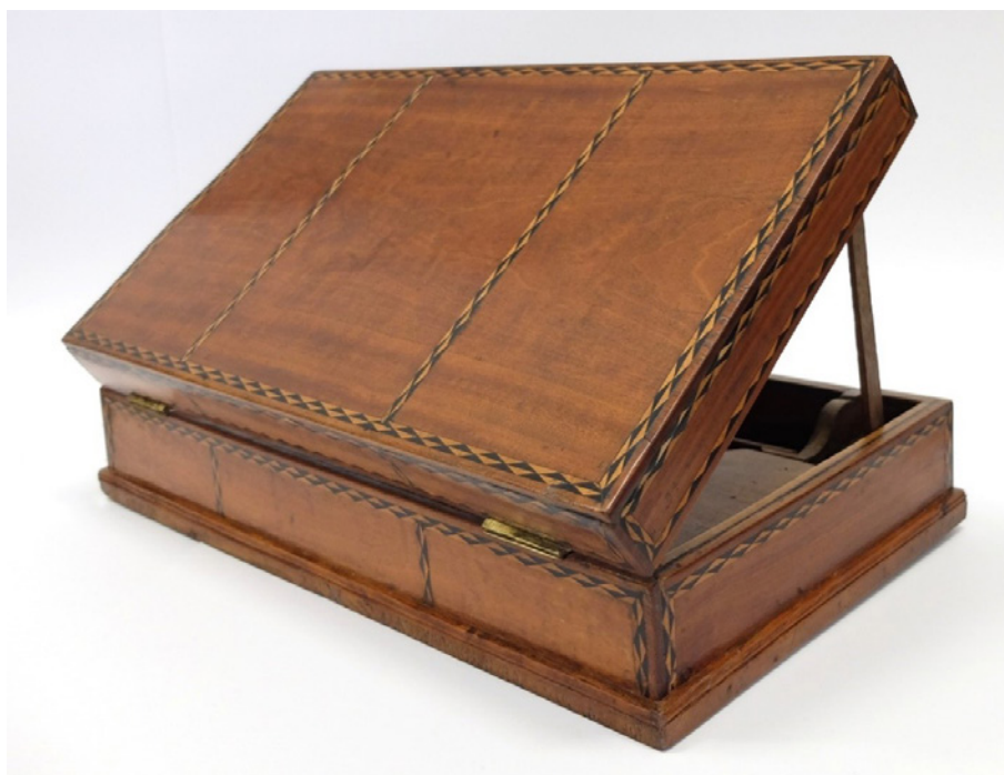
Fig. 5. Costas do manicórdio aberto com o apoio depois do tratamento.

A relação entre falsificação e autenticidade torna-se, assim, paradoxal. O objeto é falso enquanto recriação renascentista, mas autêntico enquanto produto do século XIX. Segundo Cesare Brandi 10 , o valor de um bem cultural reside na sua historicidade a acumulação de transformações ao longo do tempo e, portanto, os elementos apócrifos fazem parte da biografia do objeto. Eliminar as marcas da falsificação seria apagar a sua verdade histórica.