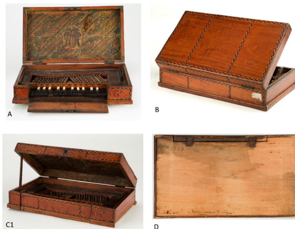
Fig. 1. A) Frente do manicórdio; B) Costas do manicórdio aberto com o apoio; C) Frente, 45° à direita do manicórdio com o apoio; D) Fundo do manicórdio.