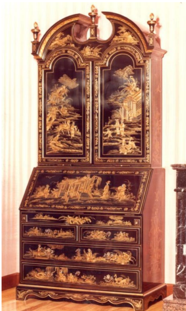
Fig. 10. Dibujo del modelo de mobiliario del Banco de España.

de entrega. Además de mobiliario nuevo también se plantea la restauración de dos mesas para máquinas de escribir y otra para acoplar las máquinas inutilizables, un trabajo presupuestado por Loscertales en 440.200 pesetas. El total de las cuantías aún debe ser revisado para comprender su alcance, aunque cabe señalar que se extendió otro presupuesto cerrado de 437.000 pesetas, y que tan solo el mobiliario de la sala de visitas conjunta del interventor y el cajero ascendió a un coste de 250.800 pesetas.