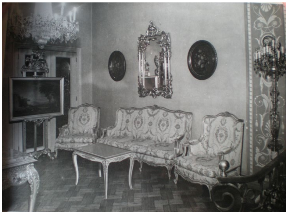
Fig. 6. Sillón Luis XVI, modelo del catálogo no. 3558.