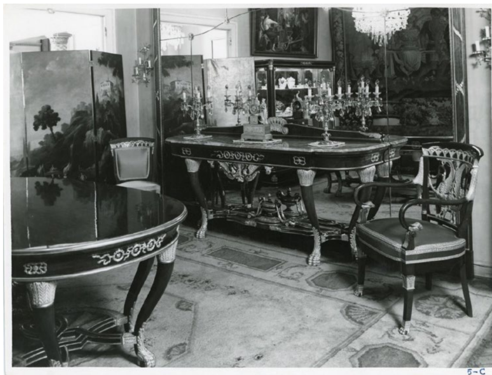
Fig. 9. Cartel publicitario para exposición en la galería Sloane.

Loscertales también comienza a figurar en galerías de firmas internacionales como Sloane en Washington D.C., que, en el año 1967, abre una nueva sucursal de venta al público. Tal y como se relata en el diario The Evening Star , el presidente de la compañía, Leonard Jacobs, acompañado por la marquesa Mary del Val, esposa del embajador español, alabaron la manufactura de mobiliario aragonesa, tanto en cuanto a su calidad como a la cantidad de piezas exportadas. En la noticia se destaca su gran popularidad en la capital estadounidense y el éxito de ventas en esta apertura (fig. 9), con unos veinticuatro ejemplares de mueble clásico vendidos a pesar de que “un armario cuesta tanto como un coche.” 38