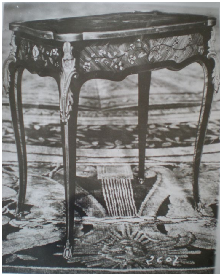
Fig. 7. Comedor estilo Imperio, modelo del catálogo no. 5-C.

Las mesitas circulares con balaustres circundando el mármol del tablero inspiradas en el mobiliario de Fontainebleau y del Château Malmaison de estilo Imperio napoleónico –de gusto neoclásico destacado por la limpieza en la ejecución de las líneas compositivas y la aversión hacia el horror vacui – fueron reinterpretadas por la firma en varias versiones sin perder la elegancia natural de sus formas (fig. 7).