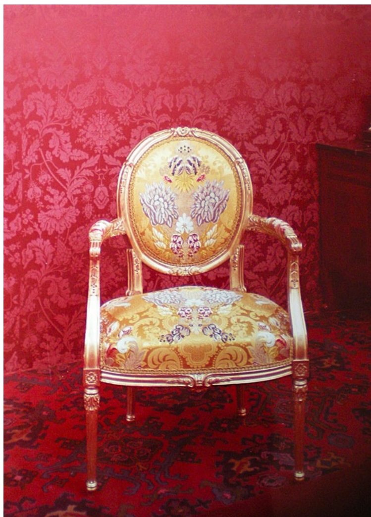
Fig. 8. Mueble-joya canterano lacado estilo Chippendale de Loscertales.

Los delineantes de la sección de dibujantes diseñaban sus proyectos pintados a la acuarela y con detalles policromos sobre tableros utilizados para exponer los posibles modelos al cliente. La fábrica contaba con una biblioteca de consulta sobre mobiliario de diversos países para solucionar cualquier problema formal de un estilo que se deseara producir. Una vez elegidos los prototipos, se trasladaban a escala natural (1:1) en unos rollos de papel cuadriculados para trazar las matrices de perfiles y referencias técnicas, y en cuyos extremos figuraba la numeración correspondiente a dicho modelo. Posteriormente comenzaba la labor de patronaje. Numerosas plantillas, colgadas en orden con su numeración correspondiente, servían para dar una forma totalmente simétrica a los grandes troncos de maderas nobles –ébano, palo santo, palo rosa, roble o nogal– que se utilizaban como materia prima en su producción.