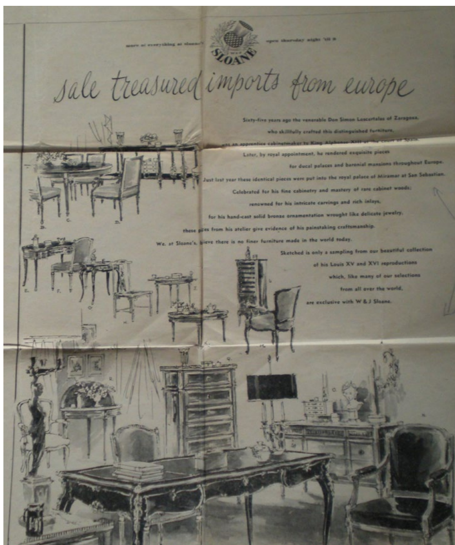
Fig. 4. Modelo de tresillo Luis XV de Loscertales.

Las reproducciones de mobiliario Luis XV tuvieron gran difusión y éxito en ventas. Butacas, sillones, sofás, cómodas, mesitas auxiliares y consolas de perfiles sinuosos se diseñaron sin olvidar el uso del bronce en sus patas cabriolé, tiradores y contracurvas, remarcando las formas más significativas de la pieza con eficaz precisión y fidelidad a los patrones del siglo XVIII. Entre sus reinterpretaciones más exitosas debemos incluir la cómoda del ebanista rococó Antoine-Robert Gaudreaus (1680-1746) para el Cabinet Intérieur de la Dauphine (Palacio de Versalles), 29 los sillones y sofás con tapicerías de la manufacture de tapisserie de Beauvais en tiempos de la dirección de Jean Baptiste Oudry (1686-1755), y la influencia de los diseños de Charles Cressent (1685-1768) (fig. 4). 30