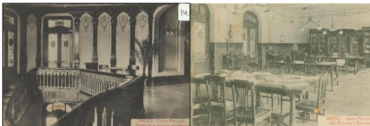
Fig. 4. Vista de la escalera de honor y el vestíbulo del piso principal (a la izquierda) y de la biblioteca del piso del entresuelo (a la derecha), hacia 1920. Tarjeta Postal.