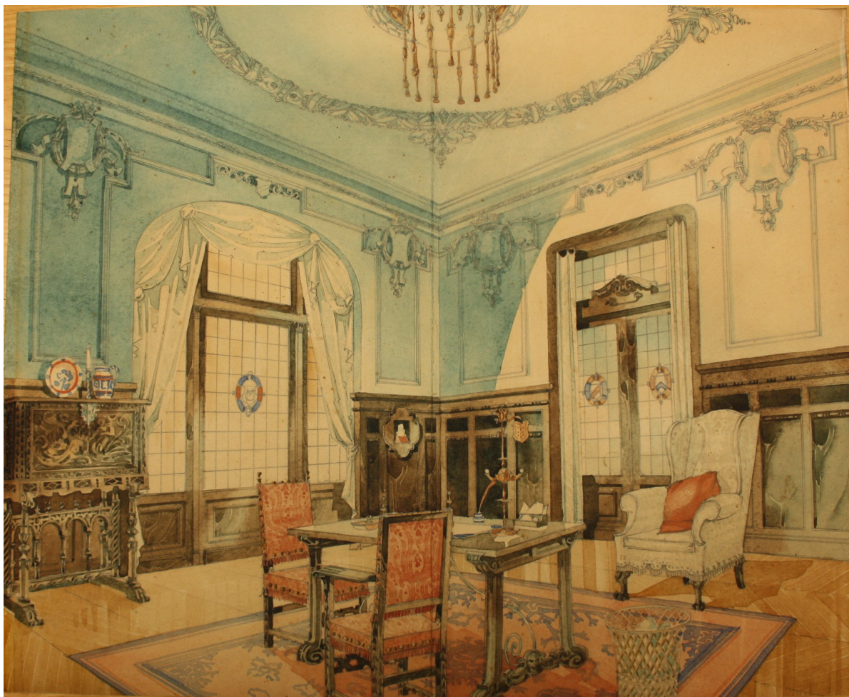
Fig. 5. Diseño en papel y acuarela para el amueblamiento y decoración de una de las salas del Centro Mercantil realizado hacia 1917.

Fue el salón de recreo, lugar de reunión de los socios y sus familiares en determinados actos de la sociedad, donde se concentró el más esmerado y rico amueblamiento que seguía el estilo Luis XVI empleado en toda la decoración, y que debido al carácter elegante y refinado fue habitual en los salones, y lugares de actos públicos. Se diseñó una mesa de comedor inspirada en el barroco francés con trabajos de talla y dorados que se localizaban en el centro de la sala y a su alrededor 34 sillas a juego. Junto a esta estancia, en la sala de descanso contigua, se localizaron dos sillones de 0,80 metros de ancho y cinco sofás de 1,5 metros de ancho, inspirados en el estilo de los luis galos que se doraron en consonancia con la decoración escultórica de las paredes y los techos por el pintor decorador Francisco Suárez con un coste de 6.200 pesetas 28 .