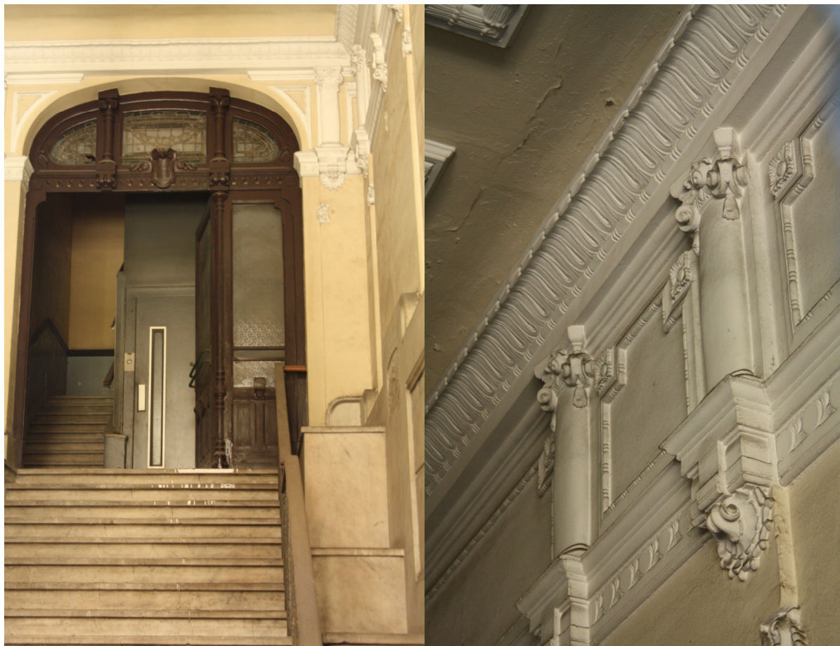
Fig. 3. Vista actual del portal con la puerta, la decoración escultórica y el revestimiento marmóreo original.

En el resto de dependencias del servicio, los cuartos de baño, cocina y cuartos de efecto, departamento telefónico, despacho de la cantina, peluquería y gimnasio localizados en el piso de entresuelo y el sótano primaba la funcionalidad. Sus espacios se adecuaron con azulejería blanca y cenefas de color procedentes de Bélgica y de Castellón, sencilla pintura al óleo en las paredes y techos y pavimentos de mosaico hidráulico de colores lisos y motivos geométricos, -empleados en los interiores modernistas y eclécticos de la época en todas las ciudades-, que se encargaron a la casa “E. F. Escofet” de Barcelona escogiendo los diseños nº 60, nº 72, nº 328, nº349 y nº 410 de sus catálogos nº 7 y nº 9 publicados entre 1912 y 191622.