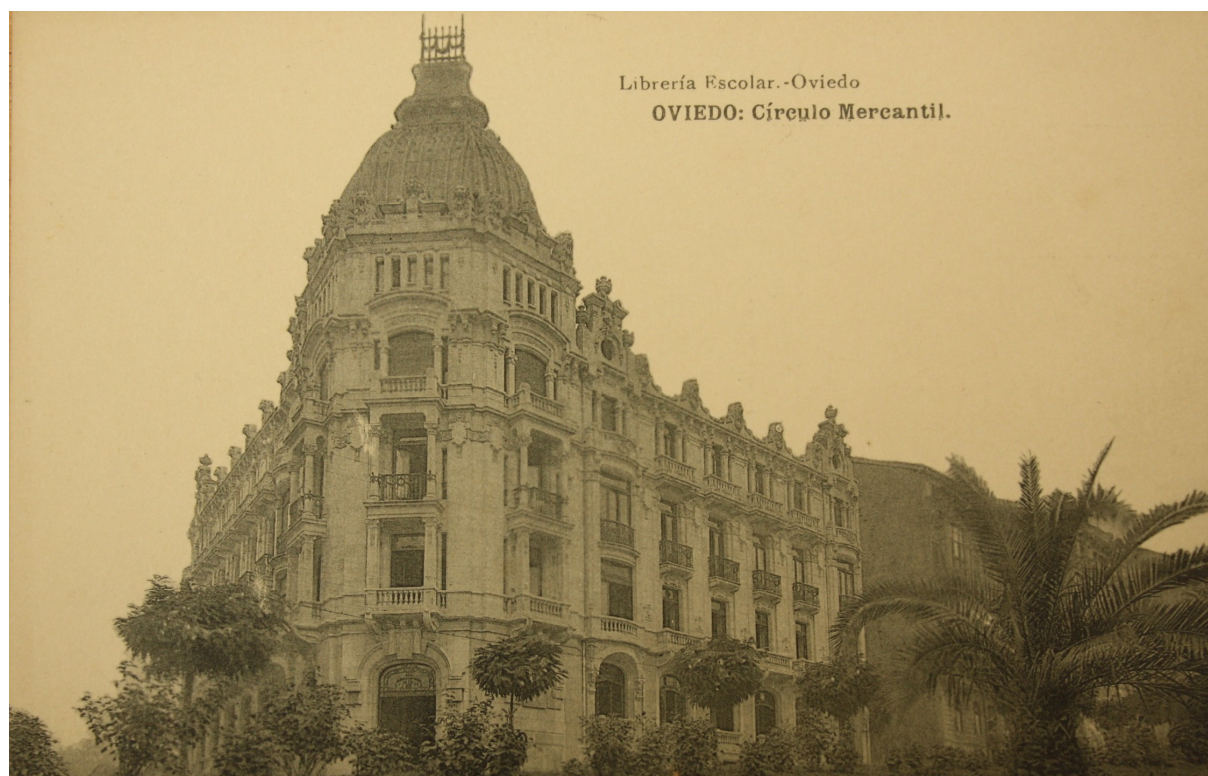
Fig. 1. Tarjeta postal del Centro Mercantil de Oviedo, hacia 1920.

Para el Centro Mercantil se diseñó un edificio de planta regular y levantado en esquina, cuya posición permitía su visión desde diversos puntos de zona. Presentaba, por tanto, dos fachadas proyectadas hacia las calles Marqués de Santa Cruz y Cabo Noval, chaflán en el ángulo y patio interior. Tenía seis plantas de las cuales, el sótano, el entresuelo y la planta principal estaban reservadas al centro recreativo de la sociedad. Sobre ellas, se disponían dos pisos superiores destinados a viviendas de alquiler, con acceso independiente al centro de recreo, y un bajocubierta en el cuerpo central del chaflán para uso residencial del portero.