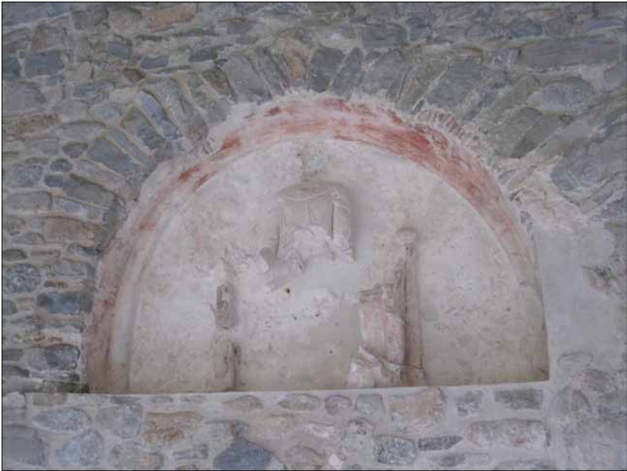
Fig. 3 - Santa María de Ripoll (Gerona). Virgen del claustro.

yeserías que cubren sus muros y que se datan entre la primera mitad y el tercer cuarto del siglo XIII 12 . El uso originario de este espacio, también debiera ser revisado y no en función de los condicionamientos regioes que han marcado toda la historiografía dedicada al monasterio burgalés. Uno de los problemas que siempre ha acarreado la construcción e interpretación espacial de Las Huelgas es que se ha realizado subordinada al legendario de su fundación. De este modo, si las décadas más tempranas de su historia son especialmente oscuras, no tenemos elementos de juicio sólidos para plantear el calibre de la