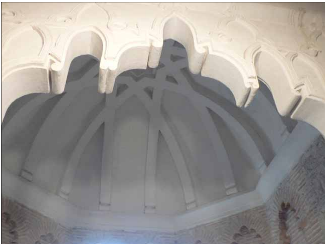
Fig. 2 - Santa María la Real de Las Huelgas. Capilla de la Asunción. Arco de entrada y bóveda.

En Las Huelgas, si las Claustrellas hubieran sido estructuras procedentes de un entorno palaciego real, la relación topográfica entre la capilla de la Asunción y el patio habría sido muy distinta, según se deduce de su comparación con los palacios islámicos con su qubba correspondiente. Como demuestran los ejemplos musulmanes contemporáneos que propone Juan Carlos Ruiz, la capilla se habría localizado en el centro de una de las galerías claustrales y no desplazada a uno de sus rincones, como se construyó realmente 10 .