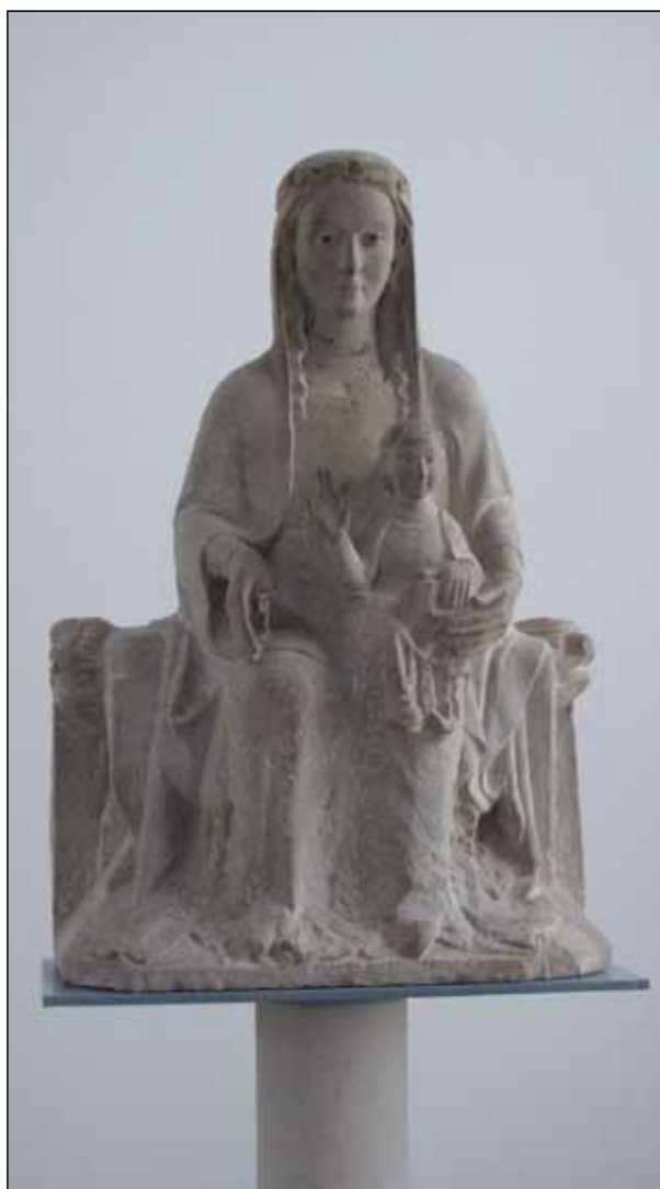
Fig. 4 - Santa María de Vallbona de les Monges (Lérida). Virgen del claustro.

vecindad de la enfermería con la que llegaron hasta a compartir capilla, creo que no hay ningún problema en vincular las Claustrellas y su lujosa arquitectura y escultura a la figura de la abadesa y su palacio, precisamente en unas fechas -el período charnela entre los siglos XII y XIII- en las que su poder como cabeza de la orden y su más o menos continua pertenencia a la aristocracia castellana se estaban asentando 16 . Mientras, el proyecto de la monumental nueva iglesia continuaba su camino en paralelo con las obras del resto del conjunto monástico, dependientes de los vaivenes económicos y voluntades particulares de los representantes de la corona castellana, al fin y al cabo patronos y responsables de un templo que nacía con la intención de convertirse en gran cementerio de un buen número de miembros de su linaje 17 . ¿Estaríamos aquí por tanto ante dos proyectos en paralelo promovidos desde dos instituciones diferentes? La iglesia y núcleo principal del monasterio dependió de la casa real y de ahí los paros y nuevos impulsos en su fábrica. Mientras, la construcción del entorno del palacio abacial y circunstancial alojamiento de la comunidad dependería económicamente de la voluntad de las propias monjas y de una abadesa que, por intención de los fundadores, había pasado a convertirse en la máxima dignataria de la rama femenina del Císter en Castilla. En este marco de residencia para abadesas-infantas y para abadesas aristócratas debe entenderse