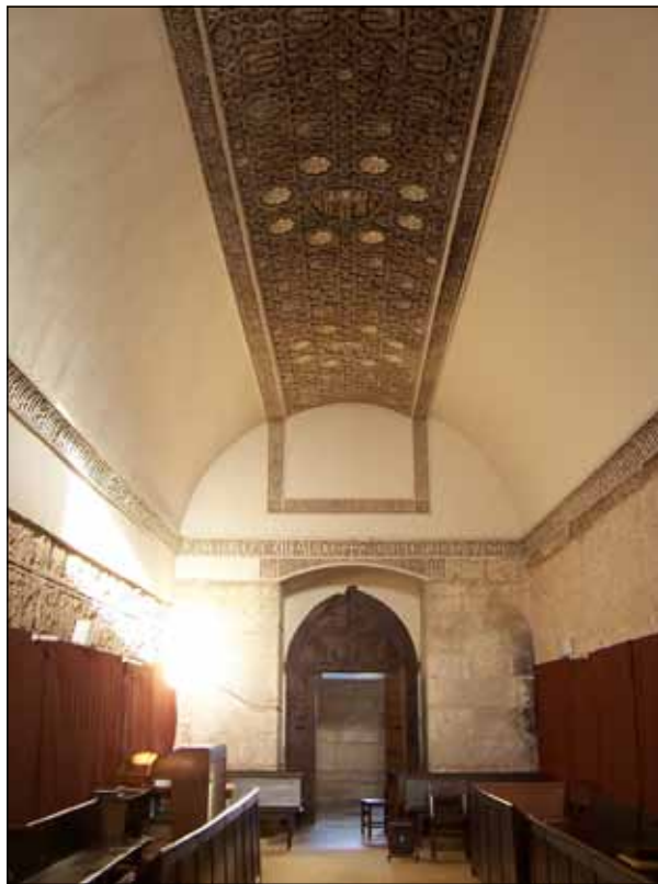
Fig. 6 - Santa María la Real de Las Huelgas. Locutorio, visto desde el Este.

Lamentablemente, nada resta de esta zona en Bujedo. Por último y en consonancia con este renovado culto mariano en el monacato benedictino de mediados del siglo XII, precisamente en estas décadas comienzan a documentarse las imágenes claustrales dedicadas a la Virgen. Además de los consabidos capiteles figurados, todo claustro fue decorado con imágenes en sus muros perimetrales y en los machones angulares, que pudieron ser tanto esculpidas como pintadas. Las vírgenes de claustro formaron parte de estos programas iconográficos. Siendo el punto de llegada de las procesiones marianas generalizadas desde este siglo XII, dichas imágenes comenzaron a convertirse en una pieza de culto habitual que se extendió también a catedrales y otros órdenes 28 . Su progresiva importancia –pensemos en el crecimiento de procesiones a la Virgen con la consolidación de sus festividades más importantes: Natividad, Asunción, Anunciación, Inmaculada Concepción, misas marianas propias, etc.–, en ocasiones terminó generando capillas propias y dotaciones privadas por parte de abades o protectores de cada institución, sitas en los ángulos del perímetro claustral y en donde se realizaban las estaciones procesionales. Las capillas del claustro de San Fernando