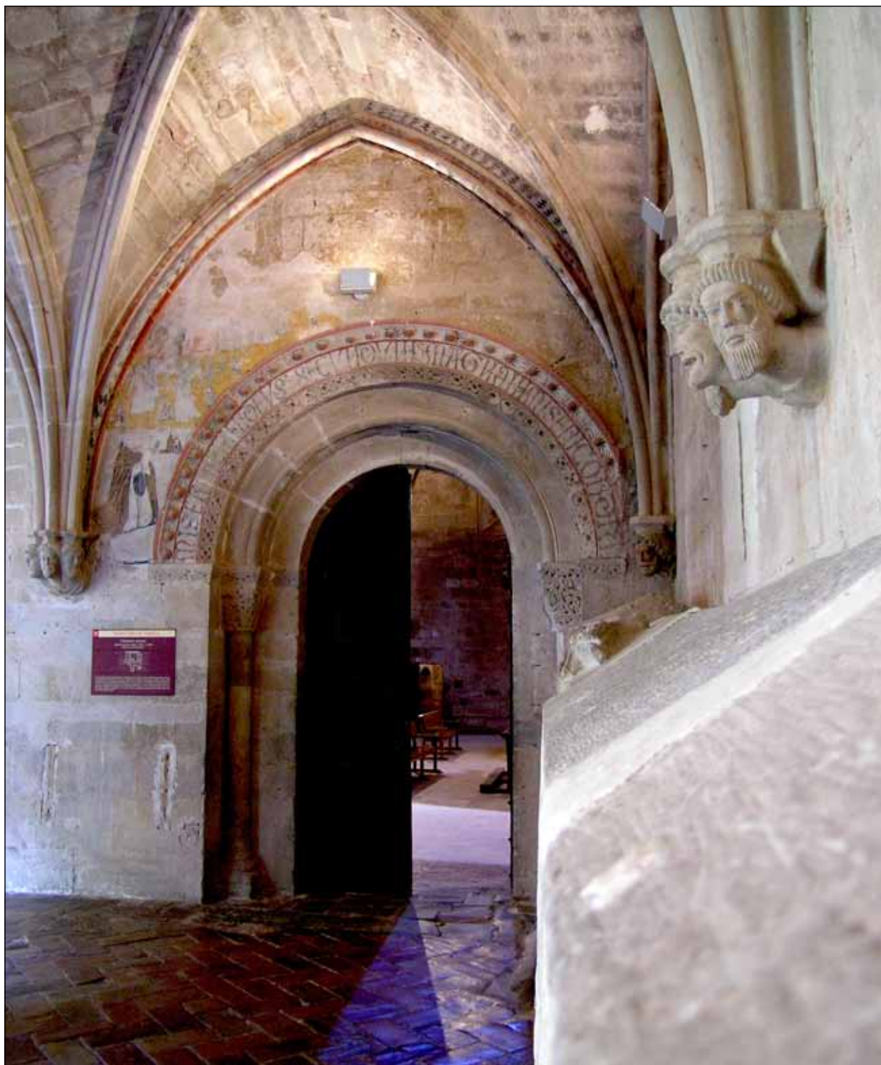
Fig. 7 - Santa María de Veruela (Zaragoza). Puerta de entrada a la iglesia desde el ángulo noreste del claustro.