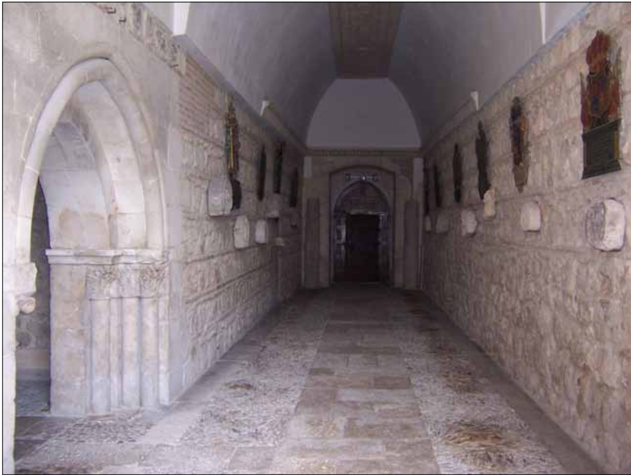
Fig. 5 - Santa María la Real de Las Huelgas. Paso a las Claustrillas, visto desde el Este.

monasterios, esta ‘topografía compleja’ pervivió mejor en las clausuras, descrita en ordinarios y otros libros litúrgicos. En este contexto, los cenobios benedictinos contemplaron la construcción en su entorno de una capilla generalmente dedicada a la Virgen, situada en las inmediaciones de la sala capitular y que realizaba las funciones de oratorio de la enfermería con claras connotaciones funerarias, además de ser el punto de llegada de algunos momentos de la liturgia estacional, según estipulaban puntualmente los libros de costumbres de cada institución 21 . Este uso, muy bien documentado