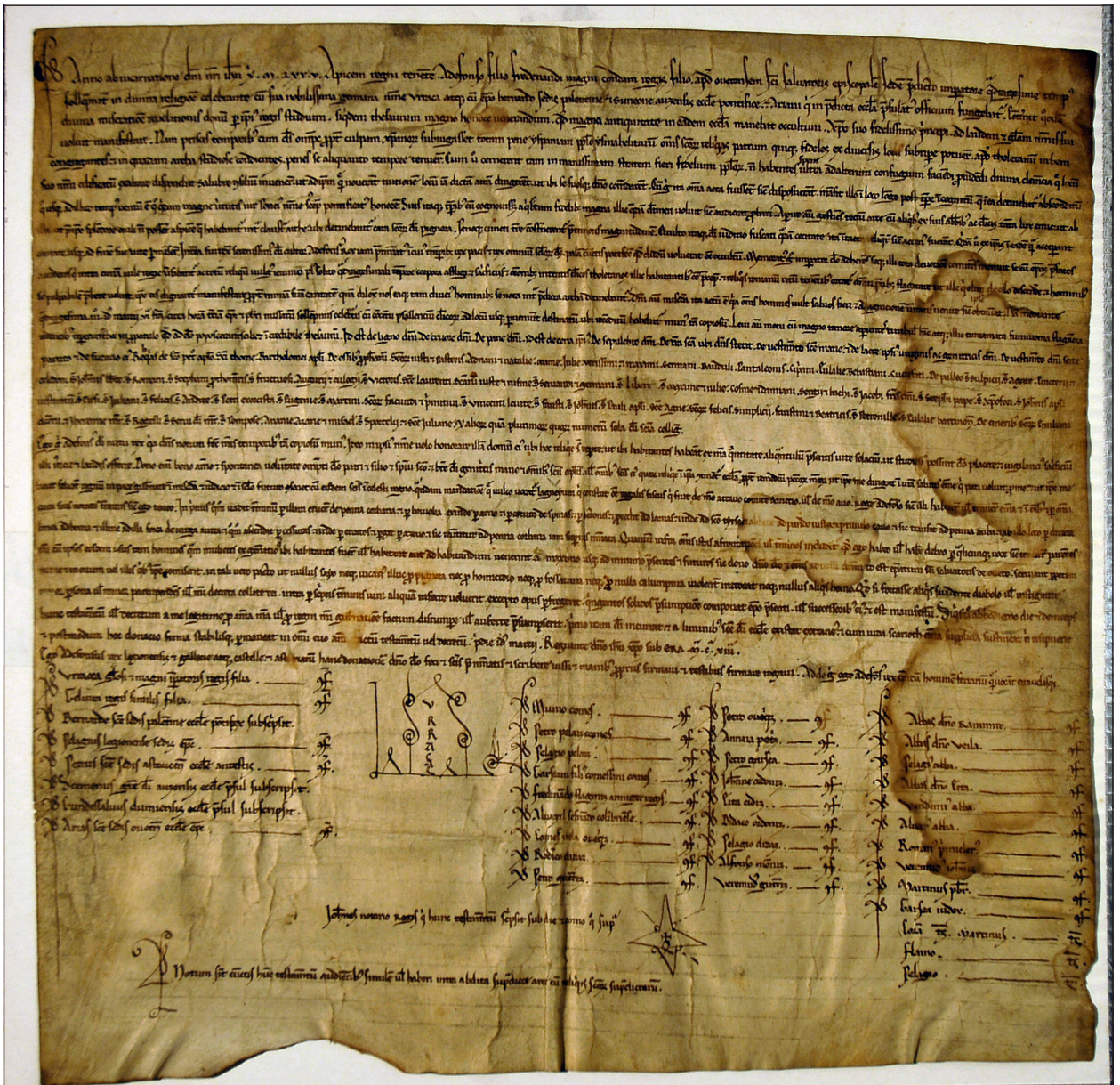
Fig. 1: Acta de apertura del Arca Santa. Archivo de la catedral de Oviedo, serie B, carpeta 2, nº 9 A