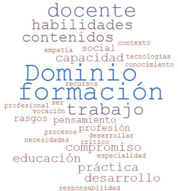
Figura 2. Nube de palabras sobre los rasgos del perfil de egreso

Los resultados de estos instrumentos fueron triangulados para conseguir una visión más comprehensiva del fenómeno que se estaba estudiando.