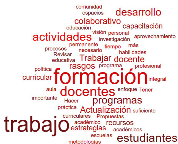
Figura 4: nube de palabras producto de las propuestas a realizar en las escuelas formadoras

Propuestas de acciones que deben de implementar las instituciones formadoras de docentes