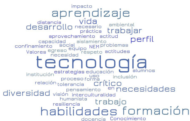
Figura 3: Nube de palabras sobre los rasgos del nuevo perfil de egreso resultante de la vivencia de la pandemia

Una vez cuestionados los docentes sobre el perfil de egreso, se les solicitó que revisaran si la pandemia y el confinamiento habían logrado incluir nuevos rasgos que debieran de considerarse en la formación de docentes. Si las problemáticas, necesidades y exigencias del contexto que se había experimentado logró re-