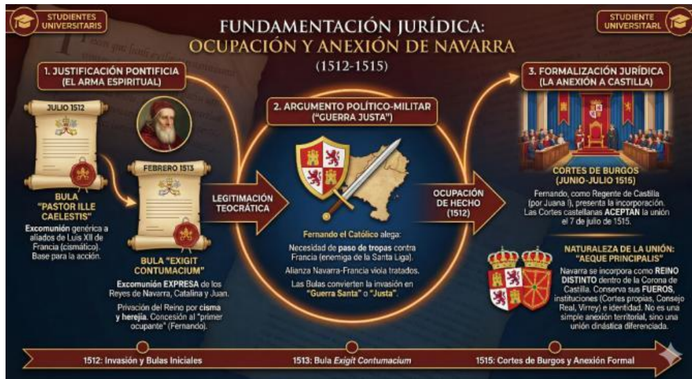
Figura 9. Fundamentación jurídica de la ocupación del Reino de Navarra por Fernando el Católico y su anexión a la Corona de Castilla. Infografía generada mediante IA (Nano Banana, Gemini).

Desde el punto de vista metodológico, el uso de la IA como herramienta de apoyo facilita, además, una adaptación progresiva de los materiales docentes a las distintas fases del aprendizaje 18 . Los profesores podemos servirnos de recursos visuales de carácter introductorio para ofrecer una primera aproximación a los contenidos, recurrir a esquemas intermedios para desarrollar los distintos elementos de la materia y, finalmente, elaborar representaciones de síntesis orientadas al repaso y a la consolidación de los conocimientos adquiridos. Todo ello contribuye a reforzar una comprensión estructural del Derecho histórico y a evitar una aproximación meramente acumulativa de normas e instituciones.