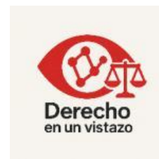
Figura 10. Logotipo PID «Derecho en un vistazo: infografías jurídicas como herramienta docente» (PID 25/26, núm. 181).

En conjunto, la experiencia desarrollada en el marco del PID «Derecho en un vistazo» muestra que la visualización del conocimiento y el uso reflexivo de herramientas digitales pueden integrarse de forma coherente en la enseñanza de la Historia del Derecho. Lejos de sustituir los métodos tradicionales, estas estrategias actúan como un complemento que facilita el acceso del alumnado a una disciplina compleja y refuerza, al mismo tiempo, el papel del docente como mediador entre el conocimiento histórico-jurídico y el proceso de aprendizaje.