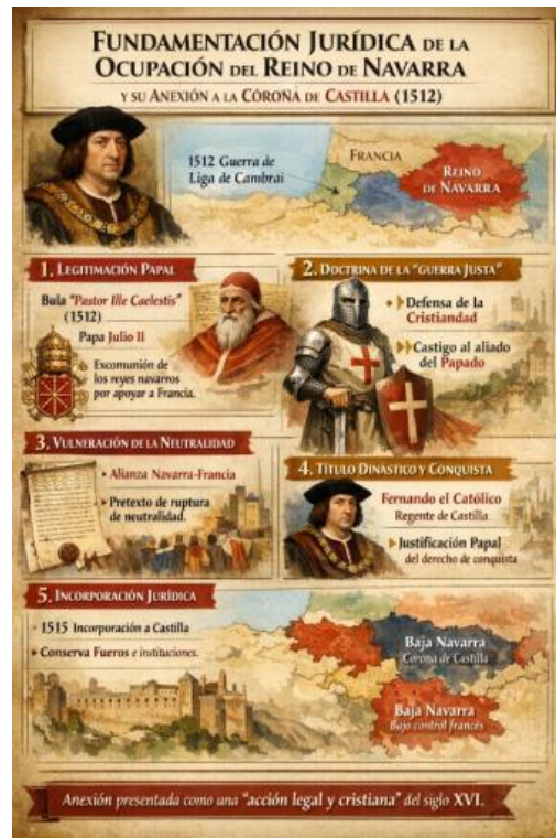
Figura 8. Fundamentación jurídica de la ocupación del Reino de Navarra por Fernando el Católico y su anexión a la Corona de Castilla. Infografía generada mediante IA (SORA).

La IA generativa Gemini , propiedad de Google, a través de su herramienta de generación de imágenes Nano Banana también permite crear infografías. Sin embargo, es cierto, que los mejores resultados los ofrece su versión premium , con el modelo pro . Sus otras configuraciones incurren en algunos errores, aunque es de esperar mejoras en futuras versiones. A continuación, se muestra un ejemplo (figura 9).