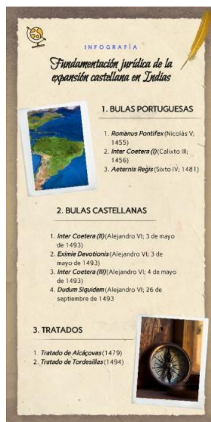
Figura 3. Fundamentación jurídica de la expansión castellana en Indias. Infografía elaborada por la autora con Genially.

Asimismo, las infografías constituyen un soporte idóneo para construir esquemas comparativos entre los ordenamientos jurídicos castellano, aragonés o navarro, así como esquemas explicativos que reflejen los instrumentos jurídicos que legitimaron la incorporación territorial a la Corona de Castilla y, posteriormente, a la Monarquía Hispánica, de territorios como las Islas Canarias, el Reino de Granada, el Reino de Navarra o las Indias (figura 3).