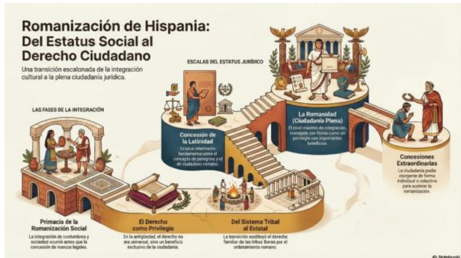
Figura 7. Proceso de romanización social y jurídica de Hispania. Infografía generada mediante IA (NotebookLM).

Asimismo, herramientas más recientes orientadas a la generación audiovisual, como Sora , abren nuevas posibilidades para la representación dinámica de procesos históricos complejos, la visualización de la pluralidad de fuentes normativas o la elaboración de esquemas comparativos entre distintos periodos u ordenamientos jurídicos, cuya comprensión exige una visión de conjunto (figura 8). Aunque su uso en la docencia universitaria se encuentra aún en una fase incipiente, estas herramientas conducen a la exploración de formas más dinámicas de representación del conocimiento, siempre como complemento a la explicación docente.